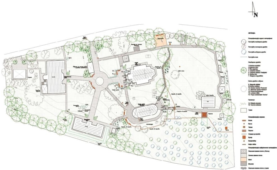
Слика 4. Композициони план

На простору порте предвиђена је употреба природних материјала , у складу с традицијом и архитектуром објеката Цркве брвнаре, Цркве Св. Илије и куће Матића. За изградњу стаза и платоа у службеном делу , предвиђене су сечене камене плоче правоугаоног или квадратног облика, неједнаких димензија.