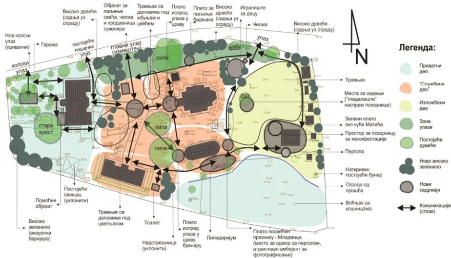
Слика 2. Концепт – План намена и садржаја

С јужне стране Цркве брвнаре, дуж стазе која води ка етно-домаћинству, предвиђен је лапидаријум на отвореном, који чине надгробни споменици постављени дуж стазе, груписани у правилном распореду. Уклањањем непримерених објеката и садржаја и посебно формирањем нових застора у овој зони, биће створена функционалнија и уређенија просторна целина. У склопу ове зоне предвиђен је и јавни тоалет који је зеленилом визуелно сакривен и који се налази у близини парохијског дома и Цркве брвнаре.