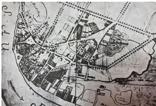
Слика 1. Карта Митровице из 1780. године

изграђена према пројекту архитекте В. Николића 1895. године. 30 После Војне крајине, па до Првог светског рата, град се почиње развијати и од тада датирају многе грађевине по типологији касарне, казонионе, болнице 31 , али и већи број грађанских кућа за чије су подизање махом заслужни трговци и занатлије. 32 Митровица почетком 20. века има преко 10 000 становника, а повољан географски положај на граници двеју царевина утицао је на развој индустрије и трговине. 33 Након 1906. године, започиње асфалтирање улица и тргова, али још увек преовладавају макадамски путеви. Пре почетка Првог светског рата, град је имао и уличну расвету. 34 Када је 1918. године ослобођена од Хабзбуршке власти, под коју је потпала Пожаревачким миром 1718. године, Митровица постаје саставни део нове југословенске државе и при том добија префикс Сремска . 35