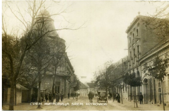
Слика 2. Централна зона Сремске Митровице 1932. године

документ је био Правилник о изради регулационих планова , из 1934. године, који се бавио детаљима на нивоу пројекта регулације. 41 Ипак већих урбанистичких и археолошких подухвата у Сремској Митровици у међуратном периоду није било, а једина урбанистичка документација заснивала се на појединачним објектима. 42