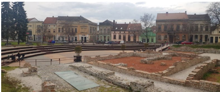
Слика 4. Житни трг, Сремска Митровица, 2021.