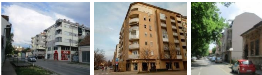
Слике 3, 4 и 5. Примери нових стамбених зграда у Зрењанину, Кикинди и Сомбору (аутор: Б. Антонић)

у великом раскораку с привредним суновратом на основу пропасти планске привреде, услед рата и пратећег економског ембарга. Ово се одразило и на градски простор; дошло је до раста без развоја, кроз ширење непрописно подигнутих стамбених насеља породичних кућа на ободима градова. 24 Старији средишњи делови градова су углавном таворили током 1990-их. Једино је дошло до појаве приватног сектора у трговини, али махом у виду ситне трговине, што је било у складу с првом фазом развоја тржишта других постсоцијалистичких градова. 25