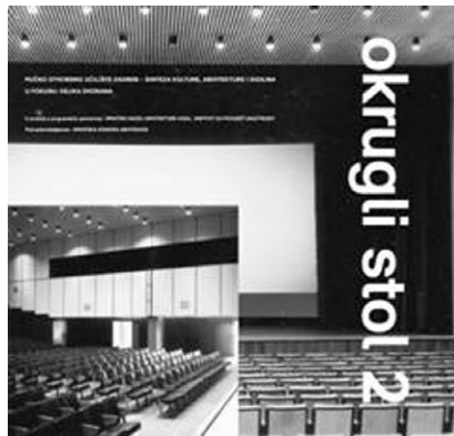
Slika 2. Pozivnica za Drugi okrugli stol, „Pučko otvoreno učilište – sinteza kulture, arhitekture i dizajna“. U fokusu: velika dvorana, Pučko otvoreno učilište, Zagreb, 2018. Oblikovanje: Damir Gamulin, Nives Sertić