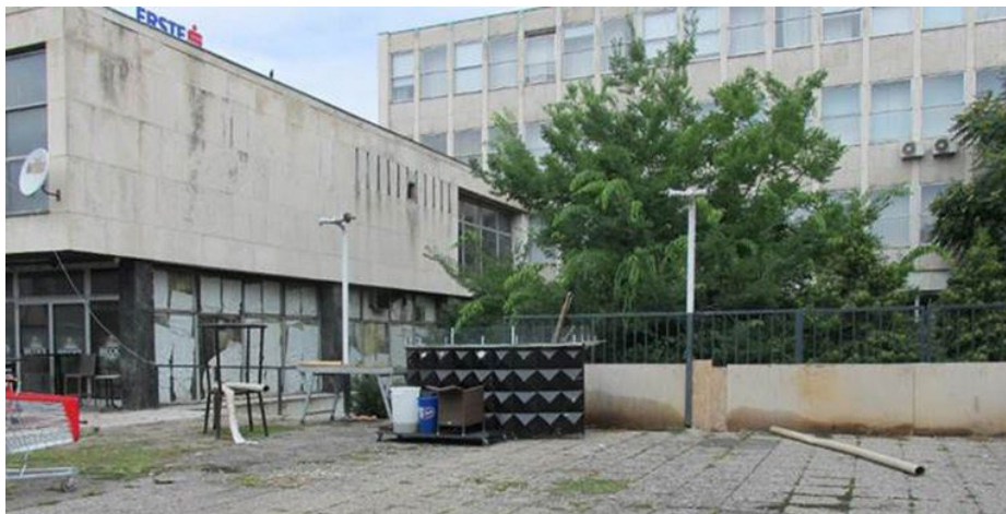
Slika 4. Zgrada nekadašnjeg RANSA-a, danas Pučko otvoreno učilište, stanje 2020.