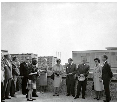
Slika 3. Otvorenje Radničkog sveučilišta „Moša Pijade“, 1961. Fotografija Šime Radovića, na kojoj su predsjednik SFRJ Josip Broz Tito i Jovanka Broz, Vladimir Bakarić i tadašnji gradonačelnik Zagreba Većeslav Holjevac (izvor: Muzej grada Zagreba)