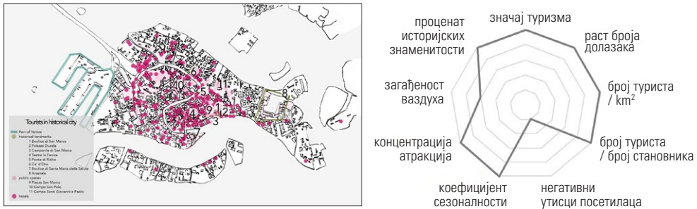
Слика 1. Венеција, мапа историјског језгра града и подручја главних туристичких интеракција (према: TripAdvisor, https://www.tripadvisor.rs/ ), са резултатима анализе оптерећења туризмом

планирања и контроле. Услед потребе примене система праћења управљањем локалитетима Светске баштине, у овом документу се сугерише, између осталог, (1) процена рањивости локалитета на социјалне, економске и еколошке промене, те (2) циклус планирања, примене, праћења и процене деловања.