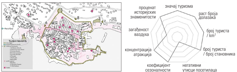
Слика 2. Дубровник, мапа историјског језгра града и подручја главних туристичких интеракција (према: TripAdvisor, https://www.tripadvisor.rs/ ), са резултатима анализе оптерећења туризмом

Према анализи оптерећења туризмом, може се сматрати да је Дубровник под врло високим ризиком од преоптерећења, с обзиром на 7 од 9 параметара високо изнад горње границе ризика (слика 2). Због посебно високих параметара густине и интензитета тури-