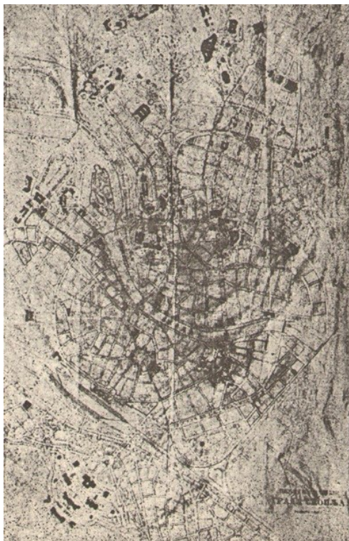
Слика 3. Димитрије Т. Леко, Генерални урбанистички план Скопља

основу Лековог плана из 1914. године. Вођен урбанистичким замислима Д. Т. Лека, Михајловић је успео да реализује трансформацију Скопља из оријенталног, турског града у модеран, европски град .