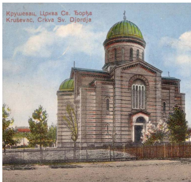
Сл. 3. Црква Свештој Ђорђа у Крушевцу, ошћити изглед, разгледница, око 1930. године (извор: https://www.restoranbagdala.com/almanah-bagdalske-price-istorija-bagdala/podbagdalski-dragulji-saborna-crkva-svetog-dorda [12. 4. 2022])