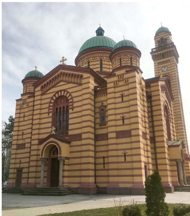
Сл. 4. Црква Свете Тројице у Бањалуци, ошћити изглед