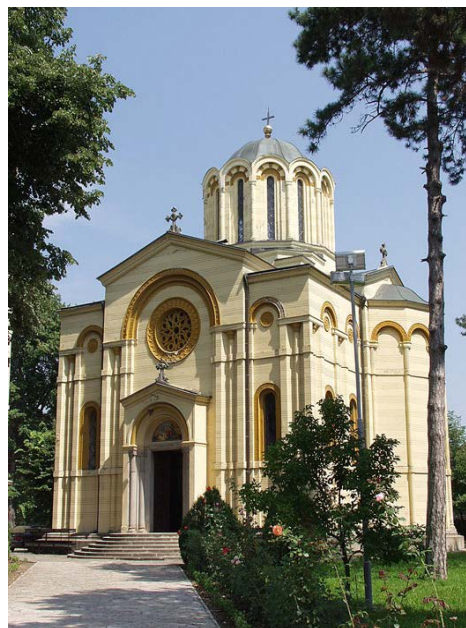
Сл. 2. Црква Свете Тројице у Трсџенику, њрочелје (извор: https://www.trstenik.rs/index.php/nasaproslost/144-crkva-svete-trojice?tmpl=component [17. 4. 2022])