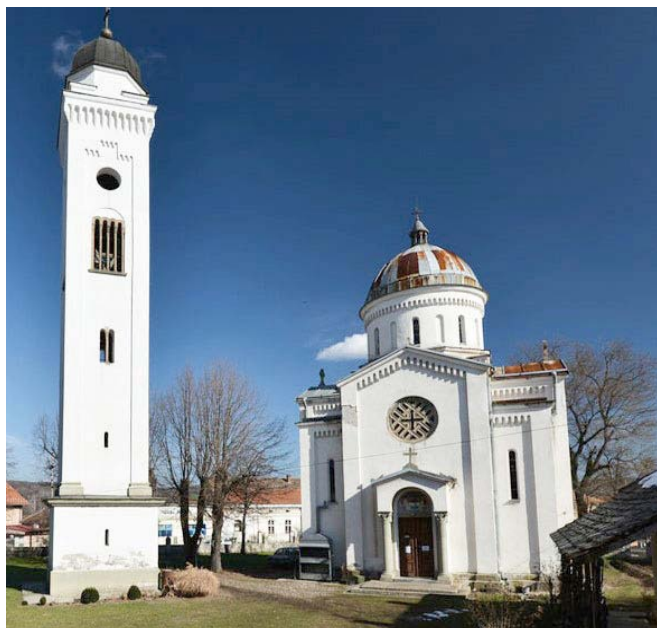
Сл. 1. Црква Свете Тројице у Вражојрнци, звоник и зајадна фасада