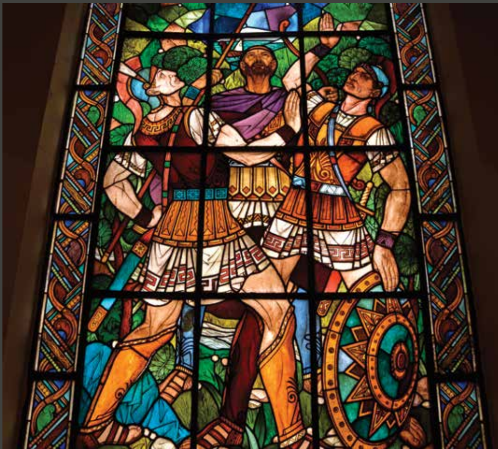
Деталь вітража Stained glass detail