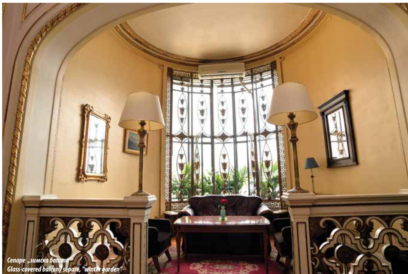
Сенаре „зимска башта“ Glass-covered balcony separé, “winter garden”