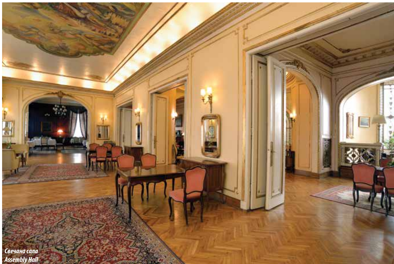
Свечана сала Assembly Hall

air shows, and was a stamping ground for the Belgrade elite. However, as the Aero Club did not have a common office, a decision was made to build a structure specially for that purpose. The funds for the acquisition of the land and the construction works on the Aero Club Building were raised in three years' time through lottery and donations, so the building was in fact an endowment. In order to secure regular monthly proceeds for supporting the pilot training school, the gliding school, and the Club magazine Our Wings , the commercial space on the ground floor and the apartments on the upper floors were supposed to be let. With the Assembly Hall on the first floor of the Club, well-suited for the gatherings of club member and other aviation sympathizers, the Aero Club became a favourite and much-frequented social centre in the Kingdom's capital. It was closed during the World War II, and was reestablished primarily as Aeronautical Society of