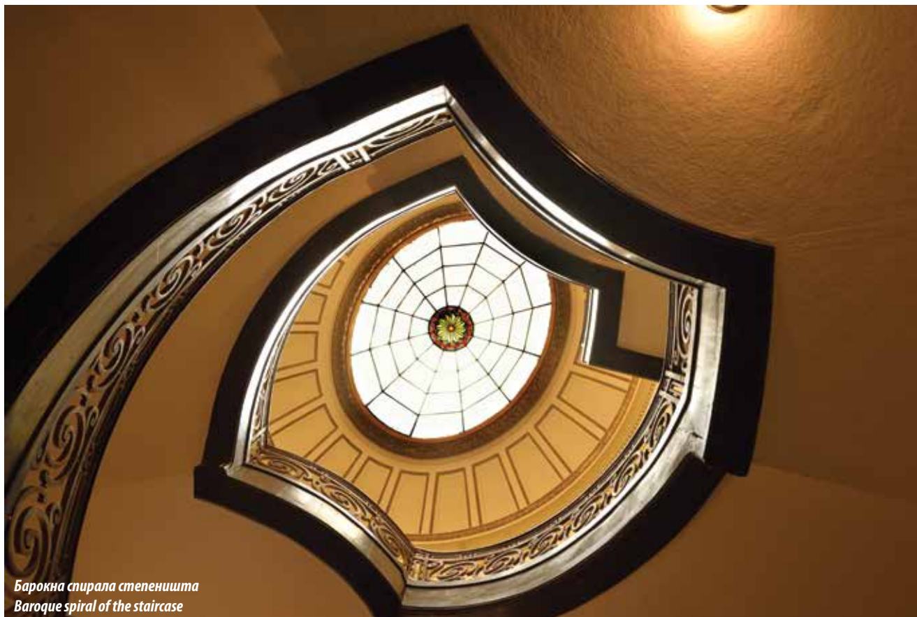
Барокна спирала степеништа Baroque spiral of the staircase