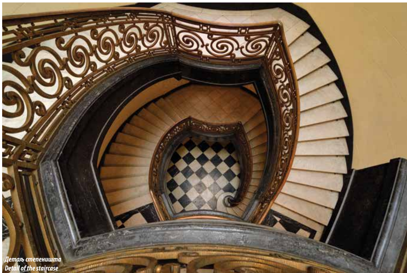
Детаљ степеништа Detail of the staircase

надзор од пожара и друге активности. Обједињавао је све установе цивилног ваздухопловства окупљањем чланова, организовањем конференција и аеро-митинга, али је био и стециште београдске елите. Међутим, како није било заједничких просторија Аеро клуба, решено је да се подигне наменски објекат, а средства за куповину земљишта и градњу Дома Аеро клуба прикупљена су за три године од лутрија и донација, тако да је грађевина имала задужбински карактер. Планирано је и издавање трговинских простора у приземљу, као и рентирање станова на вишим спратовима да би Аеро клуб имао редовне месечне приходе за потребе пилотске школе, школе једрења и часопис клуба Наша крила. На првом спрату Дома налазила се репрезентативна сала за свечаности, посебно уређена за окупљање чланова клуба и других пријатеља ваздухопловства.