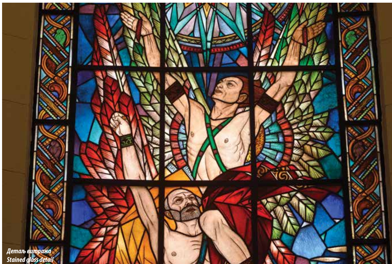
Детаљ витража Stained glass detail