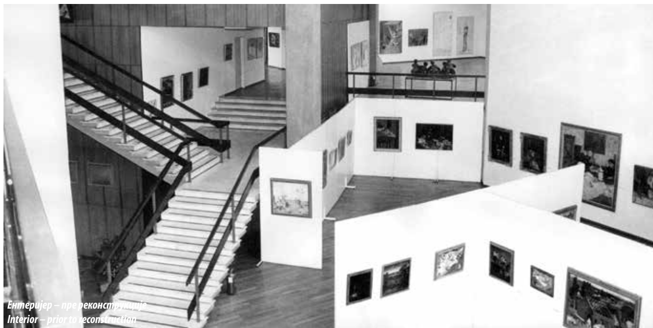
Ентеријер – пре реконструкције Interior – prior to reconstruction

је успостављање нових методолошких дисциплина, као што је истраживање модерне архитектуре у Србији, презентације концептуалне уметности и нових уметничких медија. Фонд музеја формирао се још у време оснивања Модерне галерије, да би у тренутку када је Музеј отворен бројао 3.500 дела. Колекцију музеја чине: збирка сликарства од 1900. до 1945. године, збирка сликарства после 1945. године, збирка скулптура, збирка графика и цртежа и збирка нових уметничких медија (фотографија, филм, видео итд.). У саставу Музеја ради и Салон музеја савремене уметности и 12 легата.