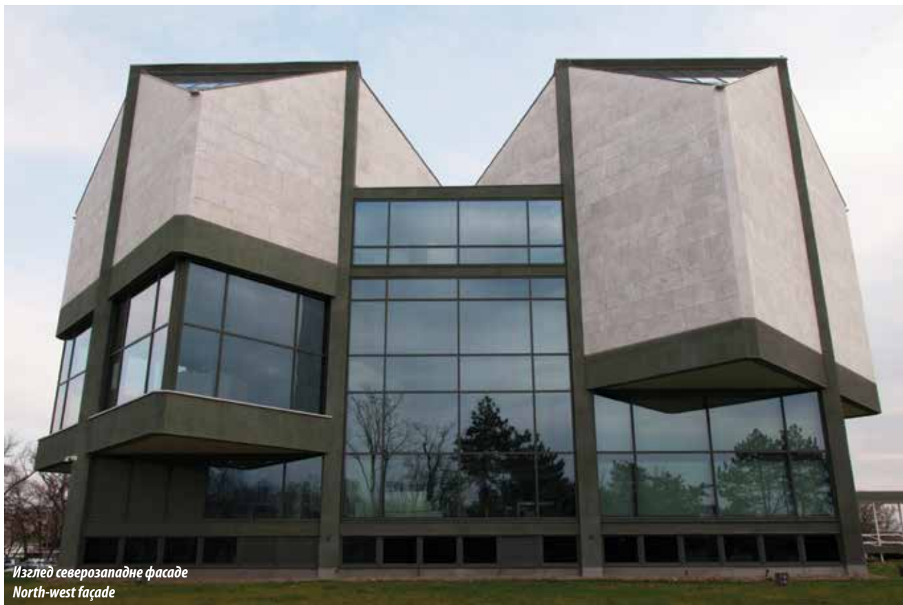
Изглед северозападне фасаде North-west façade

The building of the Belgrade Museum of Contemporary Art was the first joint design of architects Ivan Antić and Ivanka Raspopović, whose works made an impact on the national architecture of the second half of the 20 th century. The competition for the best design of the Modern Gallery building, later renamed the Museum of Contemporary Art, was officially opened for submissions in 1960, with the construction works starting only a year later, in 1961. On October 20 th , 1965, the Museum of Contemporary Art in Belgrade (MoCAB) was opened for public.