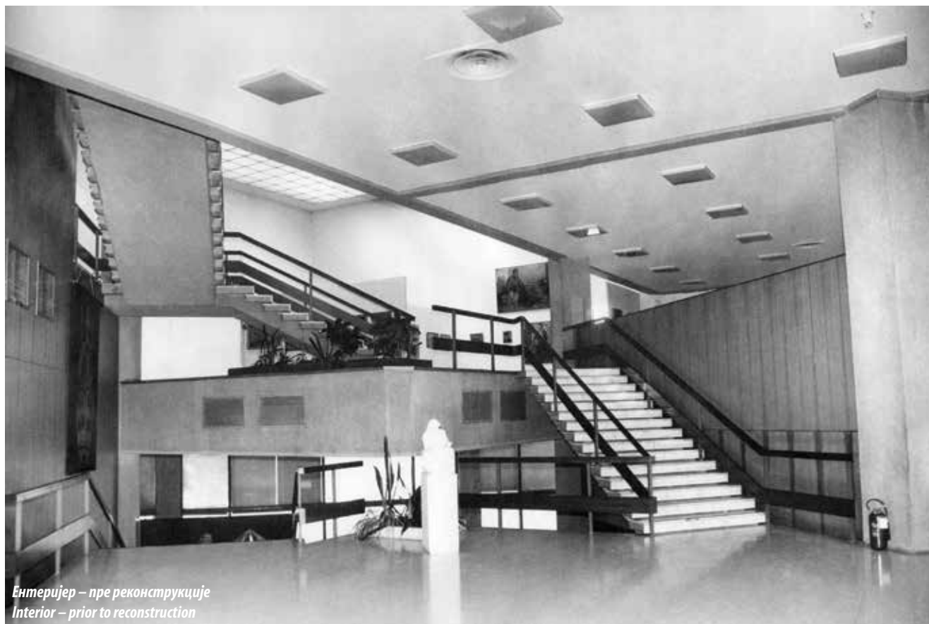
Ентеријер – пре реконструкције Interior – prior to reconstruction

каскадним обликовањем спратних нивоа, док је визуелна повезаност с околином постигнута смештањем простора између модуларних елемената из којих се пружају широке визуре ка окружењу објекта.