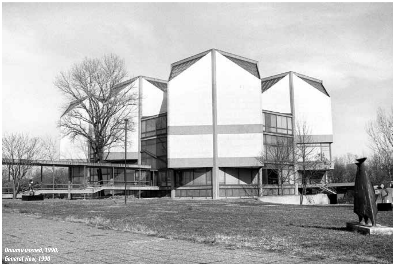
Општи изглед, 1990. General view, 1990

садржајима. Међутим, како до реализације плана није дошло, будуће здање Музеја савремене уметности остало је усамљено на овом потезу и у идеалном амбијенту поред река, наспрам Београдске тврђаве, те на тај начин остварује битну улогу као елемент у слици града, као што градски амбијент и природа добијају улогу својеврсног експоната унутар Музеја у оквиру музејске поставке.