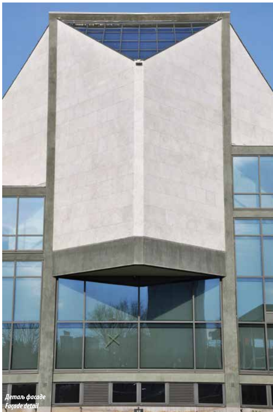
Деталь фасаде Facade detail

The actual building differs from the conceptual design in several elements: instead of five, the building consists of six equal reinforced concrete