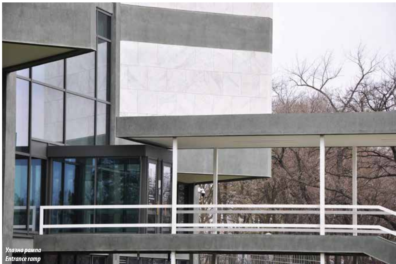
Улазна рампа Entrance ramp

cubes with cut corners at the roof. The conceptual design envisaged faces of the building covered in bricks, while the actual facing is made of Venčac pale grey marble. Such solution only reinforced the morphyic crystal-like impression of the building, turning into the main feature of the MoCAB's visual identity.