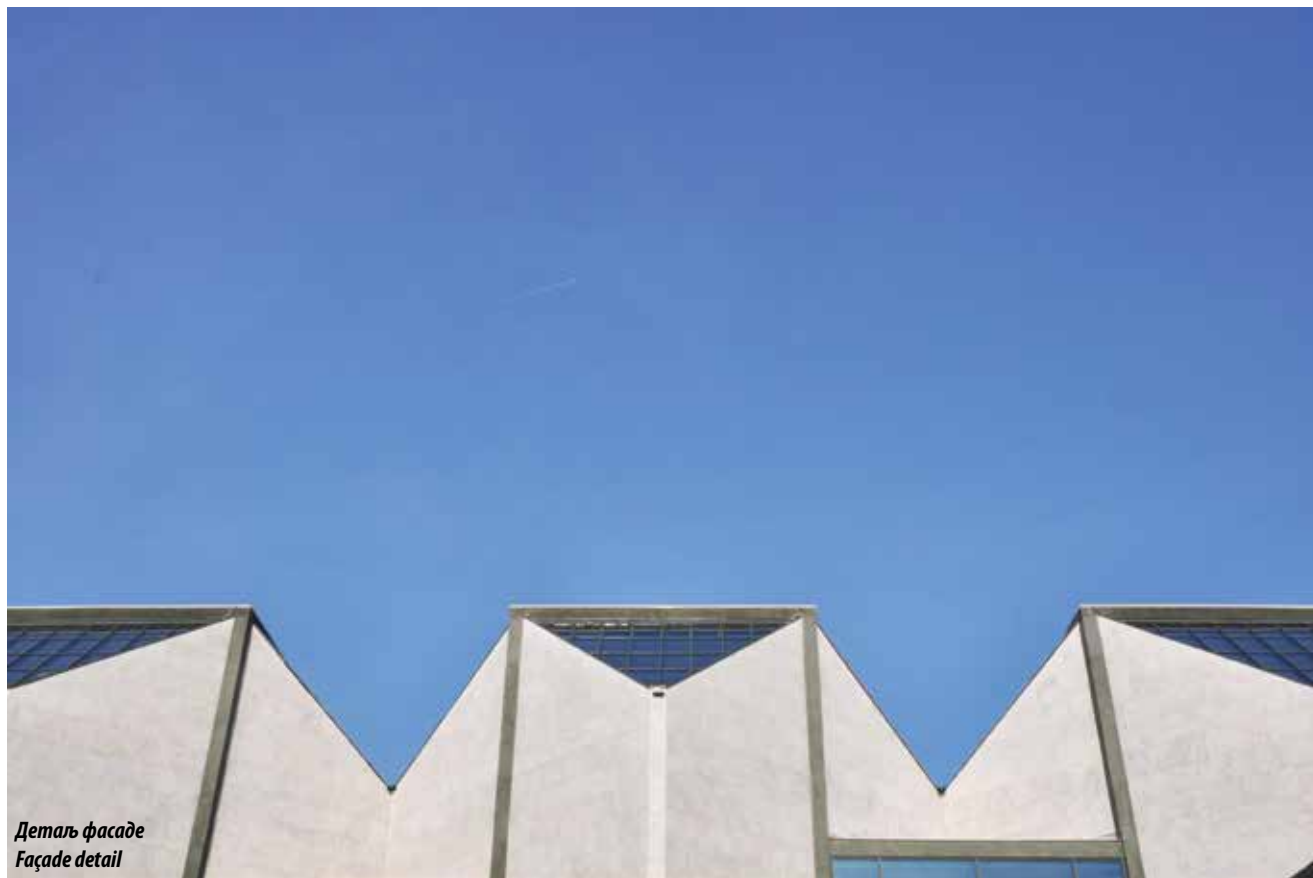
Детаљ фасаде Facade detail

Музеј савремене уметности у Београду представља први заједнички пројекат архитеката Ивана Антића и Иванке Распоповић, који су својим стваралаштвом утицали на развој домаћег градитељства друге половине XX века. Конкурс за израду пројекта за Модерну галерију, касније преименовану у Музеј савремене уметности, расписан је 1960, а изградња је започела већ 1961. године. Након четири године, 20. октобра 1965, Музеј савремене уметности у Београду отворен је за јавност.