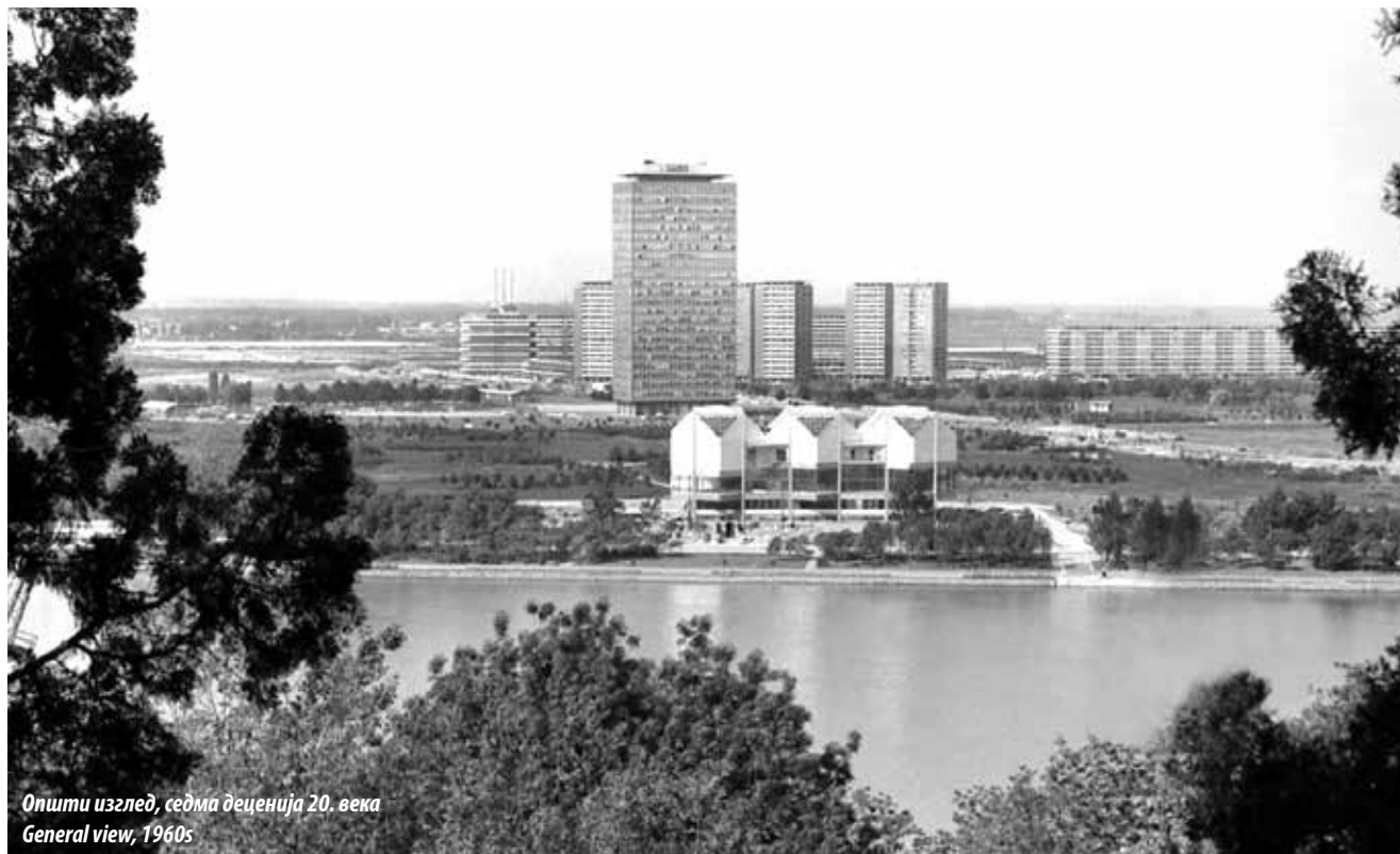
Општи изглед, седма деценија 20. века General view, 1960s

No significant changes were made to the MoCAB building for years, following its construction and the opening of the museum in 1946. However, technical installations that were state-of-the-art at the time the facility was built, four decades later were dilapidated and obsolete, so the activities on planning the restoration and revitalisation of the facility started in 2002. Adaptation, restoration and revitalisation of the facility did not reach final stages until August 2016. The works were completed in October 2017, when MoCAB was officially reopened to the public.