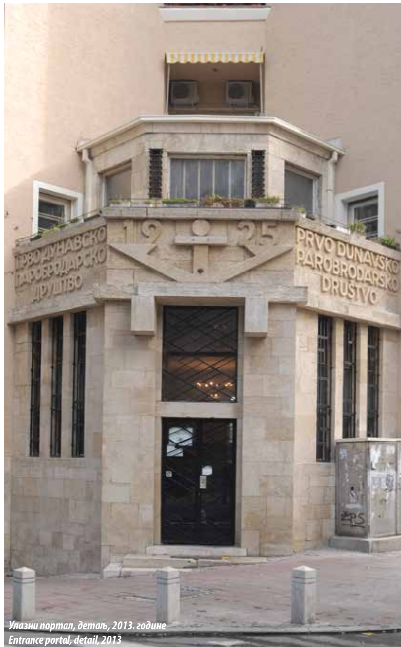
Улазни портал, детаљ, 2013. године Entrance portal, detail, 2013

Снажно наглашена и структурно разуђена угаона партија зграде компонована је тако да представља њену доминанту, а у време настанка објекат је био маркантан урбани репер ширег подручја. Овај део изведен од масивних кубуса у четири етаже с поткровљем, за један спрат надмашује бочна крила и својом динамиком и распоредом маса наглашава вертикализам и монументалност зграде. На левој унутрашњем лицу угаоне партије налази се велики часовник. Нарочито је карактеристичан мотив преломљеног лука у отвору смештеном на етажи поткровља, као и два јарбола који још више доприносе утиску вертикализма. На бочним зидовима угаоног дела постављен је вертикалан низ троструких прозора обрађених у сведеној, геометризованој декоративној структури. Улазни вестибил изведен у зони приземља, трапезоидног је облика и својим волуменом излази из засеченог дела угаоне партије. Просторно и ликовно је конципиран тако да представља главни мотив грађевине. Његови витки бочни отвори и високо надсветло изнад портала, одају утисак транспарентности, али уједно и масивности структуре обрађене у камену. У централном делу фриза изнад портала смештено је сидро као симбол компаније и урезана година: 1925. У бочним деловима фриза стоје ћирилични и латинични натпис: Прво Дунавско паробродарско друштво . Бочна крила зграде, која се простиру дуж улица Господар Јевремове и Капетан