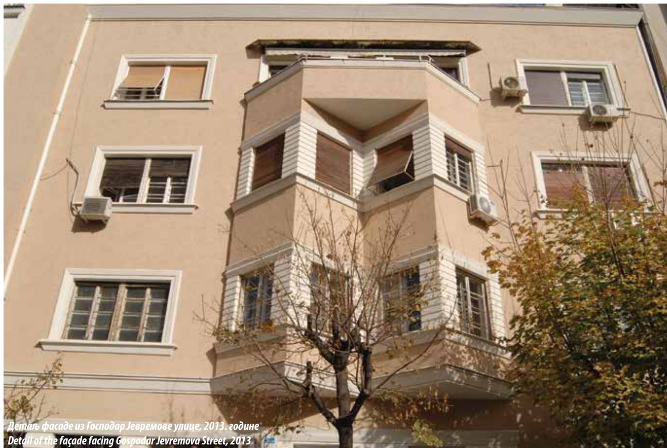
Деталь фасаде из Господар Јевремова улице, 2013. године Detail of the façade facing Gospodar Jevremova Street, 2013

the company, as well as the carved year – 1925. The lateral sections of the frieze have the inscription in Cyrillic and Latin alphabet – The First Danube Steamship Company . The lateral wings of the building, running along the Gospodar Jevremova and Kapetan Mišina streets, are built in a simpler fashion. Verticalism is not underlined here; rather, the spatial dynamic is underscored with the rhythmic arrays of bay windows at first and second floors. The narrower façade facing Gospodar Jevremova Street has a couple of vertical bay windows, while the front section facing Kapetan Mišina Street has four.