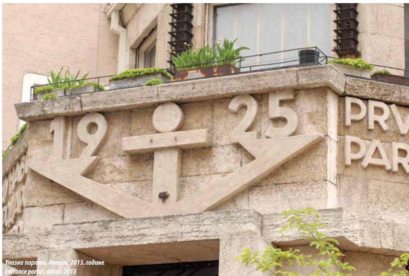
Улазни портал, детаљ, 2013. године Entrance portal, detail, 2013