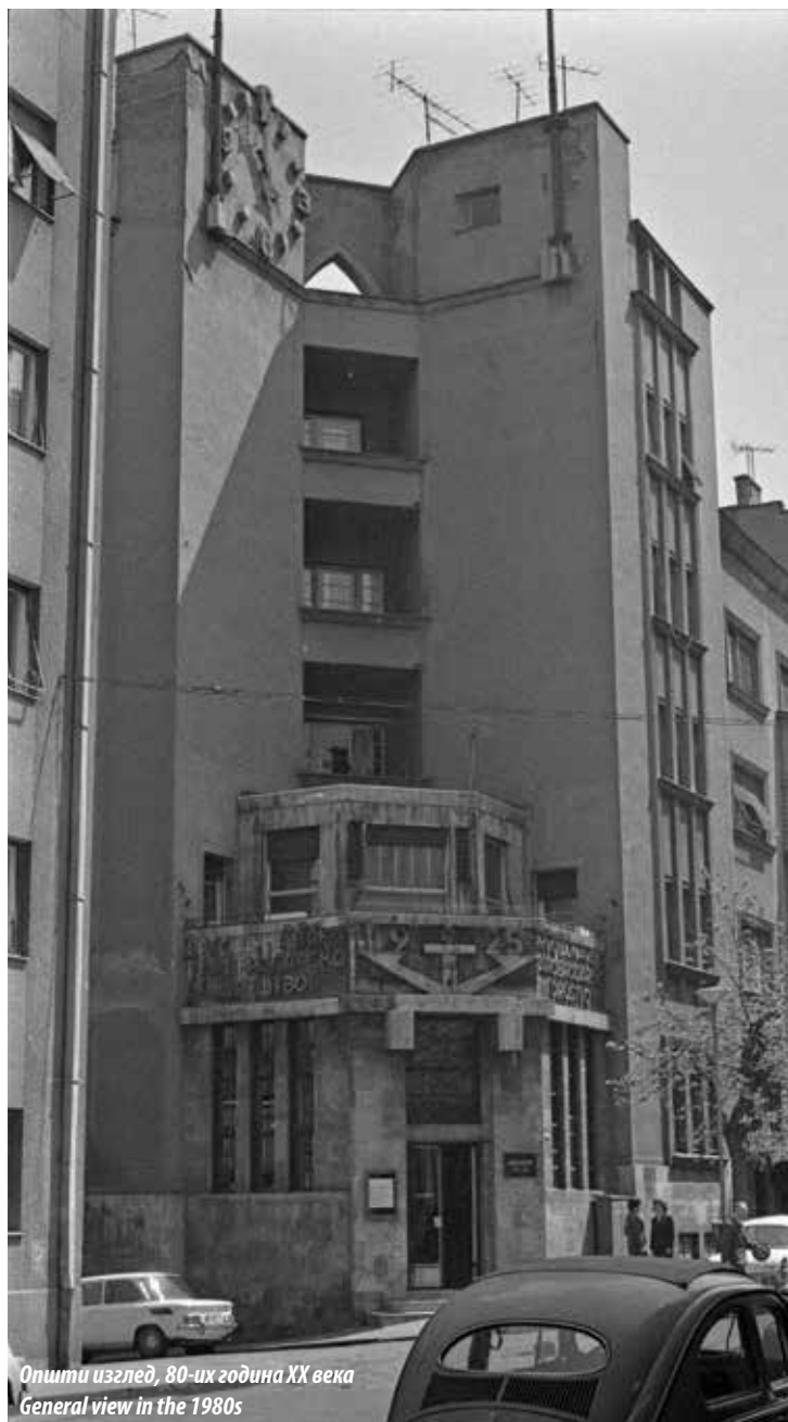
Општи изглед, 80-их година XX века General view in the 1980s

Мишине, једноставније су решена. Овде нема акцентовања вертикализма, већ је наглашена просторна динамика са ритмованим низовима еркера у зони првог и другог спрата. На ужој фасади ка Господар Јевремовој улици изведен је пар вертикалних еркера, док су на фронту ка Капетан Мишиној реализована четири.