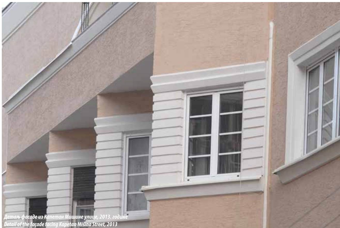
Деталь фасаде из Капетан Мишине улице, 2013. године Detail of the façade facing Kapetan Mišina Street, 2013

terms of its dimensions and the stylistic features.