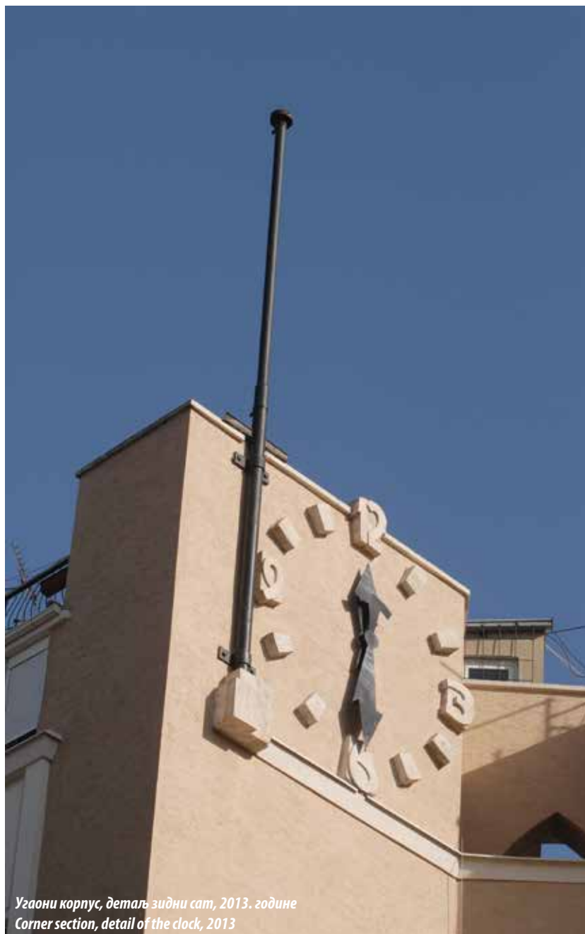
Угаони корпус, детаљ зидни сат, 2013. године Corner section, detail of the clock, 2013