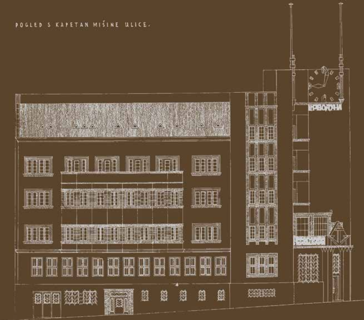
Техничка документација, изгледи фасада Technical documents, façade layout