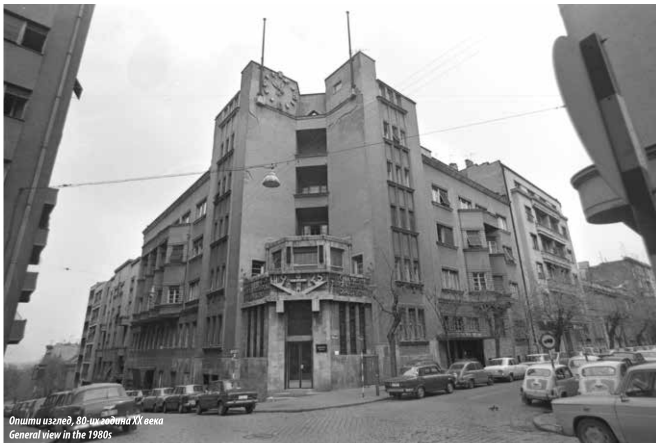
Општи изглед, 80-их година XX века General view in the 1980s

Зграда представништва Првог дунавског паробродарског друштва [Der 1. Donau Dampfschiffahrts-Gesellschaft, DDSG] у Београду подигнута је у периоду између 1924. и 1926. године, на углу улица Капетан Мишине и Господар Јевремова. За потребе изградње стамбено-пословног објекта DDSG-a , још новембра 1923. године стигли су идејни пројекти архитекте Александра Попа [Alexander Popp] из Беча, где је и било седиште компаније. С обзиром на то да је пројекат било потребно разрадити, прилагодити конфигурацији терена и направити одговарајући унутрашњи распоред у складу с потребама