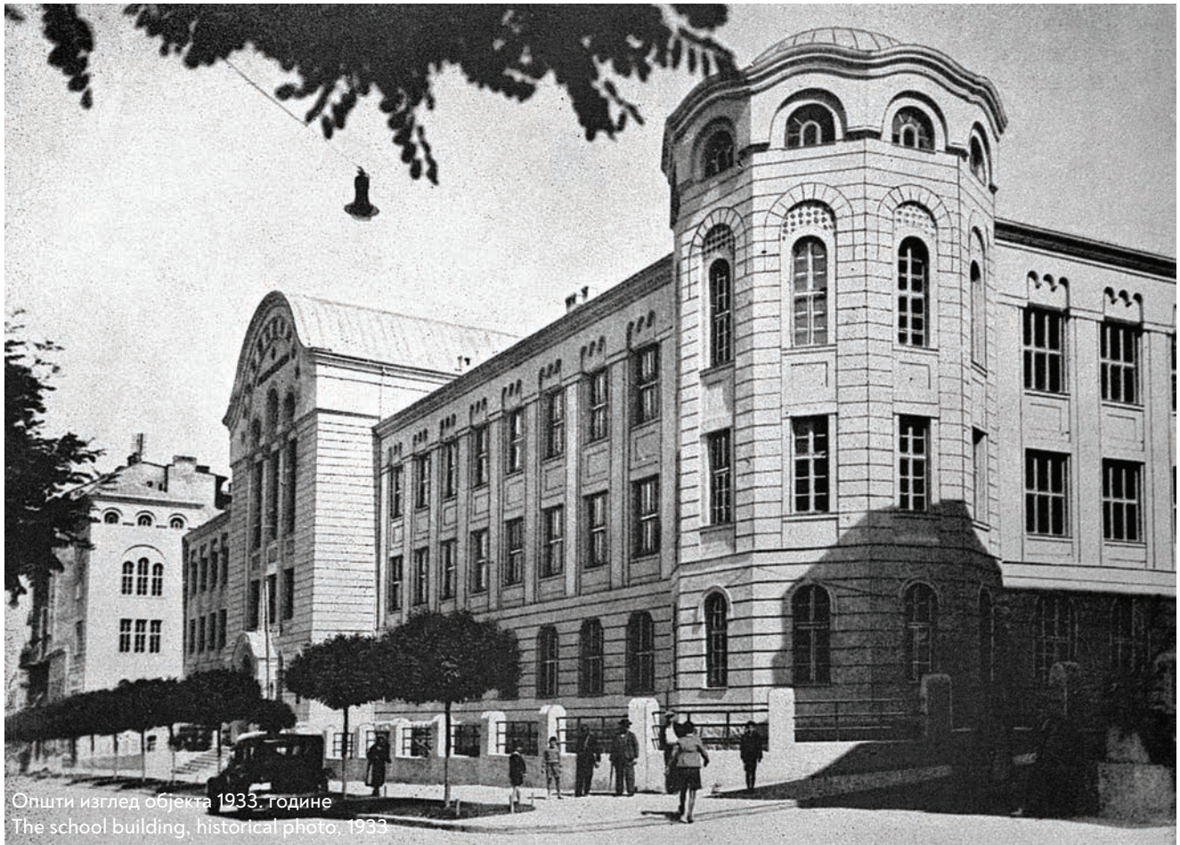
Општи изглед објекта 1933. године The school building, historical photo, 1933