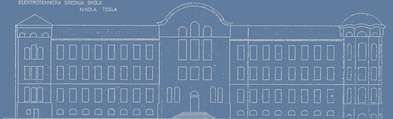
fasada iz ul. Narodnog fronta