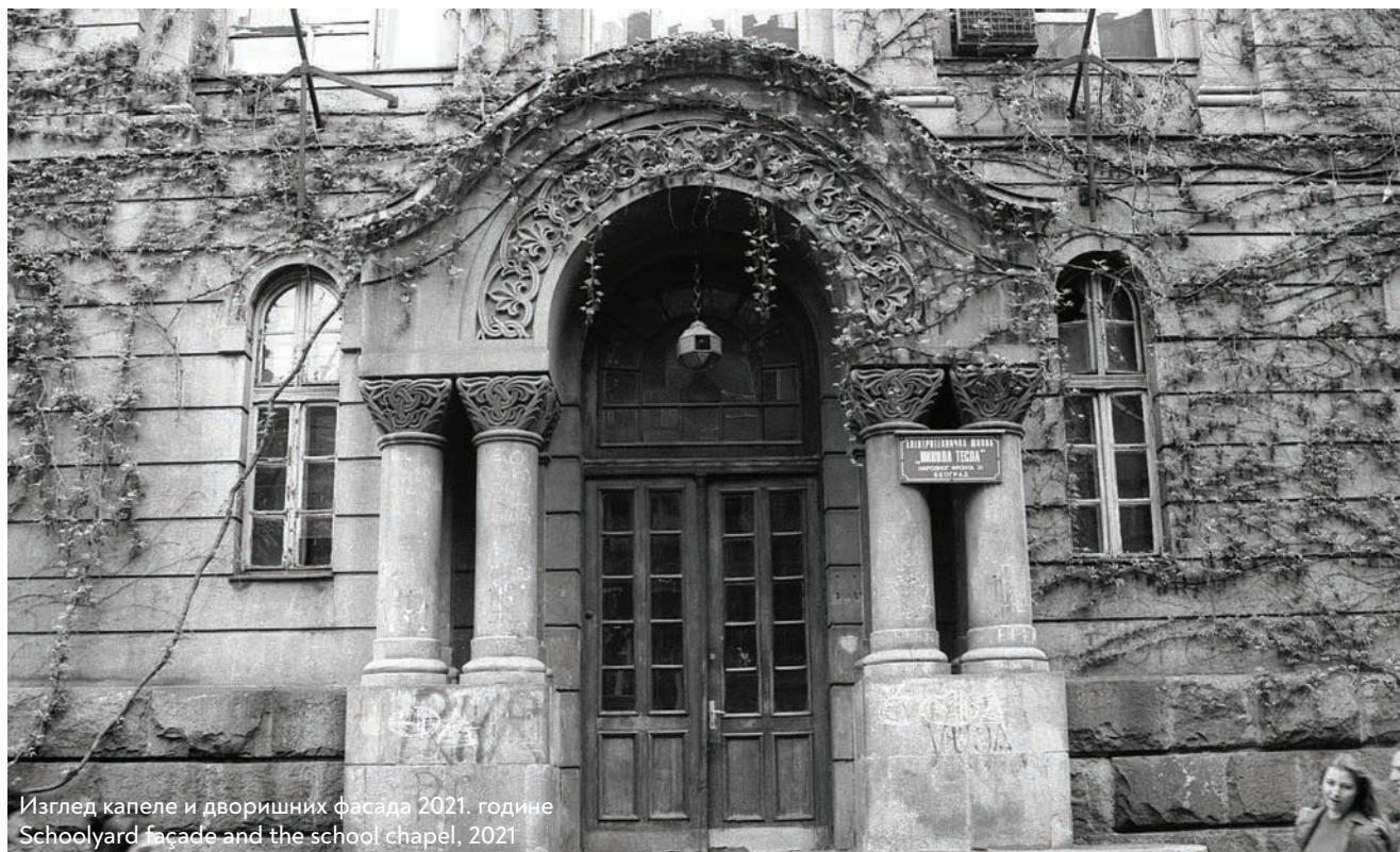
Изглед капеле и дворишних фасада 2021. године Schoolyard façade and the school chapel, 2021