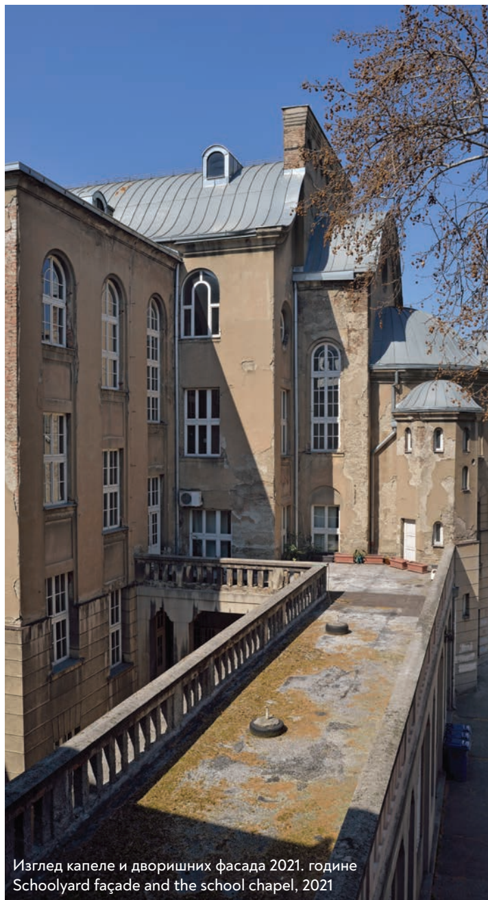
Изглед капеле и дворишних фасада 2021. године Schoolyard façade and the school chapel, 2021