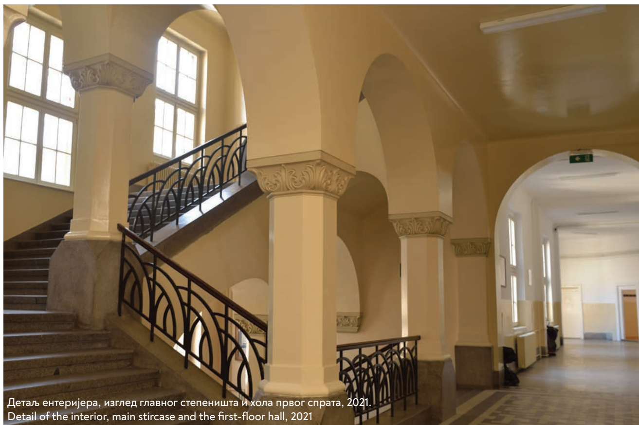
Детаљ ентеријера, изглед главног степеништа и хола првог спрата, 2021.

Detail of the interior, main staircase and the first-floor hall, 2021