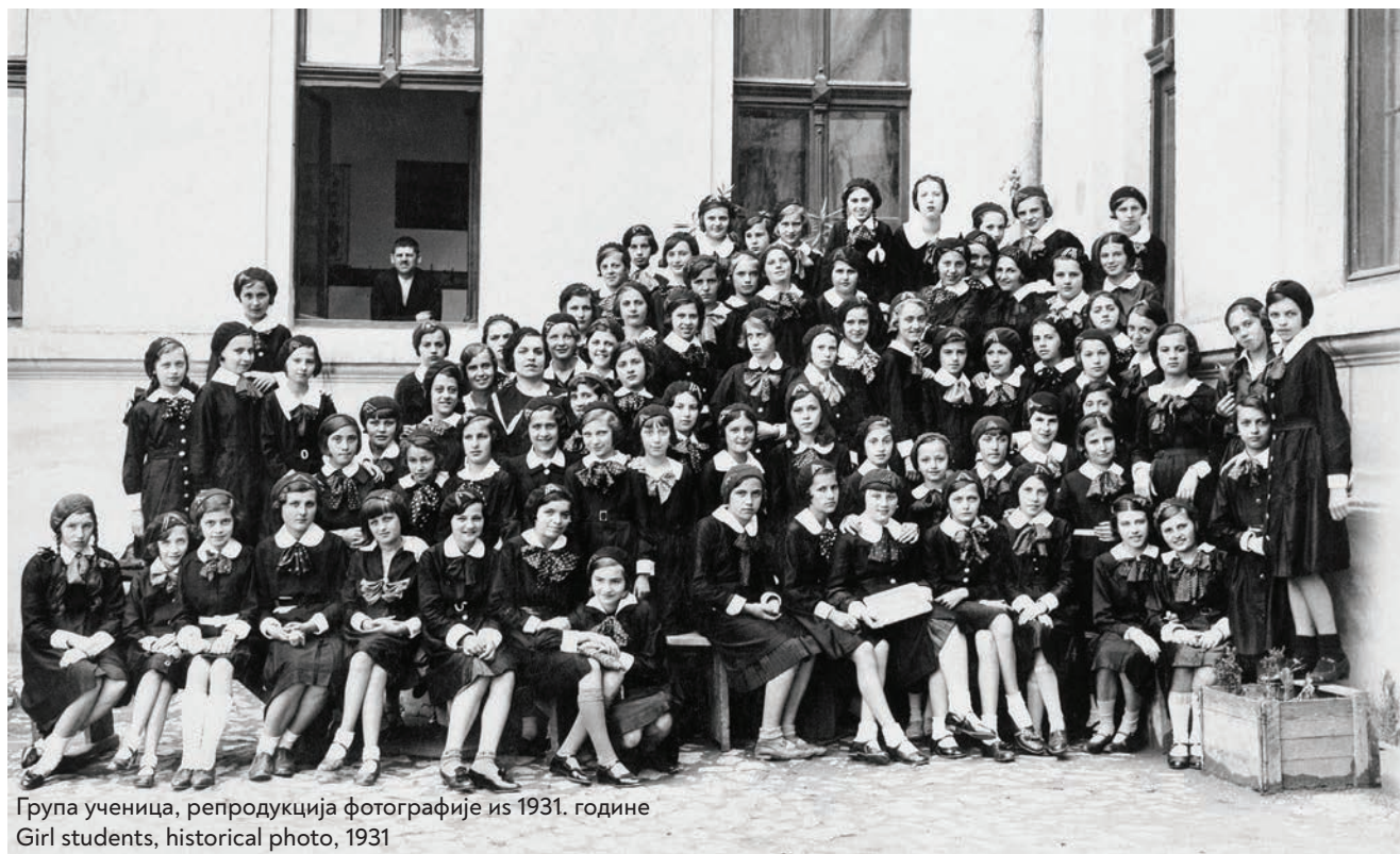
Група ученица, репродукција фотографије из 1931. године Girl students, historical photo, 1931