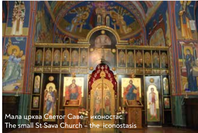
Мала црква Светог Саве – иконостас The small St Sava Church – the iconostasis