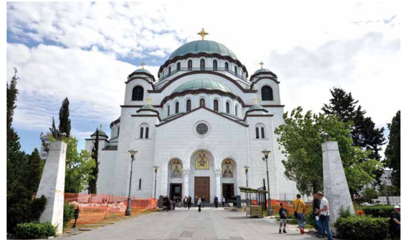
Храм Светог Саве The Cathedral Church of Saint Sava

На највишој коти Врачара – 134 м – налази се некада стратешки најважније место у свим биткама за одбрану Београда, називано Врачарско поље. У каснијем формирању и уређењу, да би се избегло шире сагледавање ранијег обухвата Врачара, простор између улица Крушедолске, Катанићеве, Боре Станковића, Скерлићеве, Небојшине и Булеvara ослобођења, преименован је у Светосавски плато. Окружују га амбијенталне целине – некадашњи Енглезовац (од 1895. Савинац), Чубура, Котез Неимар, као и Карађорђевог парк. У оквиру целине