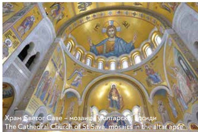
Храм Светог Саве – мозаици у олтарској апсиди The Cathedral Church of St Sava, mosaics in the altar apse

српског устанка, а Народна библиотека Србије, Споменик Карађорђу, нови парохијски дом и Споменик Светом Сави подигнути су у обележавању сто педесете, сто седамдесет пете и двестоте годишњице овог догађаја, који симболише ослобођење Србије од турске власти. Синан-паша је 10. маја (27. априла по старом календару) 1594. године наредио да се мошти Светог Саве (1174–1236), које су почивале у манастиру Милешеви, донесу у Београд и спале, као претња српском отпору против власти султана Мухамеда Трећег. Проучавањем турских извора, потврђено је да се спаљивање моштију десило, али је по свему судећи део моштију ипак остао сачуван, о чему током 17. и 18. века сведоче записи путописаца, као и на иконама, о даривању и целивању руке Светог Саве. Од 1840. године у Кнежевини Србији уводи се прослављање Светог Саве као школске славе и истражује место спаљивања његових моштију. Крајем века, 1895. године, на тридесет и стотину угледних Београђана основали су Друштво за подизање храма Светог Саве на Врачару , које се ангажовало на прикупљању прилога за изградњу. Сама идеја о потреби подизања храма потиче из 19. века. У изворима се, неодређено, на источном Врачару помињу црква и ограђен простор на месту спаљивања моштију још од краја 16. века, за које не постоје материјални остаци. Постоје подаци да је ограда око светог места порушена у рату 1716/1717. и да је ту била подигнута црква за време друге аустријске владавине, све до 1757,