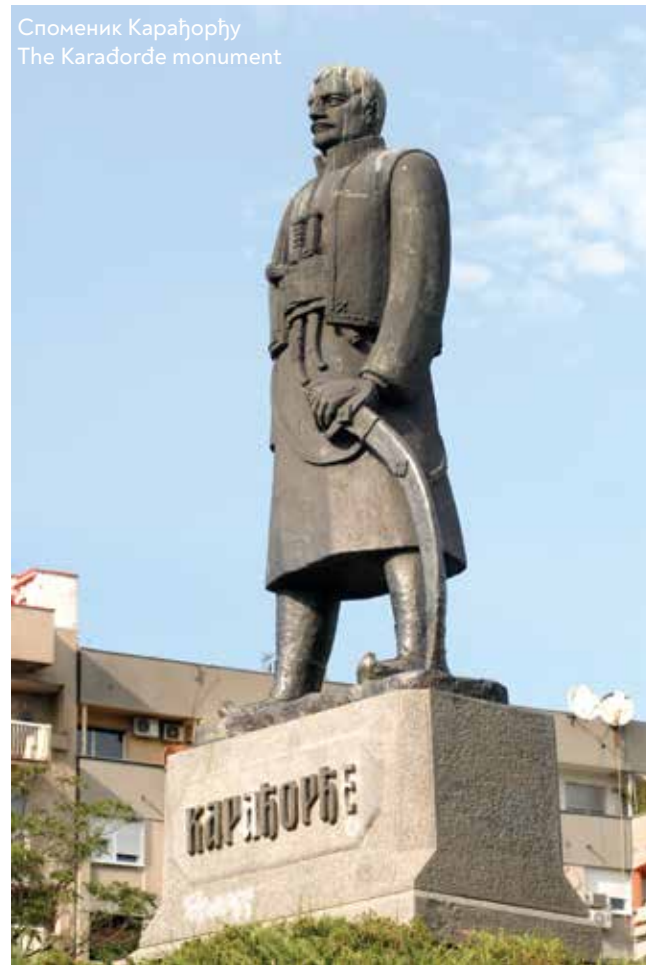
Споменик Карађорђу The Karađorđe monument

Bogunović, S. G. (2005), Arhitektonska enciklopedija Beograda XIX i XX veka : arhitektura, arhitekti, pojmovi, tom 1 i 2, [Arhitektura; Arhitekti], Beograd. Đurić Zamolo, D., Nedić, S. V. (1993/1994), Savinac, u: Stambeni delovi Beograda i njihovi nazivi do 1941. godine, Godišnjak grada Beograda (GGB) XL/XLI (Beograd). Izveštaj o radu Društva za ulepšavanje Vračara za 1904. godinu , od 2.2.1905. Jovanović, M. (1987), Srpsko crkveno graditeljstvo i slikarstvo novijeg doba , Beograd : Društvo istoričara umetnosti Srbije ; Kragujevac : Kalenić. Kanić, F. (1986), Srbija, zemlja i stanovništvo : od rimskog doba do kraja XIX veka, knj. 1 i 2, Beograd: Srpska književna zadruga.