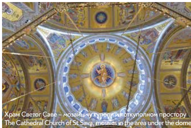
Храм Светог Саве – мозаици у куполи и поткуполном простору The Cathedral Church of St Sava, mosaics in the area under the dome