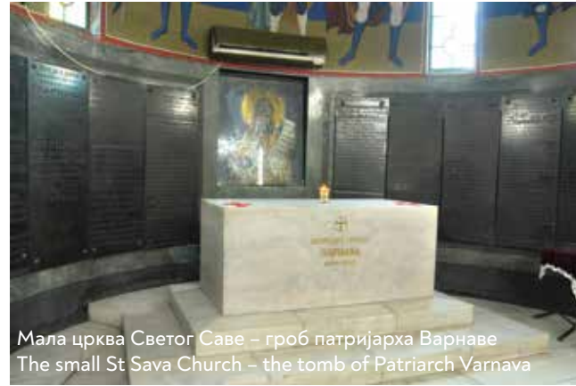
Мала црква Светог Саве – гроб патријарха Варнаве The small St Sava Church – the tomb of Patriarch Varnava