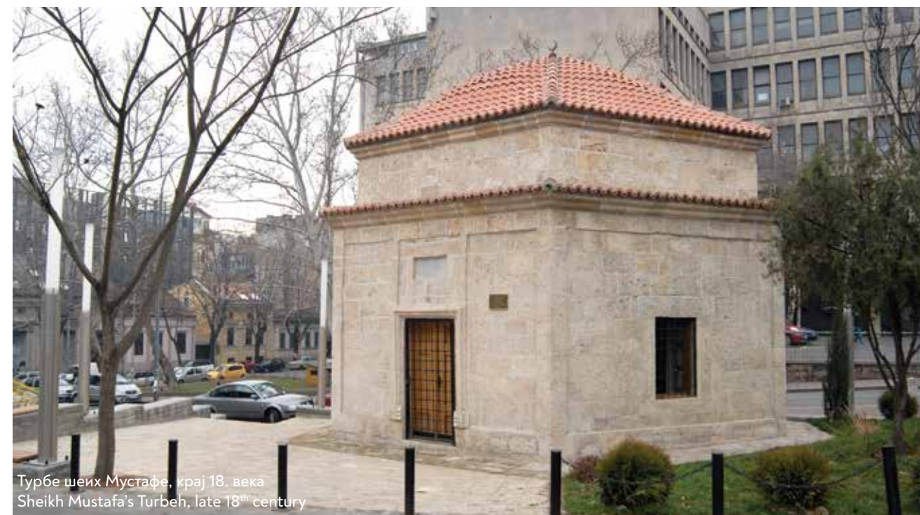
Турбе шеих Мустафе, крај 18. века Sheikh Mustafa's Turbeh, late 18 th century

The area comprising five blocks between Kralja Petra Street, Gospodar Jovanova Street, Kapetan Mišina Street, Simina Street, Kneginje Ljubice Street, Braće Jugovića Street, The Student Square, and Zmaja Od Noćaja Street is located in Belgrade's Old Town, which emerged in the late 18 th and early 19 th century. This ensemble preserves to the present day the original regulation routes and buildings of exceptional urban-planning, architectural, and cultural values. Some of them are associated with the establishment and activities of the most important Serbian institutions from the period of the First Serbian Uprising – The Serbian Governing Council, as the first government of the insurgents, as well as The Great School, as the first higher education institution in Serbia. The names of the illustrious figures of the Serbian history and culture are also