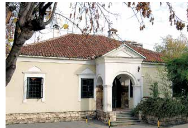
Божићева кућа (Музеј позоришне уметности), крај 18. века Božić's House (the Museum of Theatre Art of Serbia), late 18 th century

In the courtyard building constructed in the second half of the 18 th century, located at what is today 22 Gospodar Jevremova Street, Dositej Obradović opened the Great School as the first higher education institution in Serbia. Its founder and first lecturer was Ivan Jugović, the notary and secretary of the Serbian Government Council, who served as a diplomat