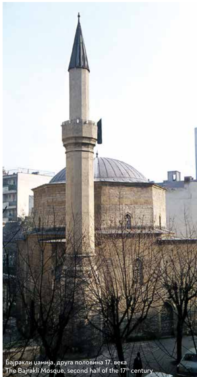
Бајракли џамија, друга половина 17. века The Bajrakli Mosque, second half of the 17 th century

Бајракли џамија у Господар Јевремовој 11 изграђена је највероватније у другој половини 17. века, као задужбина султана Сулејмана Другог (1687–1691). Представља једини сачувани објекат исламске верске архитектуре у Београду. Назив датира од осамдесетих година 18. века, када је на џамији био истицан барјак као знак за почетак молитве у свим варошким џамијама. За време аустријске владавине 1717–1739. године била је