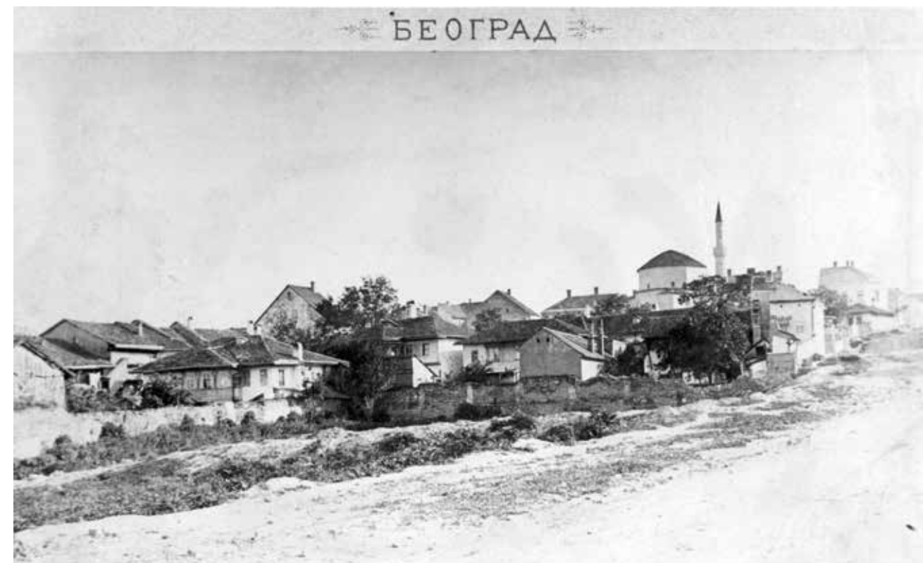
Београд око Бајракли џамије, фото М. Јовановић, 1895.

Belgrade around the Bajrakli Mosque, 1895 (photographer: M. Jovanović)