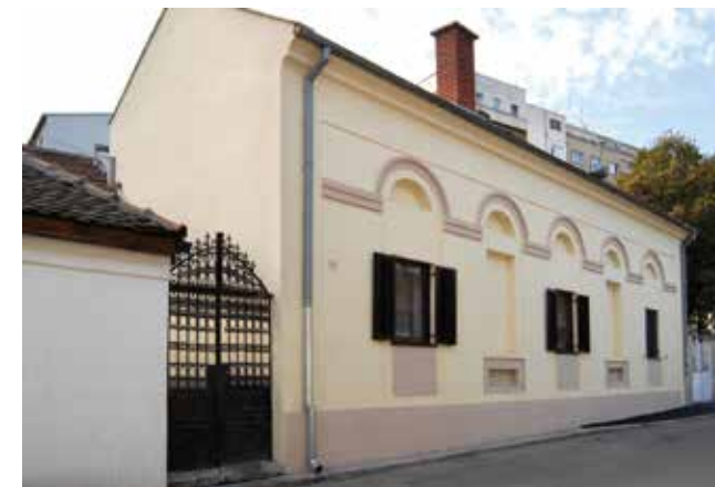
Господар Јевремова 22 House at 22 Gospodar Jevremova St

The Božić's House , located at 19 Gospodar Jevremova Street and dating back to the late 18 th century, is one of the