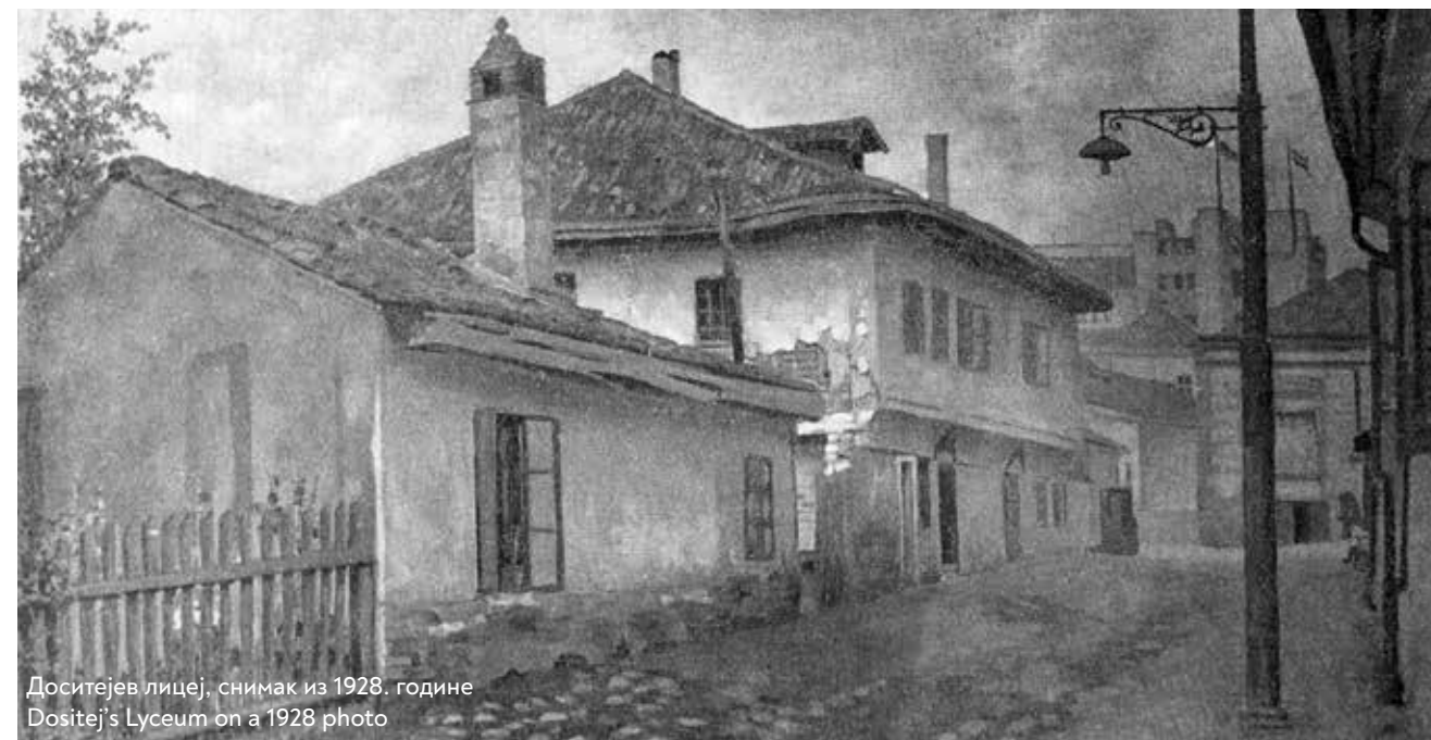
Доситејев лицеј, снимак из 1928. године Dositej's Lyceum on a 1928 photo

претворена у католичку катедралну цркву, а с повратком Турака обновљена је у џамију. Џамија архитектонски припада типу једнопросторне кубичне грађевине с куполом и минаретом. Грађена је од камена, а неки сегменти изведени су у комбинацији опеке и камена. Осмострану куполу носе источњачки поткуполни лукови и нише – тропе, са скромном декорацијом конзола. Отвори на грађевини завршавају се карактеристично оријенталним преломљеним луцима. У унутрашњости су света ниша михраб , проповедаоница ( мимбар ) и галерија над улазом.