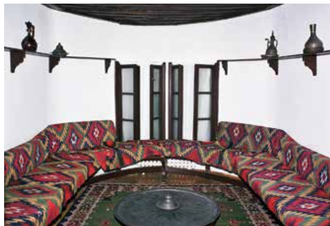
Доситејев лицей, ентеријер - диванхана Dositej's Lyceum, the interior - an Oriental divan room

containing a civilian settlement and a necropolis of the Ancient Singidunum. It developed between the 2 nd and 4 th centuries AD, and has been listed as a cultural heritage site since 1964.