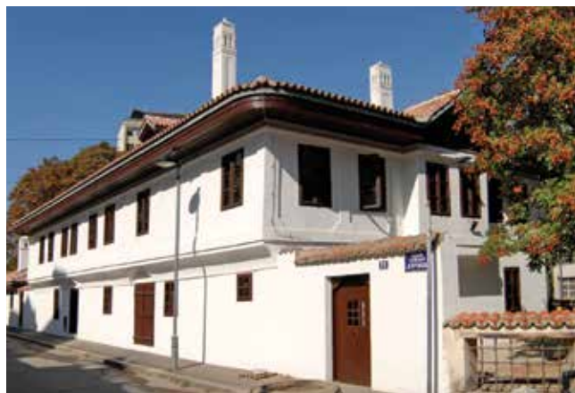
Доситејев лицей (Музеј Вука и Доситеја) Dositej's Lyceum (Vuk and Dositej's Museum)