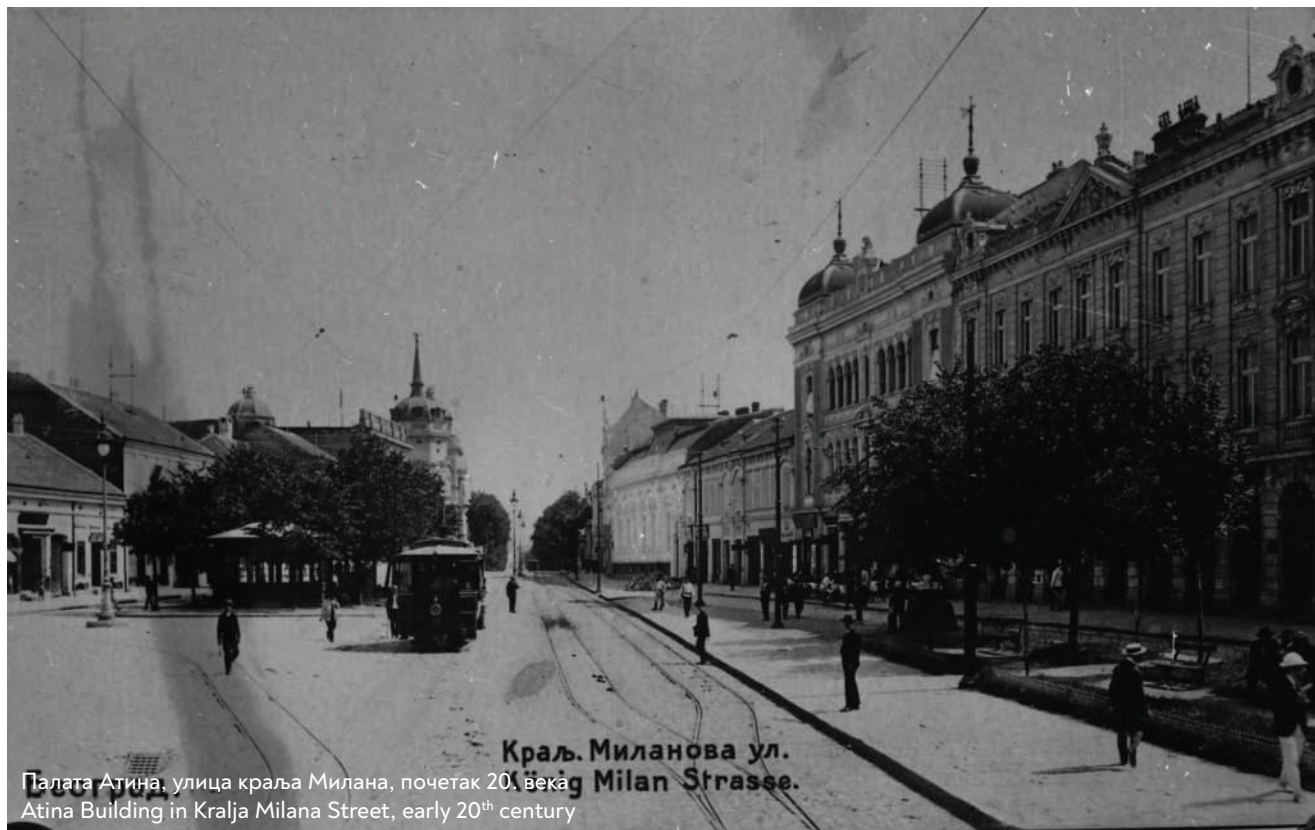
Палата Атина, улица краља Милана, почетак 20. века Atina Building in Kralja Milana Street, early 20 th century

Простор данашњих Теразија у последњој четвртини 19. века носио је назив Улица кнеза Милана, затим и Улица краља Милана, а до краја међуратног периода званично је био Престолонаследников трг. Функционално је обликован као главна станица колских запрега, које су се због ковачких, казанџијских, сукнарских и других занатских радионица заустављале на улазу у некадашњу Београдску варош, на раскрсници старог Крагујевачког (траса Улице краља Милана) и Смедеревског пута (наставак Фишегџијске чаршије, траса Булеvara краља