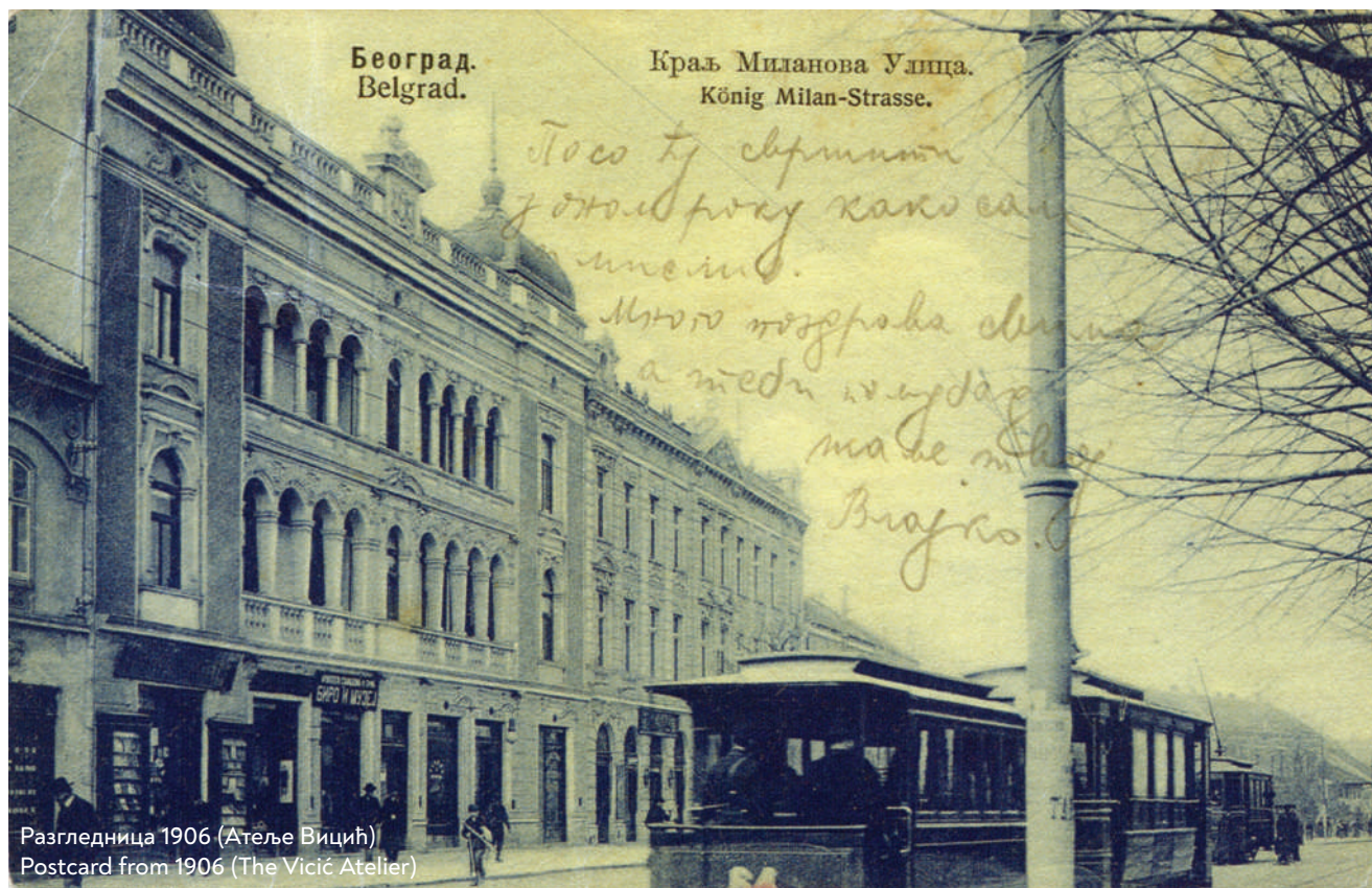
Разгледница 1906 Postcard from 1906

The area that is Terazije today was called Kneza Milana Street in the last quarter of the 19 th century. The name was then changed to Kralja Milana Street and then again to the Royal Heir's Square – the official name it kept until the end of the interwar period. In functional terms, it was designed as the main stop for carts, which would come to the gates to what used to be the City of Belgrade – located on the corner of the old Kragujevac Road (the route leading from Kralja Milana Street) and Smederevo Road (an extension of the