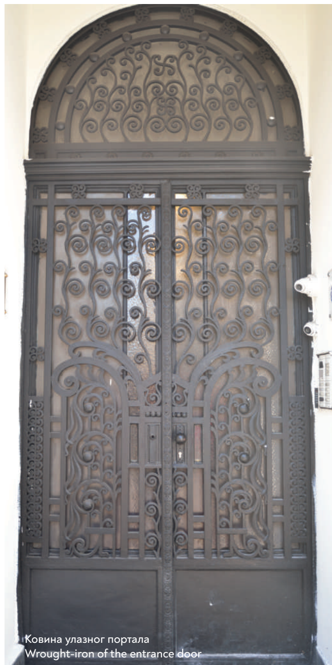
Ковина улазног портала Wrought-iron of the entrance door