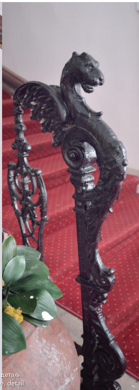
Ковина оградe унутрашњег степеништа, детаљ Wrought-iron railings of the inner staircase, detail