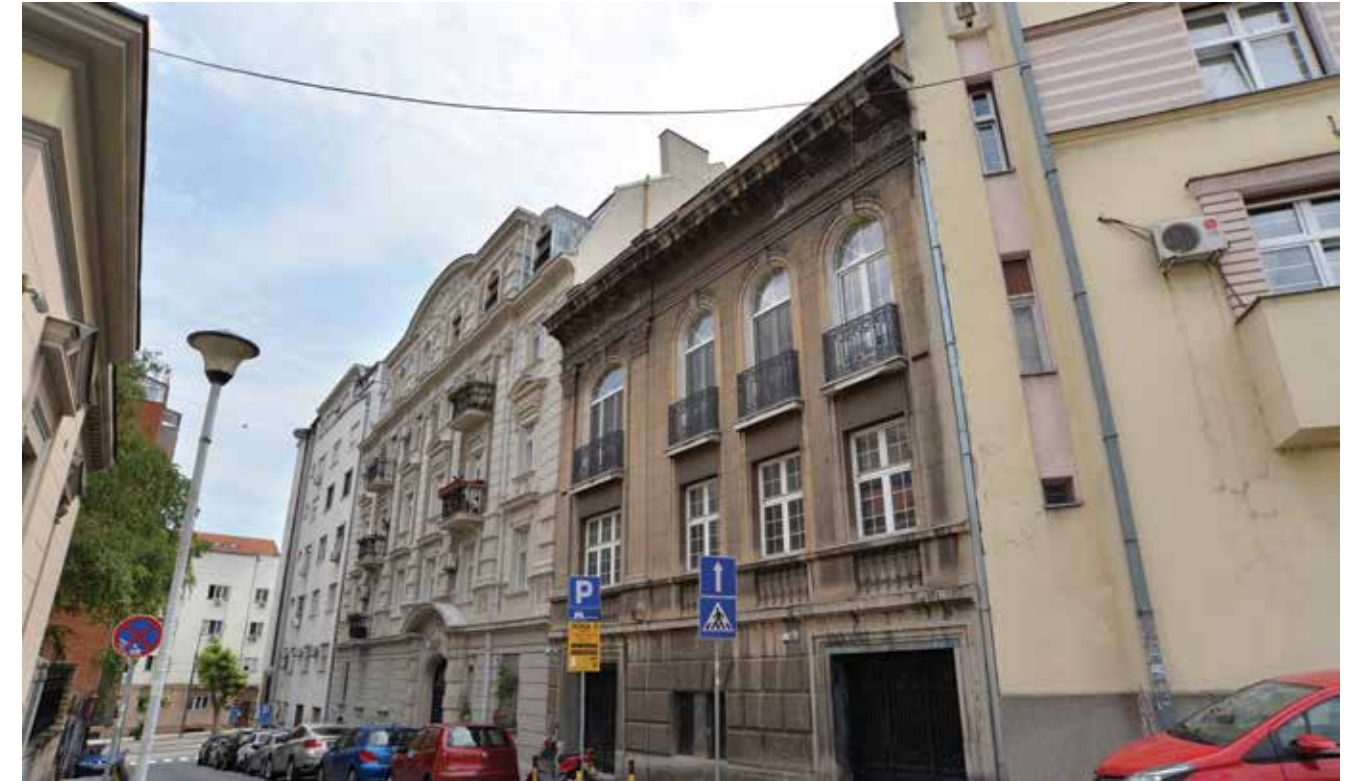
Улица Јелене Четковић Jelen Četković Street