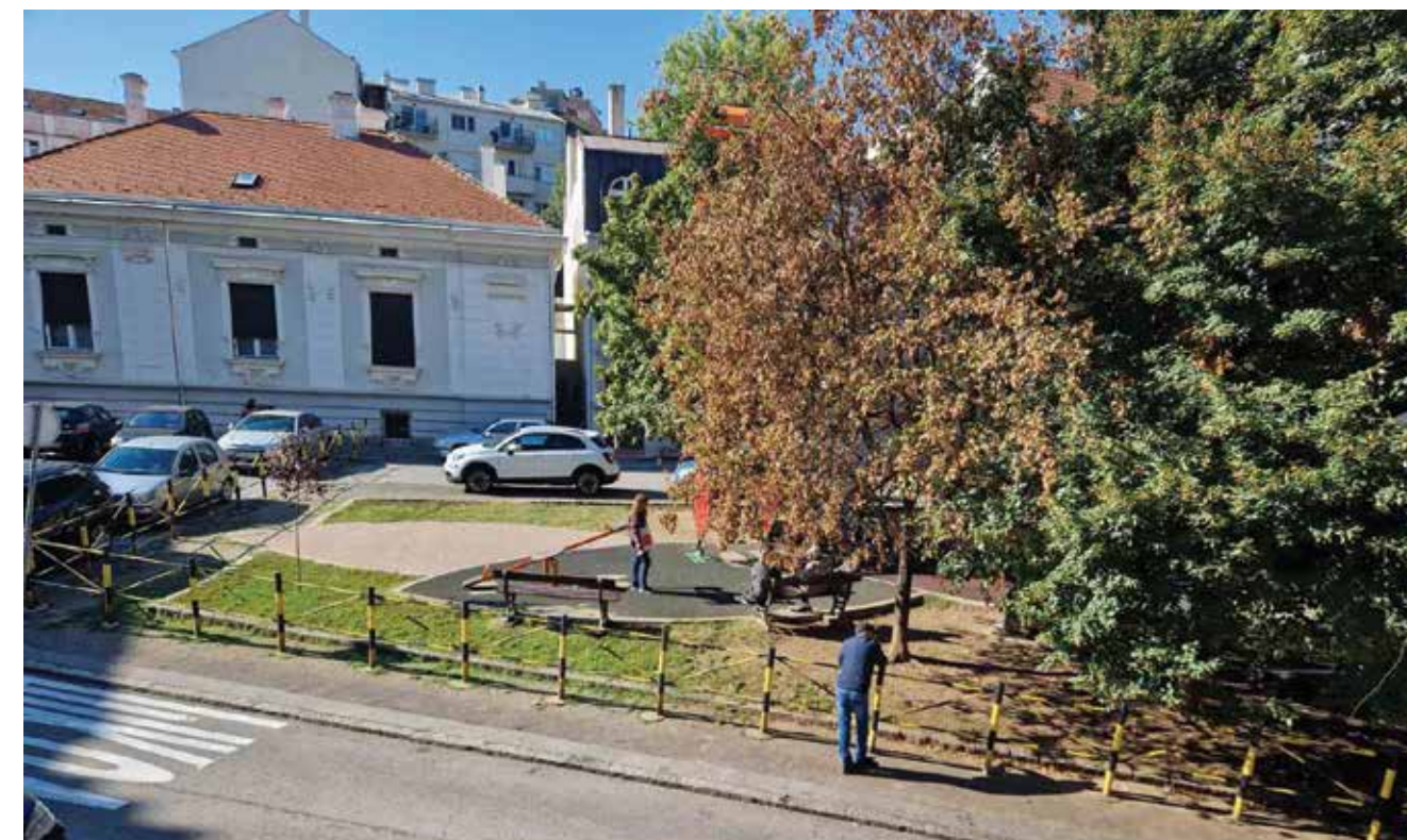
Општи изглед Overall view

Градина – башта, врт, место одмора, зеленила и цветних мириса. Митрополит Михаило Јовановић (1859–1881; 1889–1898), сигурно и не слутећи какве ће се промене десити на његовом приватном имању, са много пажње је неговао свој виноград. Дobar род, знао је он, зависи од тла и сунца. Данас, када шетате Копитаревом градином и док вас гледају фасаде кућа, осећате дух добродошлице старог, отменог Београда, који је никао на месту винове лозе, подно престоничког сунца.