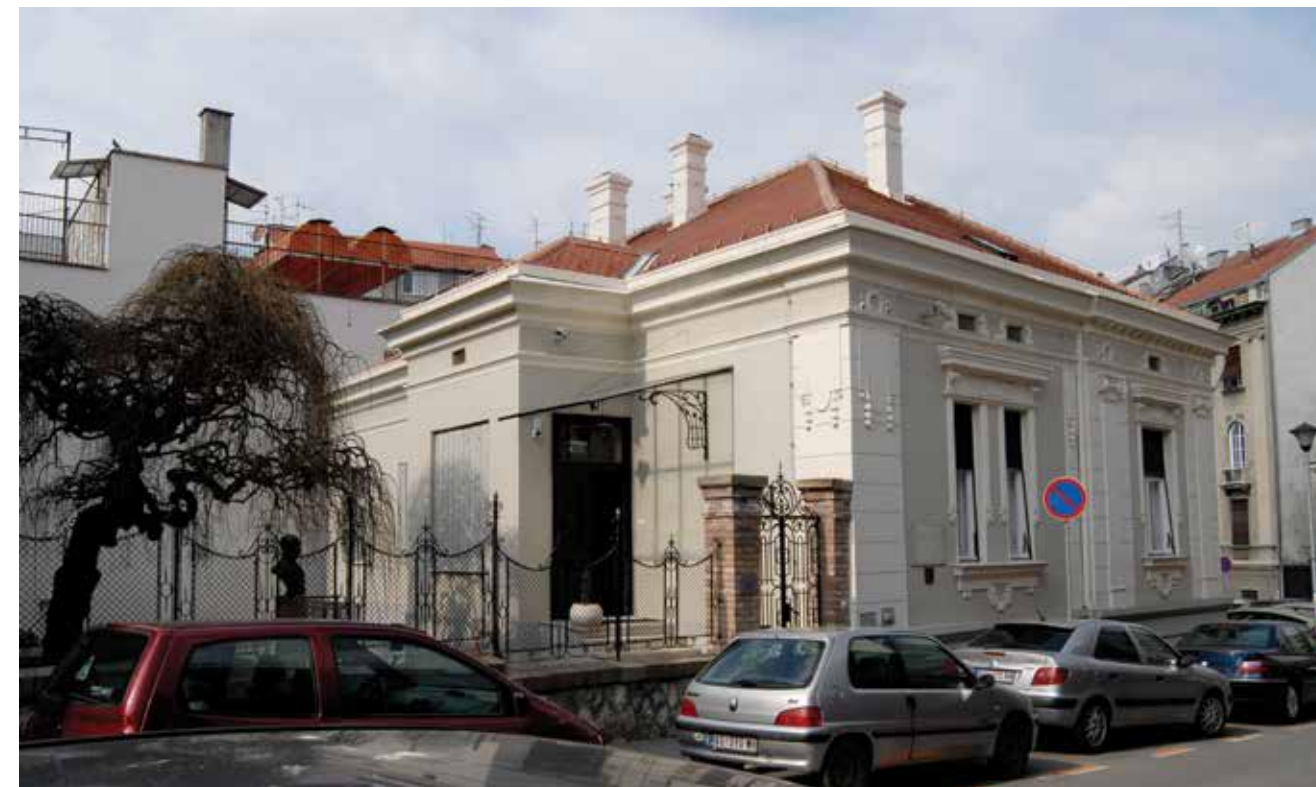
Дом Јована Цвијића Jovan Cvijić's house