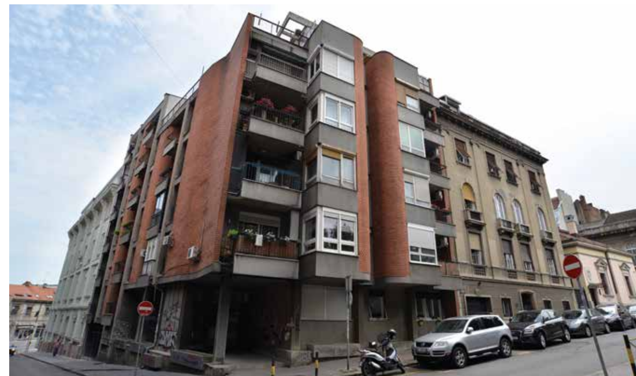
Копитарева градина 1 1, Kopitareva Gradina St

In Serbian, the term “gradina” means garden, a place of rest, greenery and sweet scents of flowers. Metropolitan Mihailo Jovanović (1859/81–1898) could not even imagine the changes his “gradina” would go through when he diligently grew his vineyard there. Good harvest rests upon the soil and the sun. Today, when you walk around the Belgrade neighbourhood of Kopitareva Gradina, admiring its façades, you will unmistakably feel the welcoming spirit of the old, noble Belgrade that arose from where the grapevine once thrived, under the Serbian capital’s sun.