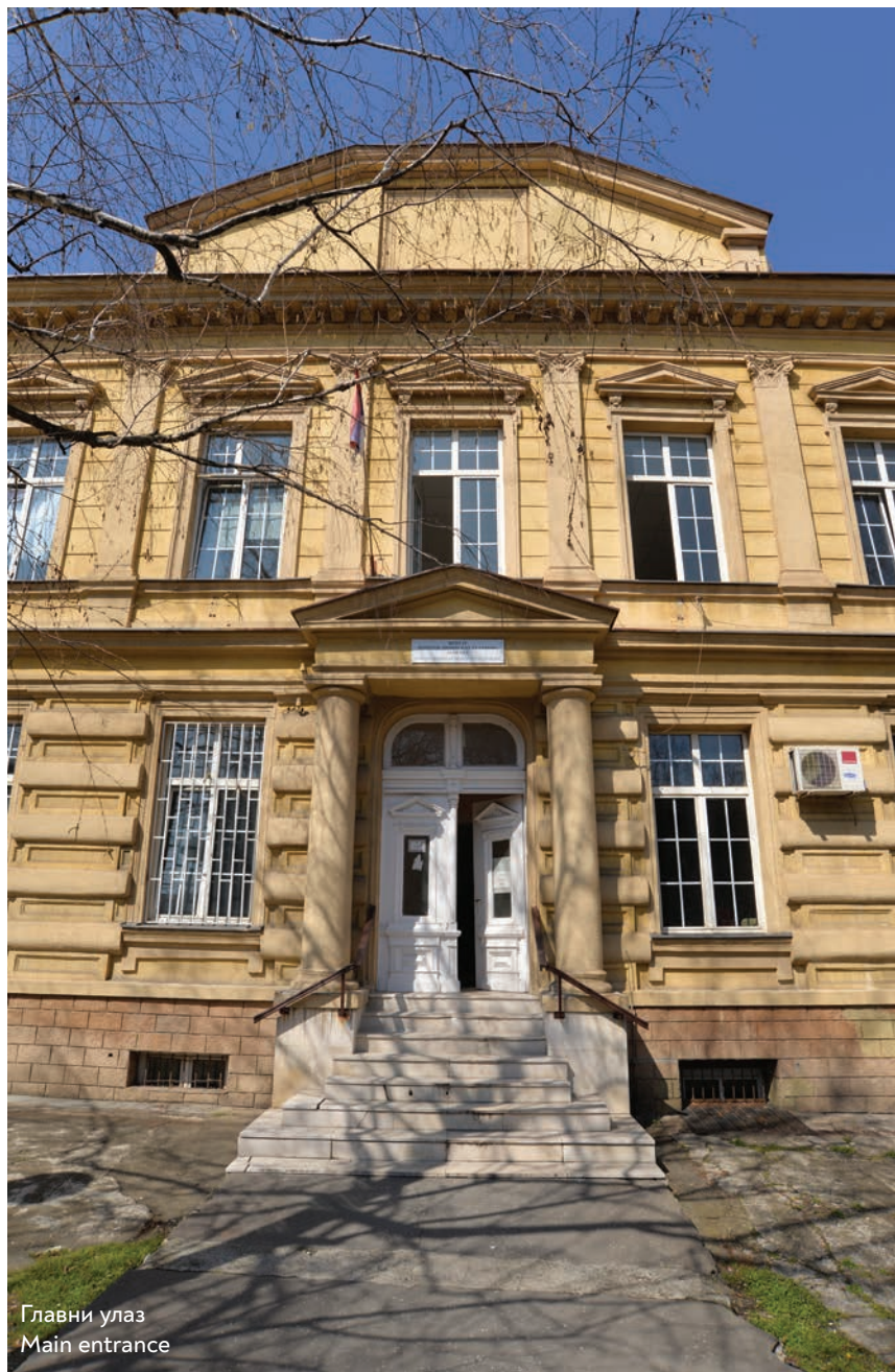
Главни улаз Main entrance