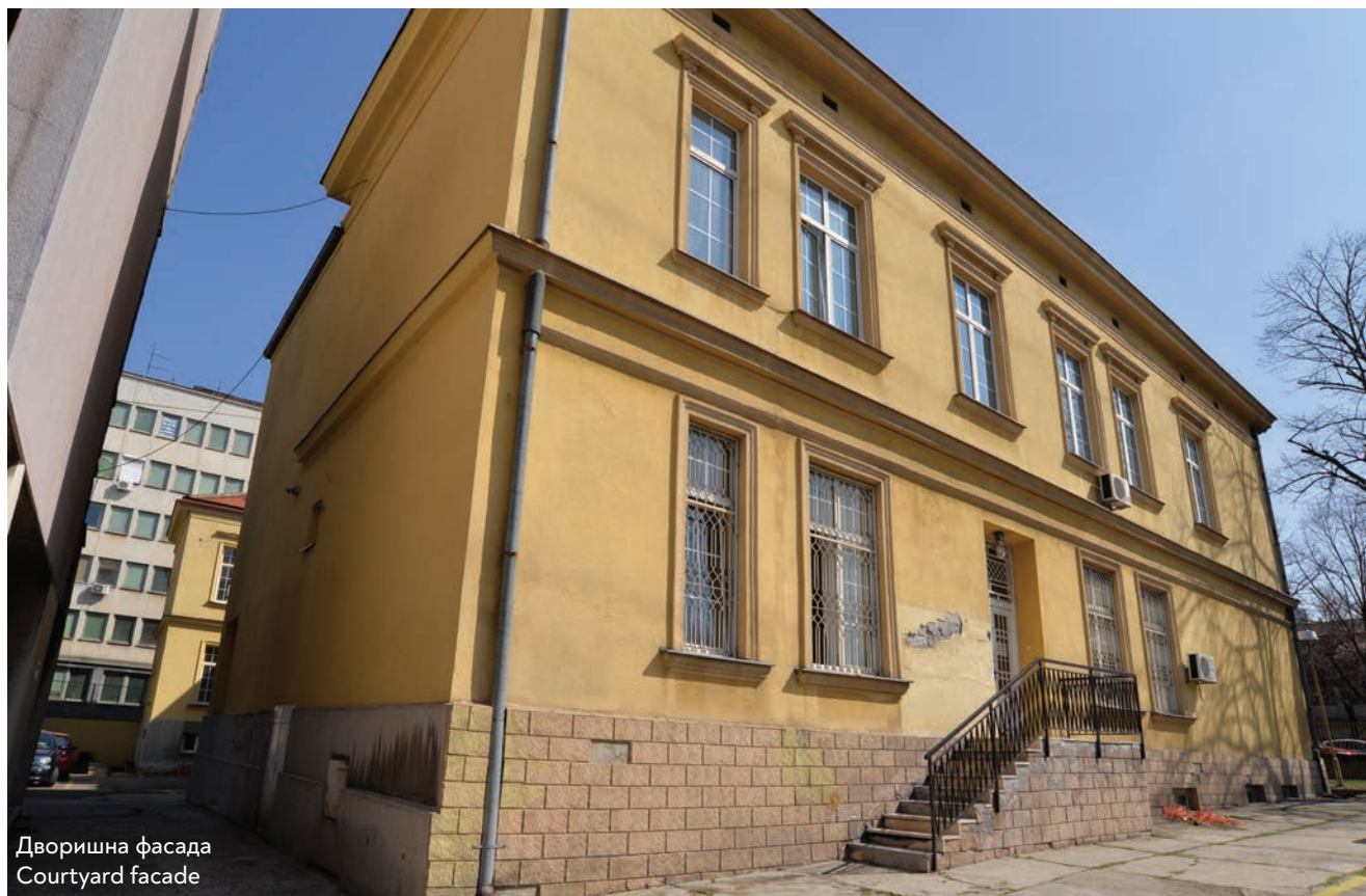
Дворишна фасада Courtyard facade

Organisation of the Healthcare Profession and the Protection of Public Health, passed in 1881, envisaged the construction of the Children's Home, intended for children whose family members were lost to wars and natural disasters.