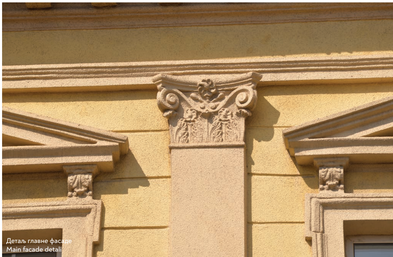
Деталь главне фасаде Main facade detail

The Orphaned Children's Home was designed by Viennese architect Anton Haderer, who worked in Belgrade as a private designer and entrepreneur in the late 19 th century. The cornerstone of the new building was set by King Milan Obrenović in a ceremony on 18 th May 1887. The construction of the building – funded by donations of prominent Belgraders – proceeded in three phases. The building was completed in five months and, alongside the children, welcomed its first inmates, whose numbers were to increase after the war with Bulgaria. As a result, the structure was expanded. The architect in charge of supervising phase two, completed in 1889/1890, was Dimitrije T. Leko, and the final phase was completed in 1892 based on the design by engineer Grgur Milenković. The Home building could house 200 children, who would