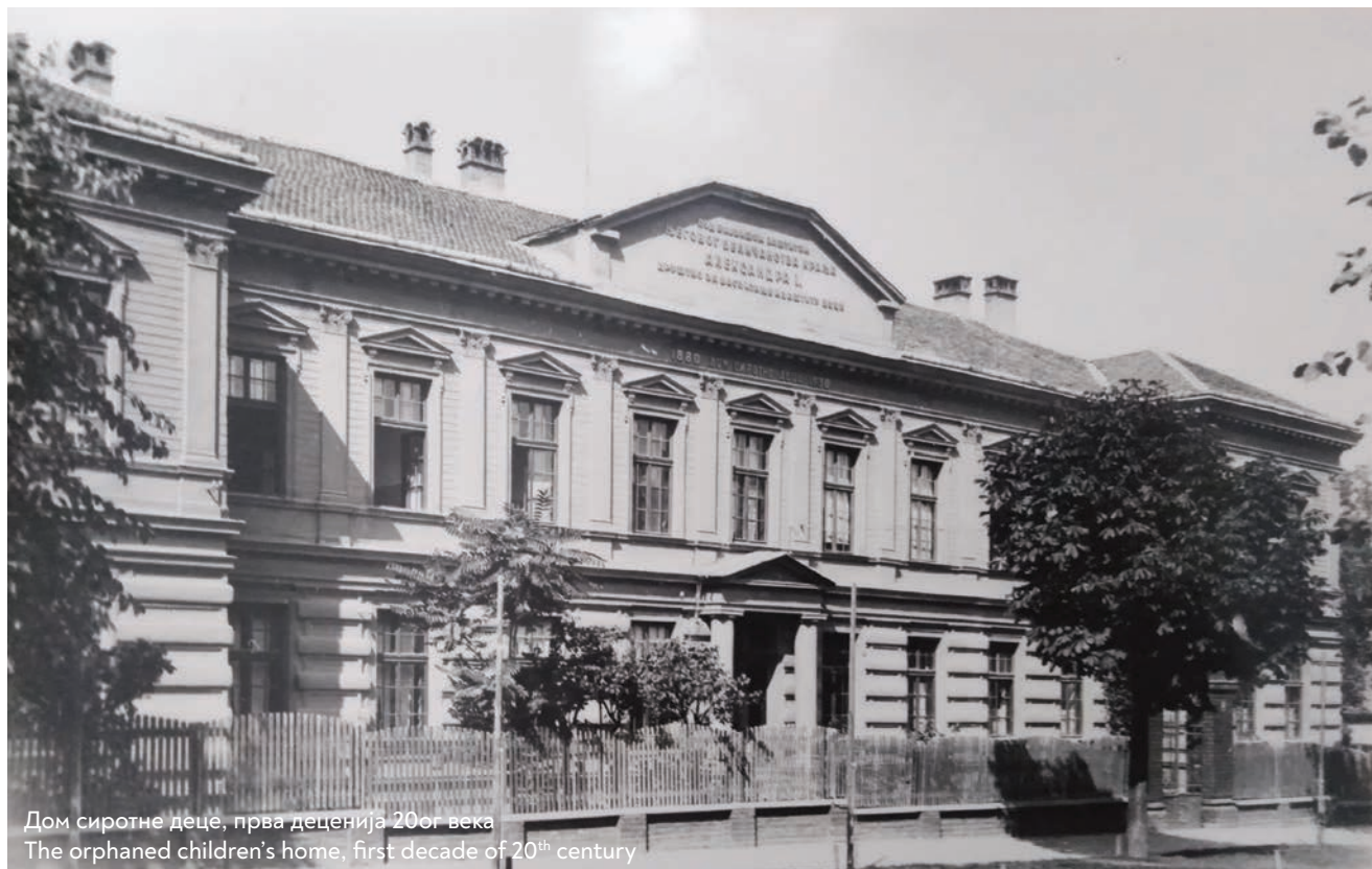
Дом сиротне деце, прва деценија 20ог века The orphaned children's home, first decade of 20 th century

У прекретничком историјском периоду развоја српске државе, који започиње Првим српским устанком и прераста у националну револуцију за ослобођење од вишевековне турске владавине, препорођена друштвена свест о социјалном положају најмлађег дела становништва покренула је организовану заштиту и збрињавање деце. По ослобођењу престонице 1807. године, Правитељствујушчи совјет као прва устаничка влада (основан 1805. године), обезбеђује храну, одећу и смештај турској деци која су остала без родитеља, као и њихово