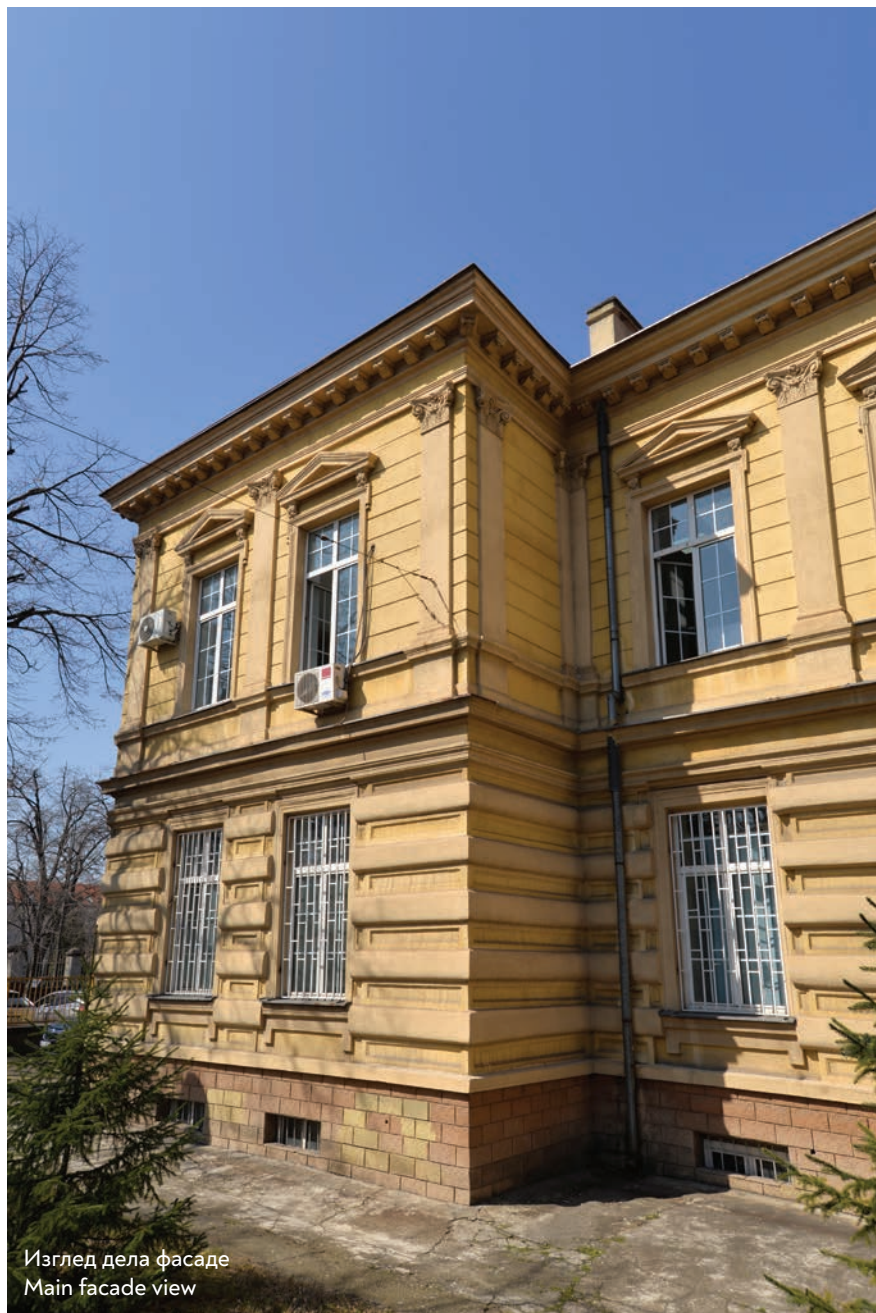
Изглед дела фасаде Main facade view