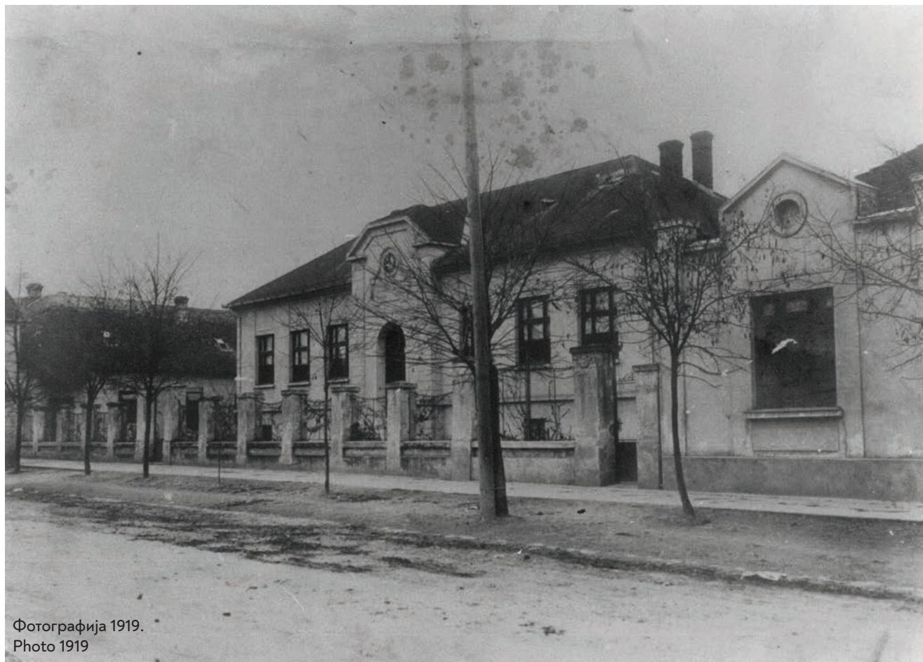
Фотографија 1919. Photo 1919