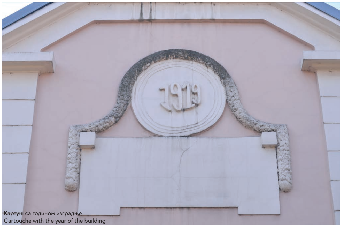
Картуш са годином изградње Cartouche with the year of the building

and garden, located in Cara Dušana Street, at what used to be number 43, available to the Society. The building was used to house orphaned children from Zemun and the surrounding area, and subsequently from the entire Srem.