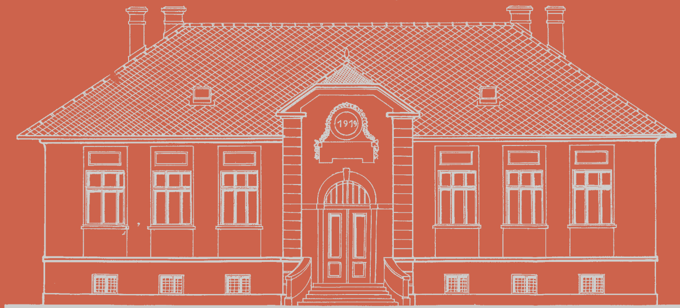
Изглед главне фасаде Main façade design