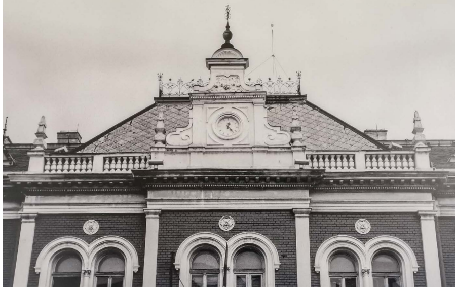
Сл. 2. Земунска њошћа, Главна бр. 8 у Земуну

сунчаним сатом у Главној улици 23 у Земуну, а приказан је и сунчани сат у Астрономској опсерваторији, у Волгиној улици 7 на Звездари.