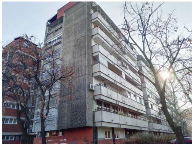
Сл. 4 / Стамбена зграда у Блоку 29, 2020.