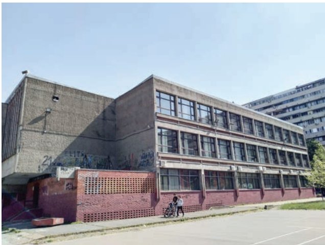
Сл. 2 / Основна школа 'Јован Дучић' у Блоку 21, 2020.

стављање с видљивим фугама), бојом и присношћу се приближава сагледивости људског ока, па је то био главни разлог зашто је изабран. 31 Пошто чоне површине, попут приземља, тераса и парапета, стварају основну архитектонску арабеску зграде аутори одлучују да на њих буде аплицирана керамика, док су све остале површине (плафони балкона и приземља, повучен спрат у поткровљу) обојене дисперолом. Својом складном уметничком обрадом, објект Б-9 је изазвао позитивну рецепцију код стручне јавности – био је предлажан за Октобарску награду града Београда и проглашаван за један од најлепших објеката у земљи.