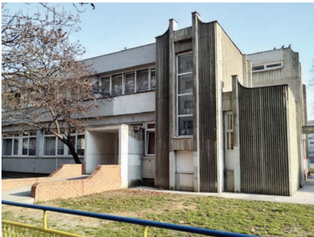
Сл. 5 / Дечје јасле у Блоку 29, 2020.

опремања унутрашњих просторија аплицирани су квалитетни материјали попут храстовог паркета, венецијанског мозаика, винаж и кулије плоча и др., домаће производње. 40 Спољашња обрада је решена контрастирањем ребрастих бетонских елемената, опеке и бојених равни, као и балкона с фасадном керамиком која је раније поновљена на објектима Б-9 и А-7 у Блоку 21. Исти материјали су аплицирани на дечјим јаслама 41 (сл. 5) и центру месне заједнице. 42 (сл. 6)