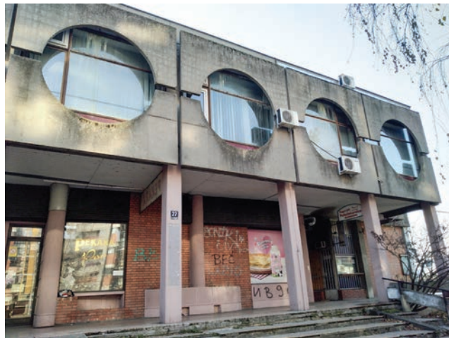
Сл. 6 / Центар месне заједнице у Блоку 29, 2020.

Због примене натур-бетона, али и истицања јасне структуре објеката, како на фасадном платну тако и у основи, при чему се јасно разликују правци хоризонталних комуникација, могу се довести у везу са идејама брутализма. 43 Примена натур-бетона и опеке била је својеврстан тренд који је био заступљен крајем шездесетих и почетком седамдесетих година 20. века у Србији, који се јавио као последица тежње ка стварању нечег новог у условима интензивне префабрикације и усмерене стамбене изградње. 44 Такође, у историографији се ови објекти често класификују као изразити примери скулптуралне позне модерне, правца који је у архитектури дефинисао Михаило Чанак. 45 У целини гледано, архитекте Митић и Чанак су оваквим обликовним концептом, као и