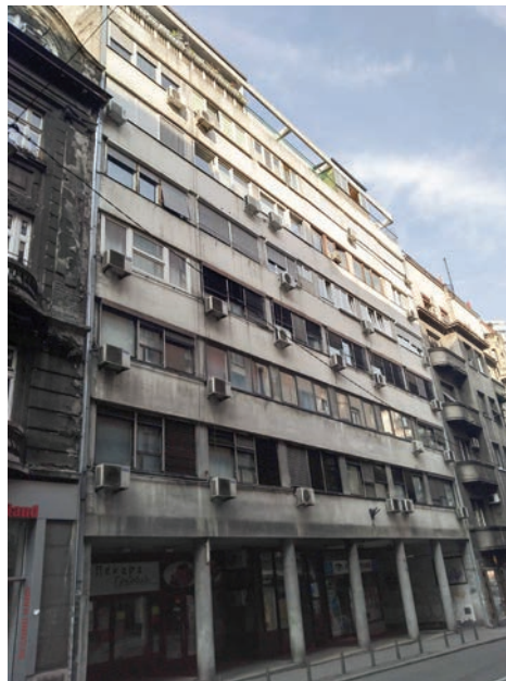
Сл. 1 / Стамбено-управна зграда у Нушићевој број 21, 2020.

Његово прво архитектонско остварење, док је био запослен у бироу „Атриум“, представља стамбено-управна зграда с приземљем и шест спратова у Нушићевој улици број 21 (сл. 1), чију градњу је финансирала Балканска кројачка задруга у периоду од 1958. до 1960. године. 11 Пројекат је првобитно одобрила 21. децембра 1957. Управа за извршење регулационог плана града Београда због успостављања органске везе с висинском регулацијом суседног објекта и повлачења од регулационе линије улице за 3,80 метара, чиме је испоштован захтев Урбанистичког завода. На првом и другом спрату су функционално распоређене просторије за потребе инвеститора – радионица, канцеларија шефа погона, гардеробе, салон, просторије женске дораде, моделарско одељење, рачуноводствени сектор и др., док су остали спратови намењени становању. Зграда је изграђена од армираног бетона, опеке, кречног малтера, набијеног бетона, с преградним зидовима од dursol плоча и делимично армиранобетонског скелета. 12 Фасаду карактерише једноставност концепта у виду хоризонталних трака од вештачког камена, чија је обрада и боја зависила од избора архитекте Митића. У приземљу се налази колонијада стубова с локалима, а на врху истакнута пергола, што је често било примењивано у архитектури стамбено-пословних објеката тог