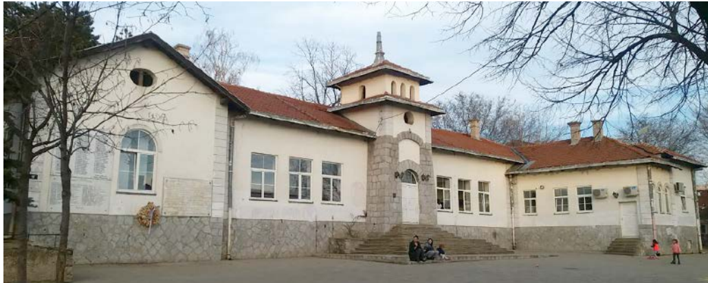
Сл. 6 / Основна школа „Љуба Ненадовић“ у Жаркову

развио је индустрију креча. Његово предузеће подигло је, после рата, велики монополски магацин у Новом Саду. Радио је и на изградњи пута Београд – Милатовачка река, у дужини од 60 километара. Приватне послове запоставља 1925. године, и окреће се политици. 20