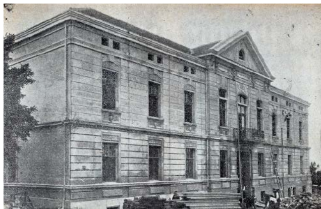
Сл. 5 / Зграда Државног рачуноводства, Адмирала Гејрајна 14

Школска зграда у облику ћириличног слова Г имала је четири светле и хигијенске учионице, као и споредне просторије и стан за учитеља. Садржи