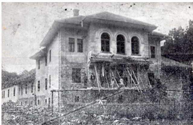
Сл. 4 / Конак у манастиру Раковица