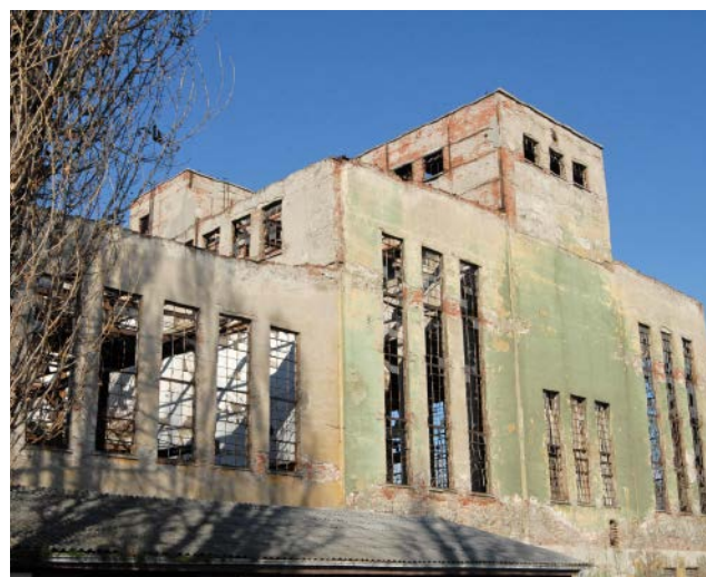
Сл. 2 / Споменик културе Термоелектрана 'Снага и светлост' (ЗЗСКГБ)

Поједине делатности већ су, као што је поминуто, у претходном периоду методолошки биле добро дефинисане и у последње две деценије су само усклађиване с разним новијим међународним и националним теоријским ставовима о културном наслеђу, новим технологијама и материјалима. Напредак је посебно уочљив у дигитализацији читавог низа послова, што је активности Завода учинило транспарентним и доступним другим стручњацима и јавности. Сајт Завода, који се врло уредно ажурира, прегледан је и садржи већину информација помоћу којих се може и критички процењивати напредовање градске службе заштите из године у годину. 2