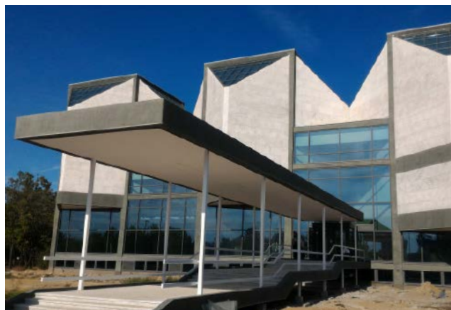
Сл. 7а, 7б / Реконструкција Музеја савремене уметности