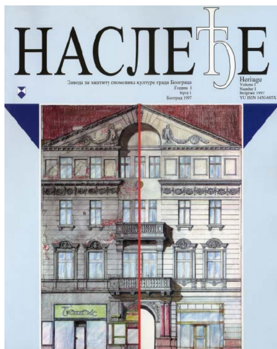
Сл. 1 / Насловна слика првог броја 'Наслеђа'

је заштита веома широк појам, то пружа велике могућности запосленима у Заводу да иницирају читав низ активности које далеко надмашују пуку бригу о физичком одржавању културног наслеђа, па су их они веома успешно разгранали последњих двадесет година.