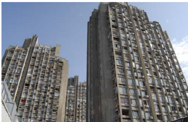
Сл. 5 / Целине и делови традиционалних објеката с историјским или архитектонским вредностима – Нови Београд, Блок 23 (ЗЗСКГБ)

центре специфичних облика друштвеног живота града (резиденцијалне целине градске елите, интелектуалаца, радника; места јавног окупљања и сл.). Међу тим просторним културно-историјским целинама биће свакако и оних које ће представљати културна добра великог значаја када се буду потпуно истражиле и када се буде утврдила њихова укупна вредност. Најважније су: подручје уз Булевар краља Александра (које се протеже кроз општине Стари Град, Врачар, Палилулу и Звездару), подручје уз Улицу кнеза Милоша, затим Стара Палилула, Теразије, Источни и Западни Врачар, Котеж Неимар, Крунска улица, Смиљанићева улица, Крунски венац, Комплекс Државне болнице, Савамала, Сењак, Топчидерско брдо и Дедиње, Професорска колонија, Модернистичка целина Земуна, Централна зона Новог Београда, као и блокови 1 и 2, те приобална зона Новог Београда, Обреновачка чаршија и заштићена околина манастира Фенек као културног добра великог значаја. 9 Поред централних подручја на којима се Београд историјски развијао од давнине, са осведоченим вредностима, истраживачи Завода су добро проценили специфичне карактеристике просторне и урбанистичке поставке грађевина Новог Београда и модернистичке целине Земуна. У образложењима за ове целине издвојене су и утврђене оне