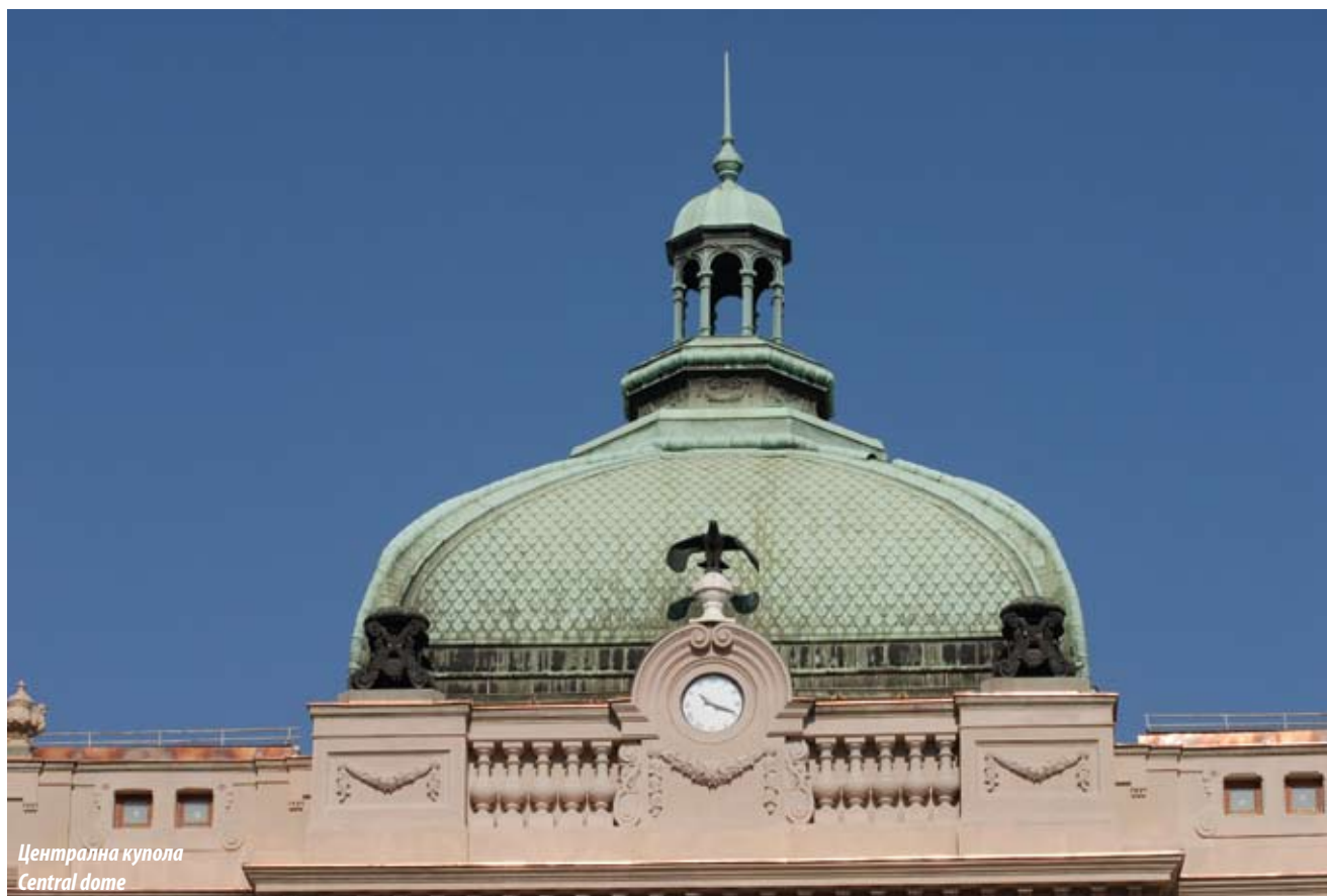
Централна купола Central dome

Више од сто година пре него што је усељен у раскошну зграду на данашњем Тргу Републике, указом министра просвете Јована Стерије Поповића, 10. маја 1844. године, основан је Народни музеј. Под називом Музеум сербски, од самог почетка имао је једнако значајну научноистраживачку и заштитно-конзерваторску улогу.