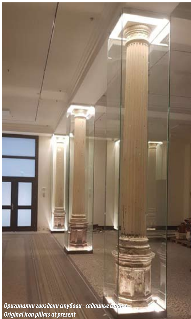
Оригинални гвоздени стубови - садашње стање Original iron pillars at present

The values of the National Museum building nowadays stem from its long-standing function, the architectural characteristics, the urban position and the place of the building in the overall opus of its authors Nikola Nestorovic and Andra Stevanović, both among the greatest architects of their time. Due to its exceptional values, the building has been declared a cultural monument of great importance.