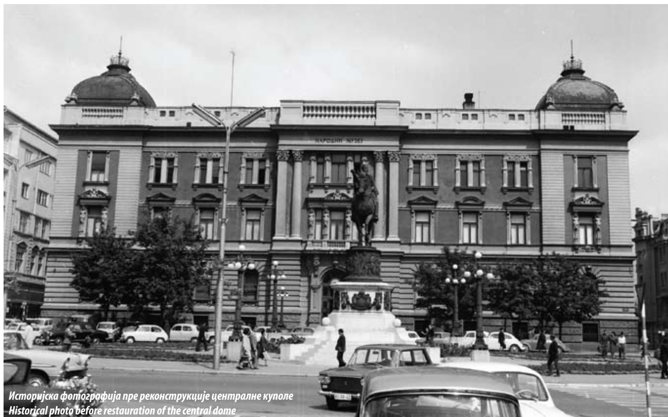
Историјска фотографија пре реконструкције централне куполе Historical photo before restoration of the central dome

More than a hundred years before being moved to the impressive building on today's Republic Square, the National Museum was established on 10 May 1844 in Belgrade by a decree of the Minister of Education, Jovan Sterija Popović. Initially known by the name Serbian Museum, ever since its establishment it has held an important role in scientific research as well as the preservation and conservation activities.