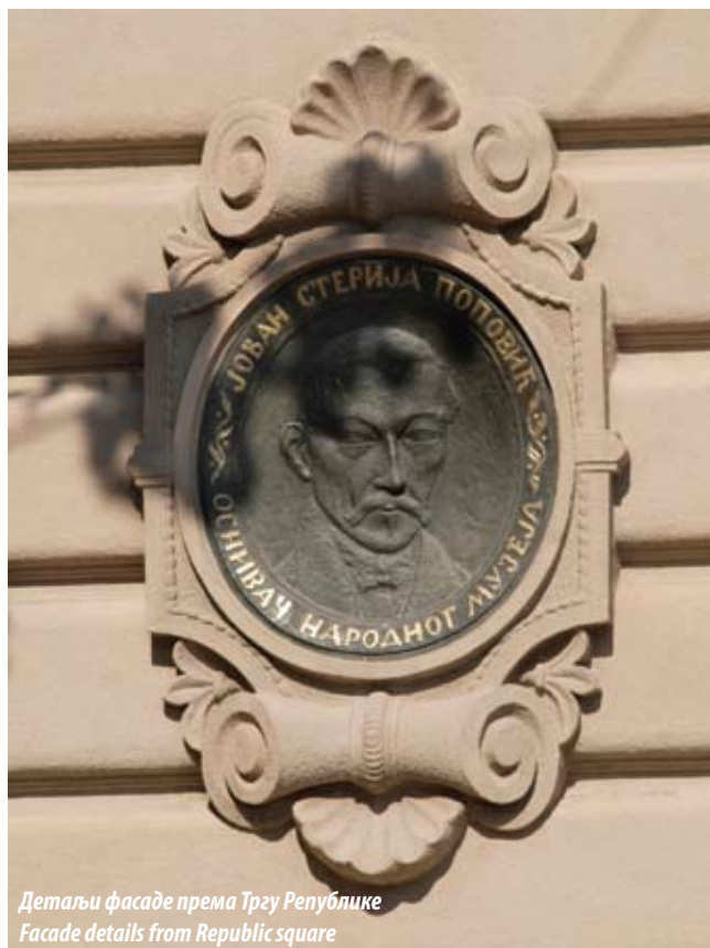
Детаљи фасаде према Тргу Републике Facade details from Republic square