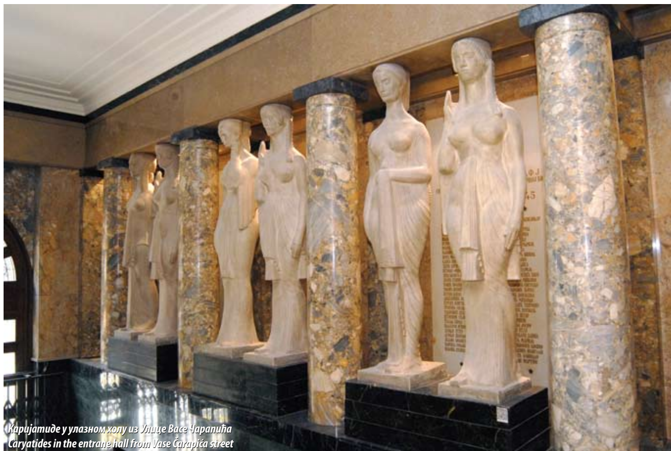
Карјатиде у улазном холу из Улице Васа Чарапића Caryatides in the entrance hall from Vasa Čarapića street