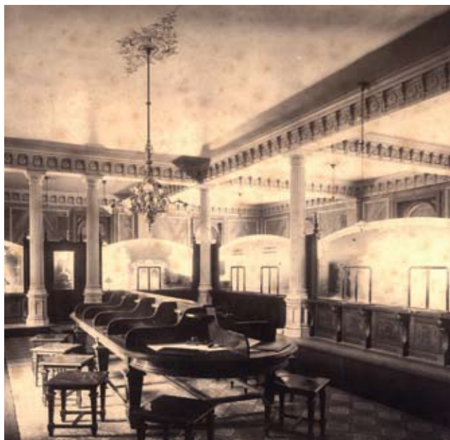
Шалтер сала зграде Управе фондова Counter hall of the Fund Management building