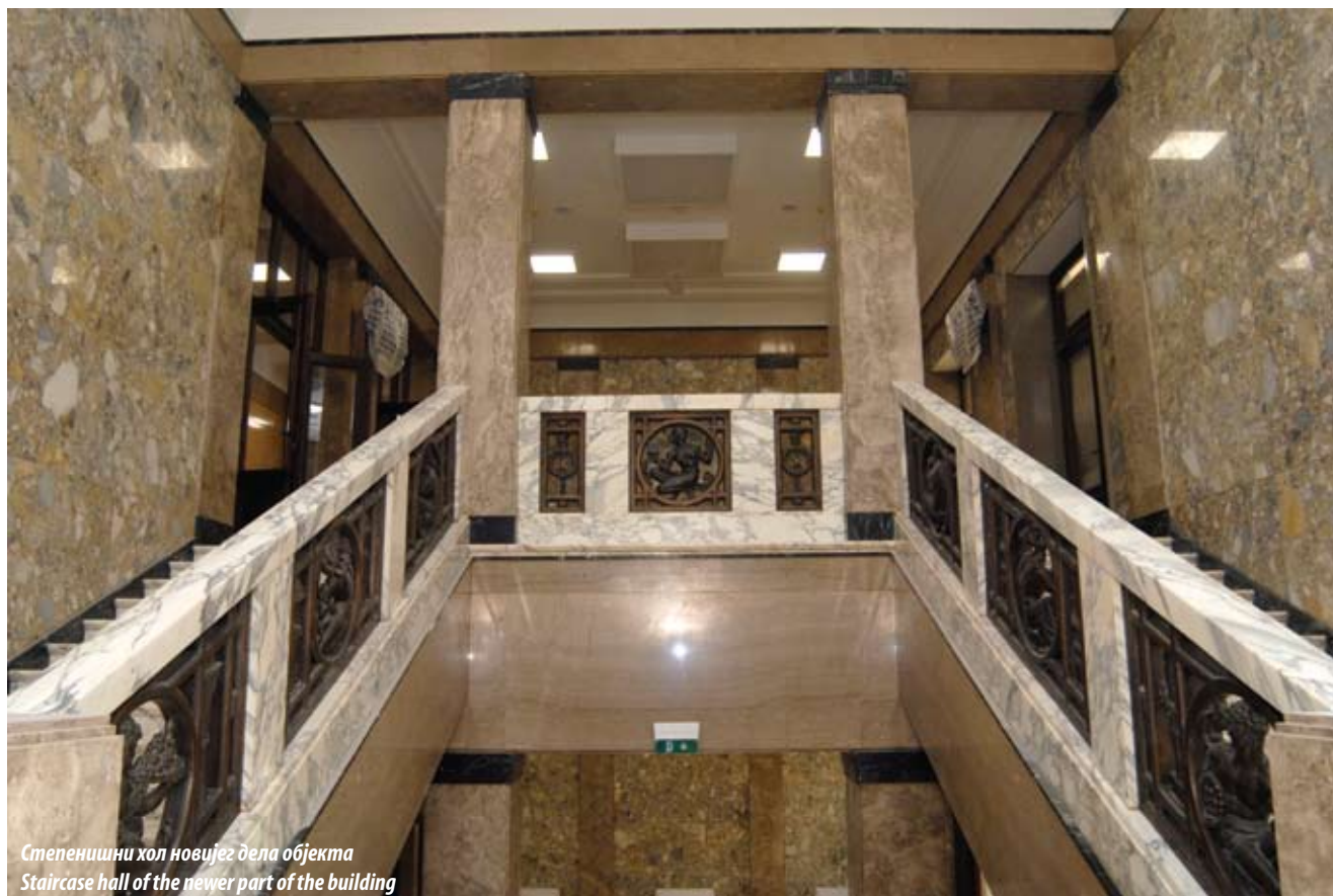
Степенишни хол новијег дела објекта Staircase hall of the newer part of the building

1933. године урадио је доградњу држећи се у свему првобитног изгледа старијег дела. Волумен здања тако је постао масивнији са квадратном основом. У ентеријеру се, из улице Васе Чарапића, појавило још једно свечано степениште и са десне стране још једна шалтер сала, сада са стакленим кровом. У ликовном погледу екстеријера, објекат је формиран као интегрална целина.