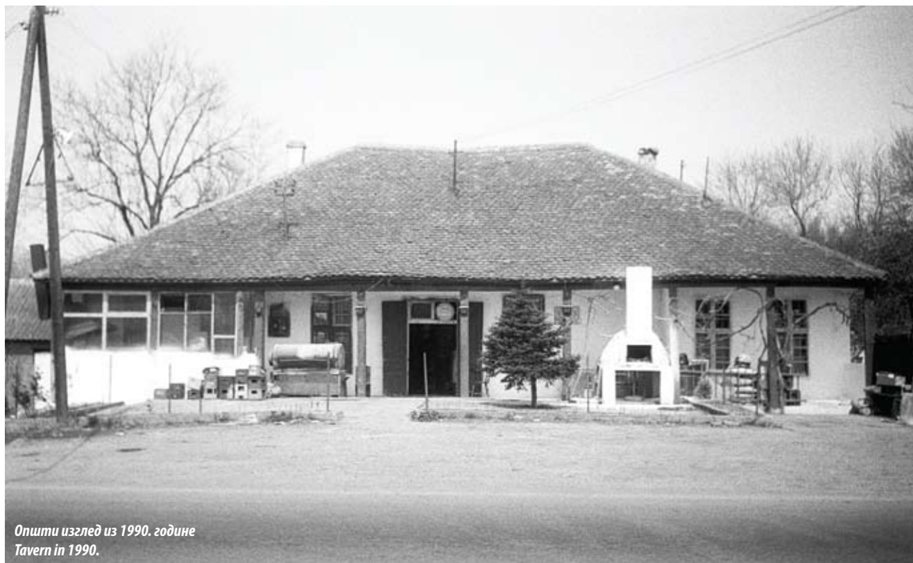
Општи изглед из 1990. године Tavern in 1990.

се извуче из Београда, као калфа у пратњи Гушанца, кад је овај одлазио на састанак са Карађорђем. Прикључио се бећарима и у њиховим редовима остао све до краја Првог устанка. Учествовао је у многим биткама, на Карановцу, Смедереву, Ужицу, Малајници, Дрини, Параћину (1805). Од свих битака у којима је учествовао најзначајније је ослобођење Београда. Био је у групи од пет најхрабријих бораца који су са Кондом Бимбашом отворили Сава капију (1806). Приликом ослобађања београдске вароши постао је да поштеди живот свом газди, терзији Мехмеду.