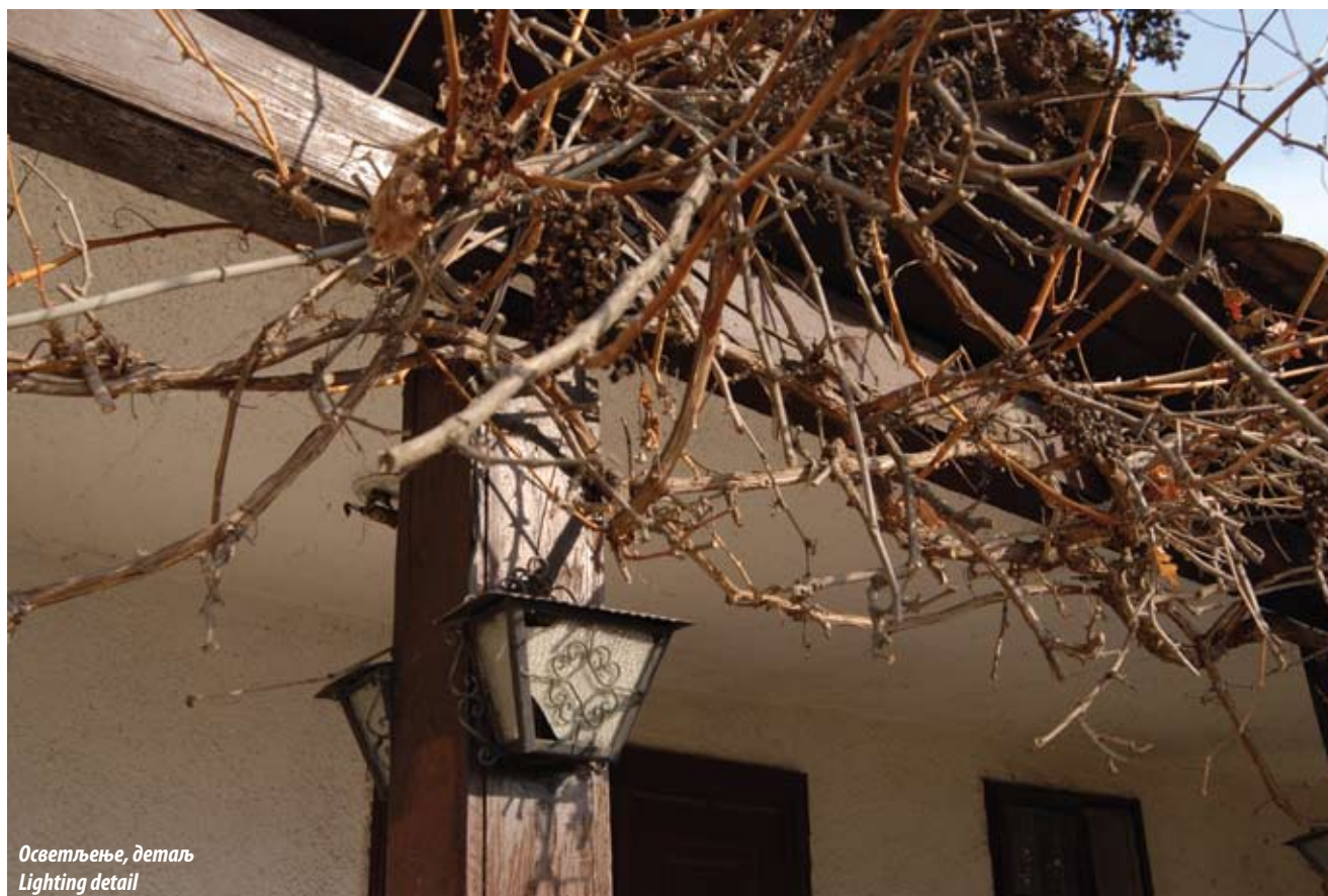
Осветљење, детаљ Lighting detail

Село Мислођин у општини Обреновац припада групи полузбијених насеља са архитектонским фондом који садржи највећи број објеката насталих између два светска рата и у периоду од свршетка Другог светског рата до данас. Очувани објекти из XIX века припадају шумадијском типу и тзв. посавској варијанти овог типа. Оба типа сеоских кућа карактеристична су за насеља обреновачке општине.