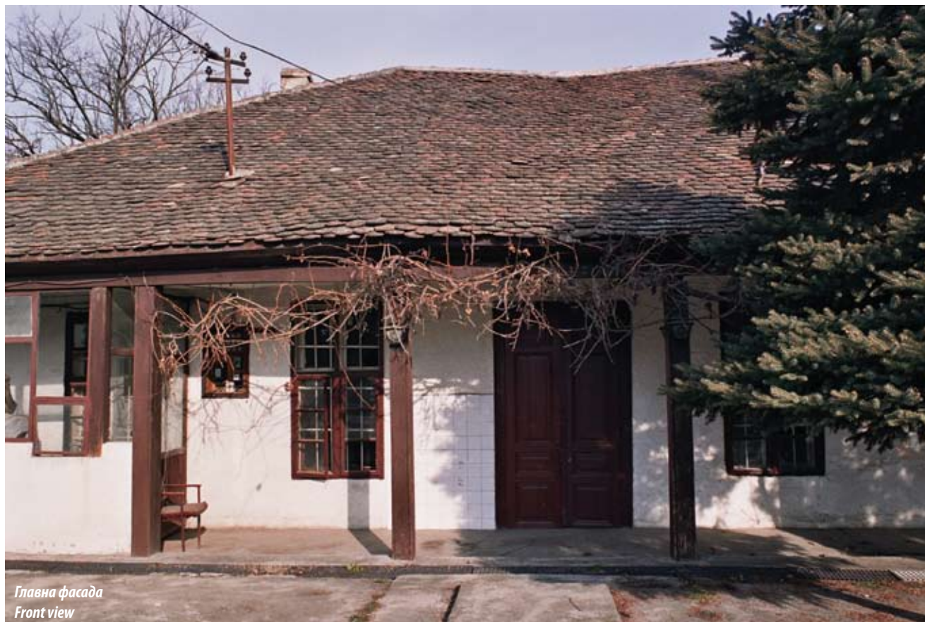
Главна фасада Front view

The village of Mislođin in the municipality of Obrenovac belongs to a group of semi-clustered settlements with an architectural fund with the largest number of houses built between two world wars and in the period from the end of World War II to date. The preserved objects from the 19 th century belong to the type of buildings characteristic for Šumadija, and its variation typical for the areas around river Sava. Both types of country houses are characteristic for the settlements of the Municipality of Obrenovac.