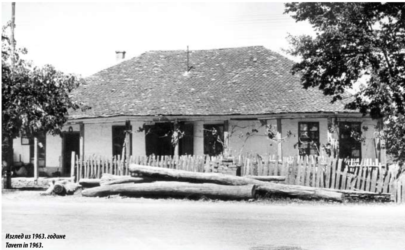
Изглед из 1963. године Tavern in 1963.

економски просперитет у другој половини XIX века. Познавајући прилике у Србији XIX века, можемо слободно рећи да је уношење нових политичких и социјалних идеја и њихово продирање у село ишло преко механа које су, у ондашњим условима спорих и тешких комуникација, биле место на коме су људи најпре могли да успоставе међусобне контакте. Сеоска механа током XIX века представља јавну трибину која је, несумњиво, најсигурнији катализатор сваке нове идеје или става који треба једна средина да прихвати или одбаци. У том смислу механа у Мислођину представља материјално сведочанство једног од најзначајнијег периода политичког и социјалног преображаја на који је нарочито морао да утиче Београд као престоница и политички и културни центар тог времена, у чијој се непосредној близини овај објекат и налази.