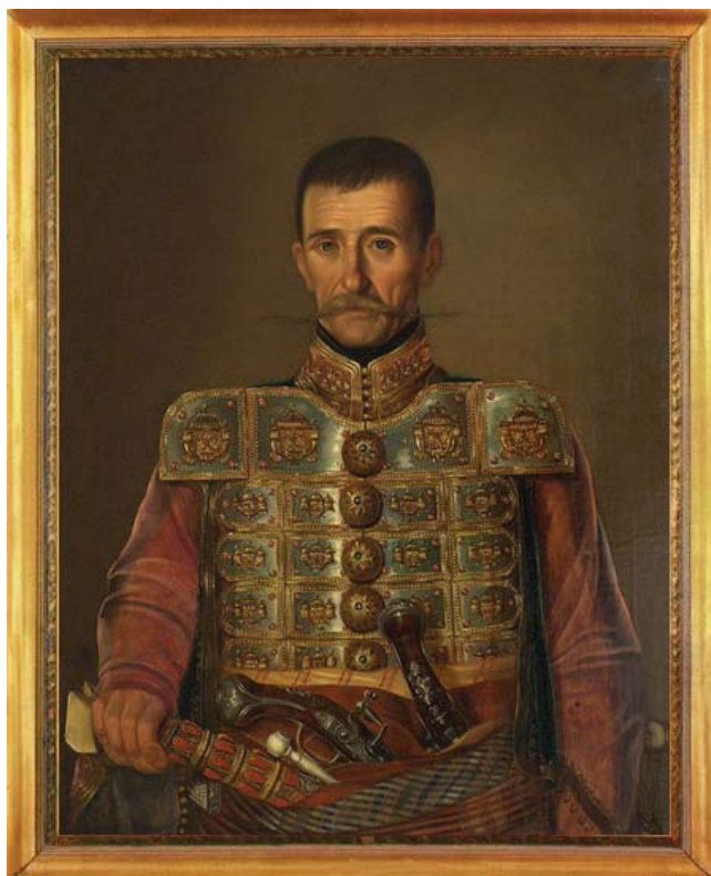
Узун Мирко Апостоловић, портрет Уроша Кнежевића, уље на платну (Народни музеј, Београд)

The tavern of Uzun Mirko Apostolović is related to the name of one of the most famous heroes in the recent history of Belgrade and to some extent represents his memorial. Considering the historical, architectural and ethnographic values, it is of particular importance to the social community and it was proclaimed a cultural monument by the Solution of the Cultural Heritage Preservation Institute of the City of Belgrade no. 627/1 of 05/07/1966.