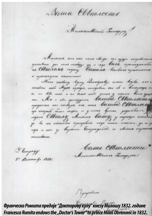
Франческа Ромита предаје "Докторову кулу" кнезу Милошу 1832. године Francesca Romita endows the „Doctor’s Tower“ to prince Miloš Obrenović in 1832.