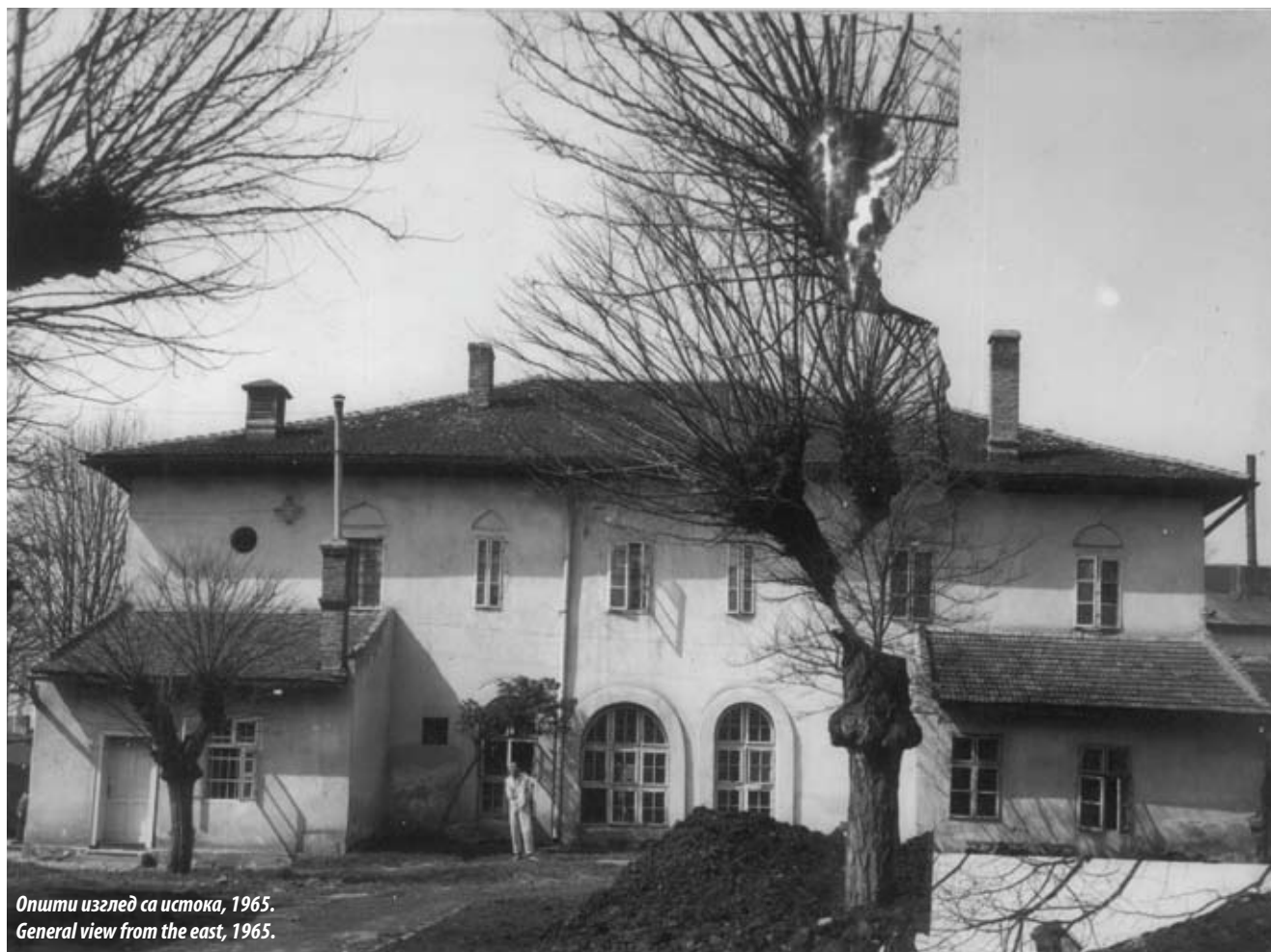
Општи изглед са истока, 1965. General view from the east, 1965.