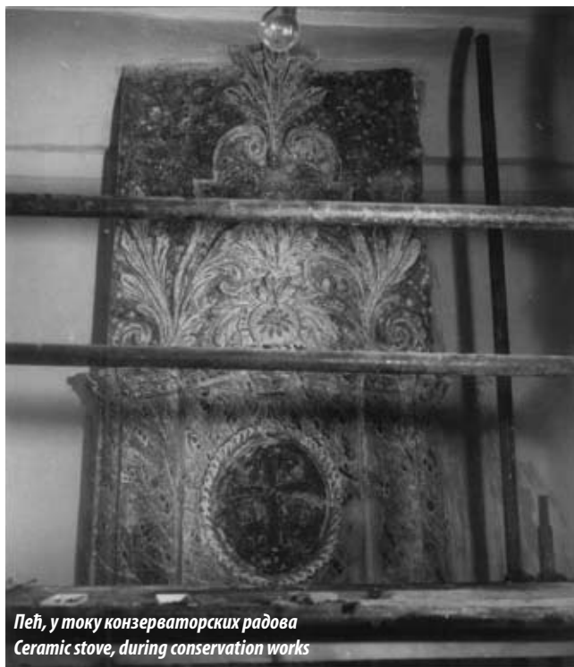
Пећ, у току конзерваторских радова Ceramic stove, during conservation works

Временом је постала окосница и „камен темељац“ формирања Клиничког центра Србије који се данас налази око ње.