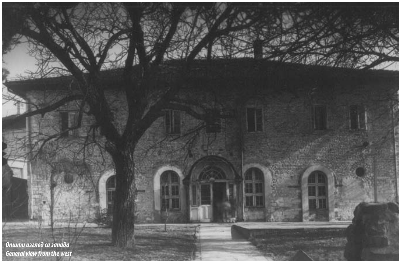
Opшти изглед са запада General view from the west