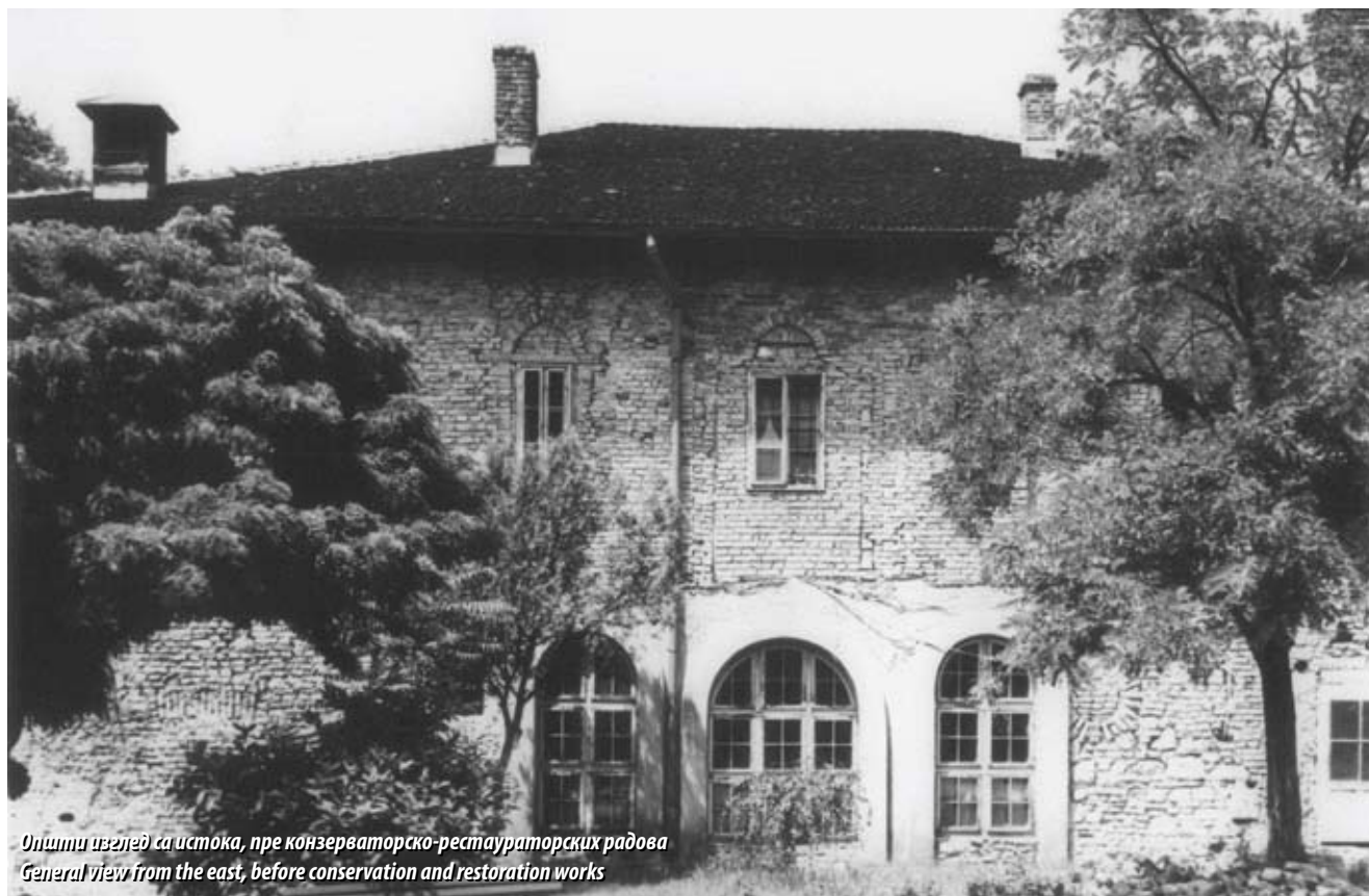
Opštini izvedaj sa istoka, pre konzervatorsko-restauratorskih radova General view from the east, before conservation and restoration works

профилацијама. Архитектонски, иако у себи сједињује различите стилове и утицаје, највише је имала одлике куле по чему је и добила назив „Докторова кула“: четвртастог облика од камена без обраде, са малим прозорима у приземљу. Истовремено, по величини и изгледу унутрашњег простора имала је одлике конака само без трема или доксата, а што је било типично за конаке виђенијих људи. Иако једноставног изгледа била је репрезентативна и споља и изнутра за то доба. Специфичност су били прозори са зашиљеним луком оријенталног карактера на спрату. Неимар куће др Ромите није познат али се претпоставља да је у питању домаћи мајстор који је познавао одлике балканске архитектуре. Данашњи полукружни отвори у приземљу изведени су пре 1908. године. На западној фасади на спрату било је померања прозора, али, нажалост, аутентични цртежи изгледа нису сачувани.