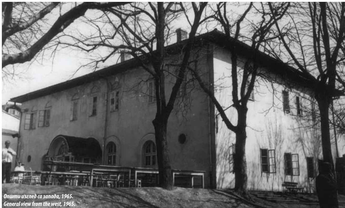
Opшти изглед са запада, 1965. General view from the west, 1965.