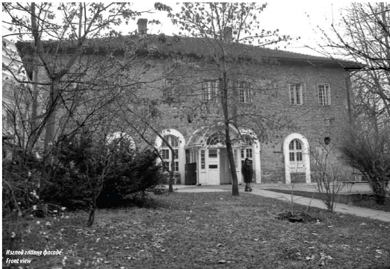
Изглед главне фасаде Front view

than a lime, and as such it would not withstand even a single cannon detonation. 3 The building was constructed according to the doctor's ideas in 1824.