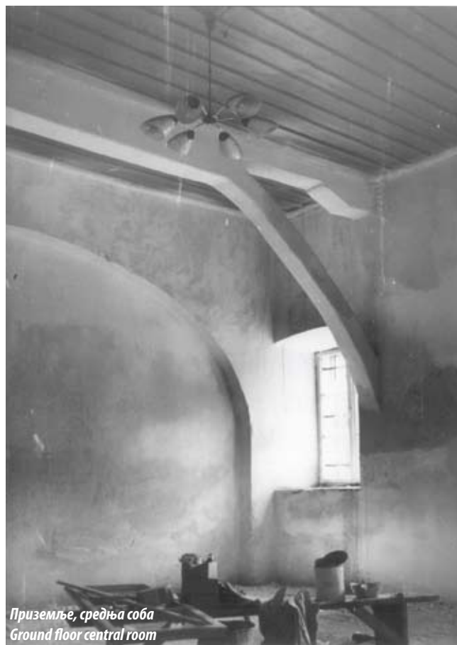
Приземље, средња соба Ground floor central room

the appearance, it had representational exterior and interior for the time period. Its specific feature is the oriental pointed-arch windows on the first floor. The constructor of doctor Romita’s tower remains unknown, but it is assumed that he was a local building craftsman, who knew the characteristics of Balkan architecture. The semicircular openings on the ground floor were designed and applied earlier than 1908. The position of the first floor windows on the western façade has been changed, but unfortunately, the authentic project drawings have not been preserved.