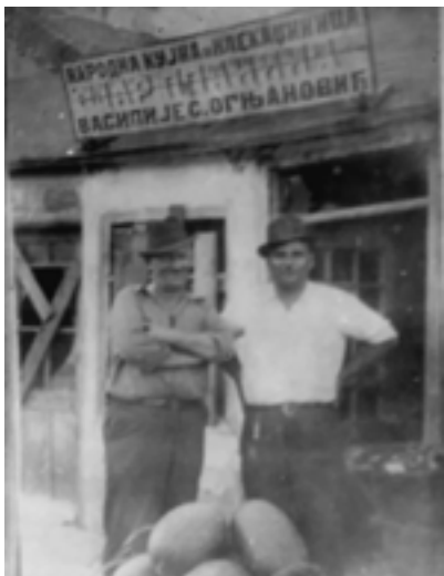
Сл. 12 / Испред народне кујне „Шар њланина” (Удружење грађана Стари Чукаричанин)