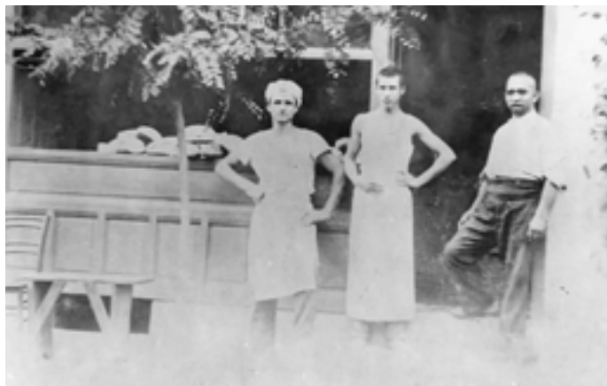
Сл. 8 / Испред једне пекарске радње на Чукарици (Удружење грађана Сџари Чукаричанин)