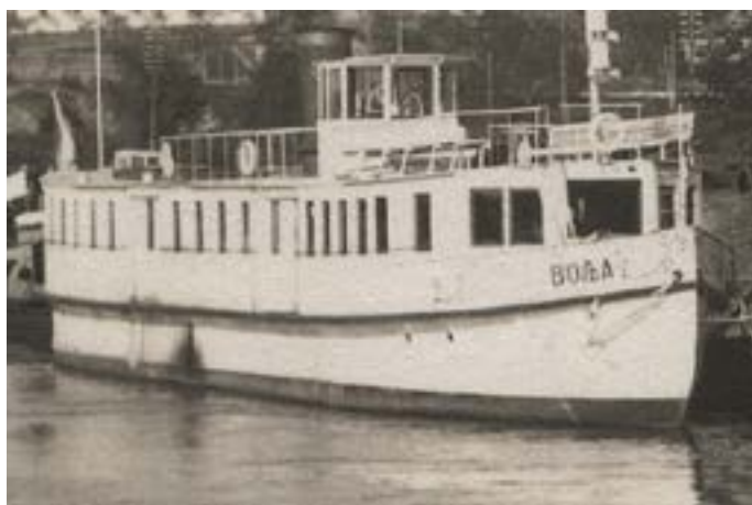
Сл. 4 / Брод „Воља”.