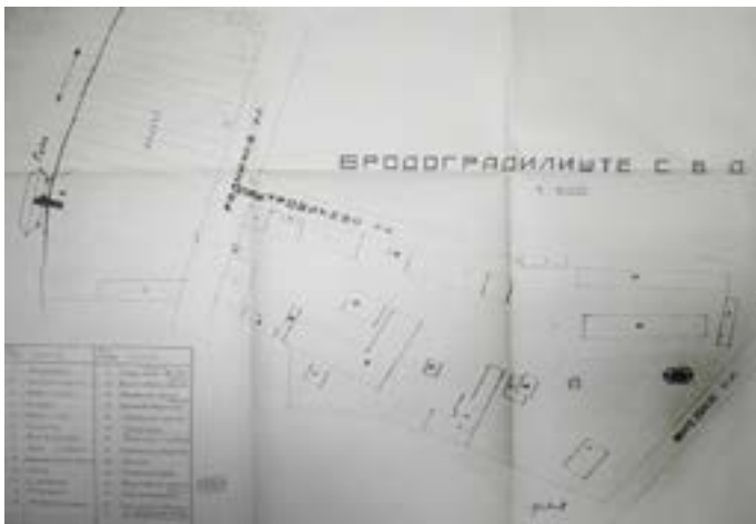
Сл. 3 / Ситуациони план радионице и осталих објеката Српског бродарског друштва на Чукарици крајем тридесетих година XX века.