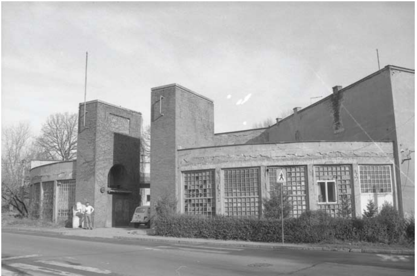
Италијански павиљон, 1990. Italian pavilion, 1990.

further expansion of this prominent economic and commercial complex was suspended due to the outbreak of war.