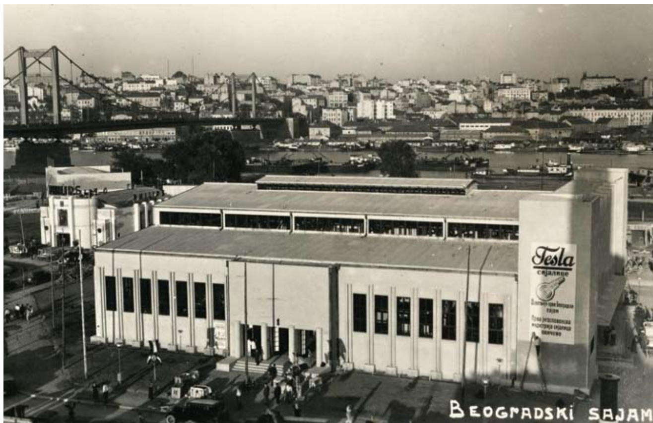
Југословенски павиљон бр. 1 Yugoslav pavilion no.1