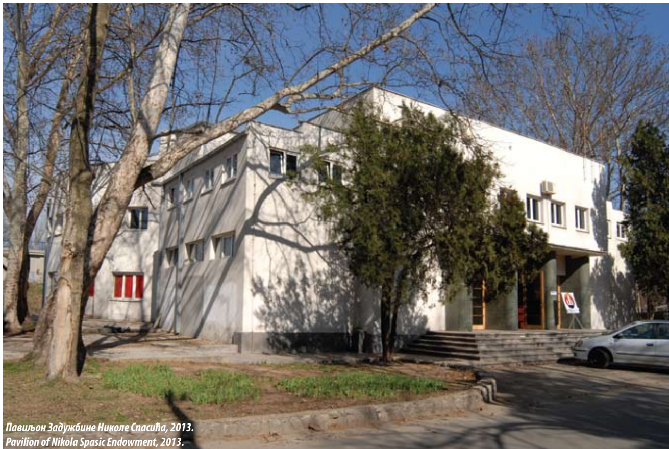
Павиљон Задужбине Николе Спасића, 2013. Pavilion of Nikola Spasic Endowment, 2013.

The Old Fairground ( Staro Sajmište ) on the left bank of the river Sava between the bridges Brankov most (Branko's Bridge) and Savski most (Sava Bridge), is one of the most significant World War II memorials to the sufferings not only in the territory of Belgrade, but also in the entire territory of Serbia. It was designed and constructed as an exclusive fair complex originally designed to indulge the aspirations of the young European state of the Kingdom of Yugoslavia and promote its economic development. Nonetheless, during the war, it was turned into a concentration camp holding around 39,000 prisoners, of whom around