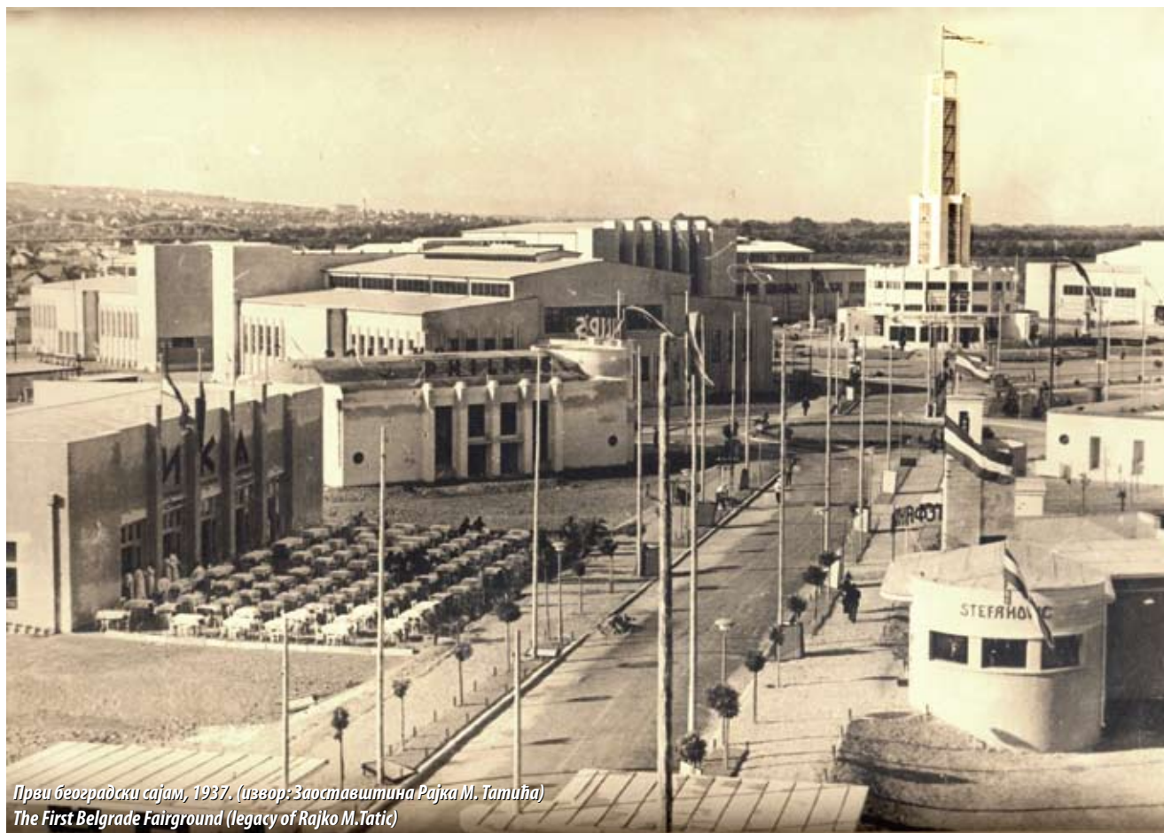
Први београдски сајам, 1937. (извор: Заоставштина Рајка М. Татића) The First Belgrade Fairground (legacy of Rajko M. Tatić)

Старо сајмиште, на левој обали Саве између Бранковог и Трамвајског моста, једно је од најзначајнијих места сећања на страдања у Другом светском рату не само на подручју Београда него и читаве Србије. Осмишљено и реализовано као репрезентативан сајамски комплекс који је требало да покаже амбиције младе европске државе Краљевине Југославије и буде подстрек њеном економском развоју, за време рата претворено је у концентрациони логор где је