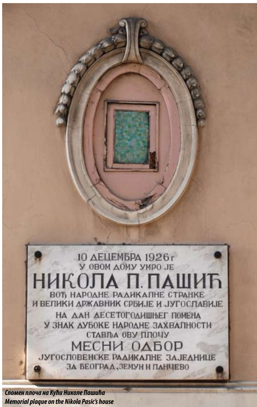
Спомен плоча на Кући Николе Пашића Memorial plaque on the Nikola Pašić's house

On the 10th of December 1936, marking the 10th anniversary of the death of Nikola Pašić, The Local Board of the Yugoslav Radical Union of Belgrade, Zemun and Pančevo placed a white marble plaque on the house in memory of Nikola Pašić who had lived, worked and died there.