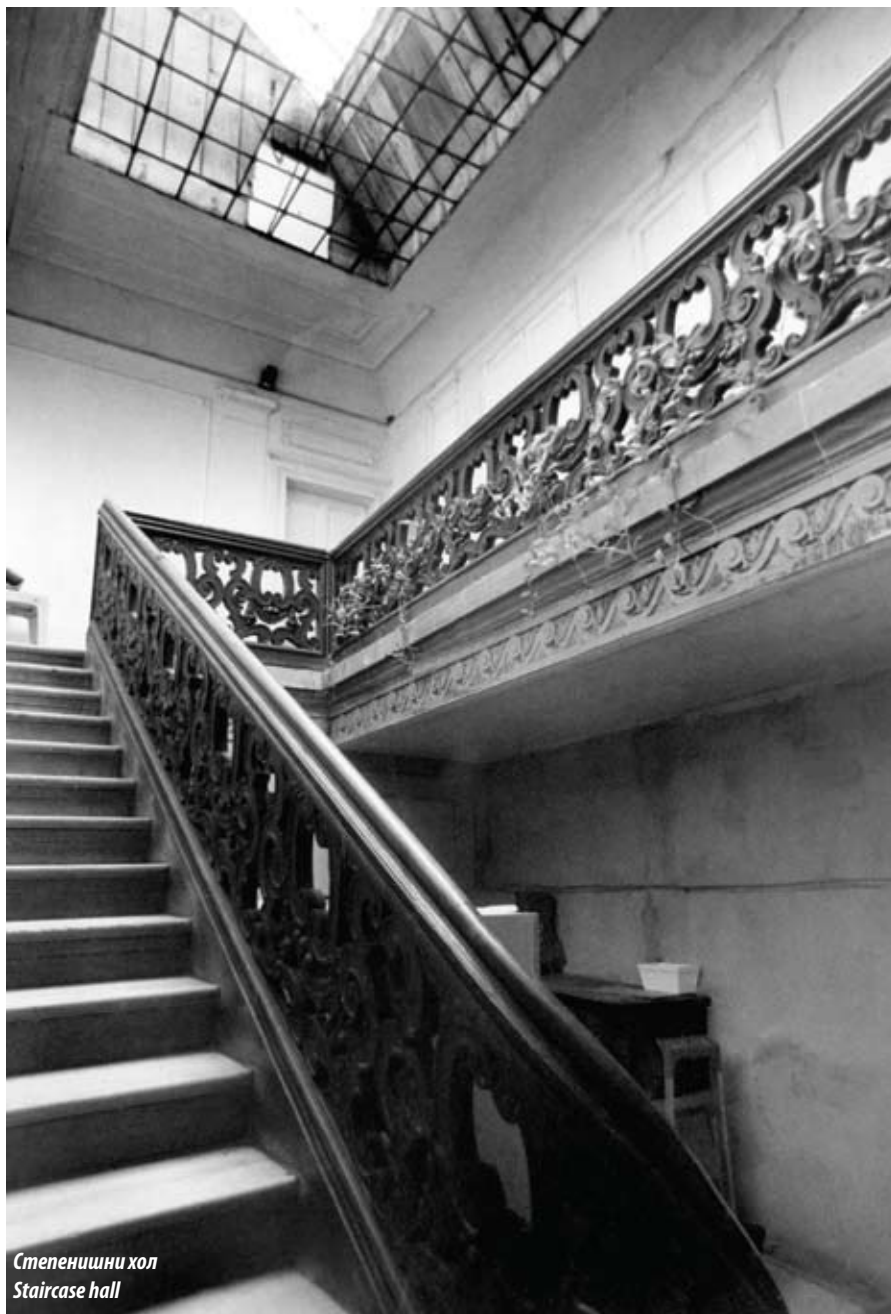
Степенишни хол Staircase hall

Просторна организација приземља обухватала је две собе и тоалет, трпезарију и салон, док се у дограђеном крилу куће налазио радни кабинет, а на спрату је било више соба сличног распореда. Репрезентативност ентеријера постигнута је гипсаним радовима на зидовима и плафону, декоративно обликованим кованим гвожђем и дрветом на степенишним оградама, лустерима, квакама, сликаном декорацијом на зидовима с пасторалним мотивима, уметничким делима, као и вредним предметима свакодневне употребе сакупљаним током времена.