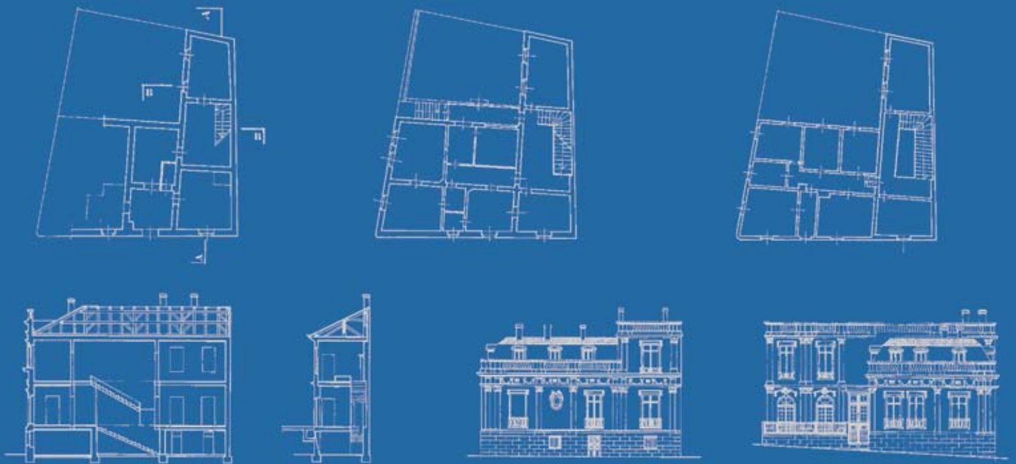
Основе, пресеци и изглед куће, Документација ЗЗСКГБ Ground floor plan, cross sections and facades of the house