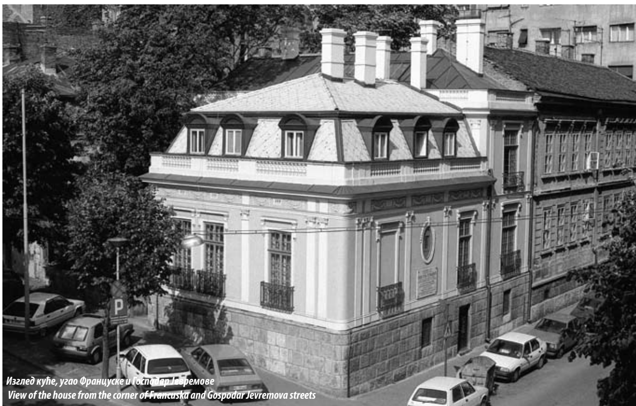
Изглед куће, угао Француске и Господар Јевремове View of the house from the corner of Francuska and Gospodar Jevremova streets

The family house with a garden at 21 Francuska Street in Belgrade was built for the brothers Nikola and Kosta Džango, the famous grocers of the Dorćol Belgrade District, around 1872. After the brothers passed away, Nikola Pašić, Serbian politician and statesman, bought the house at the auction held by the Dorćol Quarter Police in 1893.