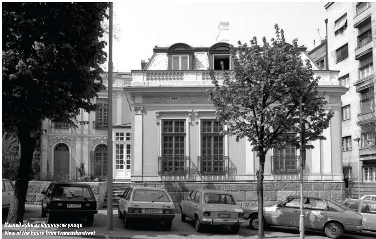
Изглед куће из Француске улице View of the house from Francuska street

Породична кућа са баштом у Француској улици бр. 21 у Београду саграђена је око 1872. године за браћу Џанга, Николу и Косту, познате дорђолске трговце болтације. После њихове смрти, кућу је купио Никола Пашић, српски политичар и државник, на јавној лицитацији коју је одржала полиција Дорђолског кварта 1893. године.