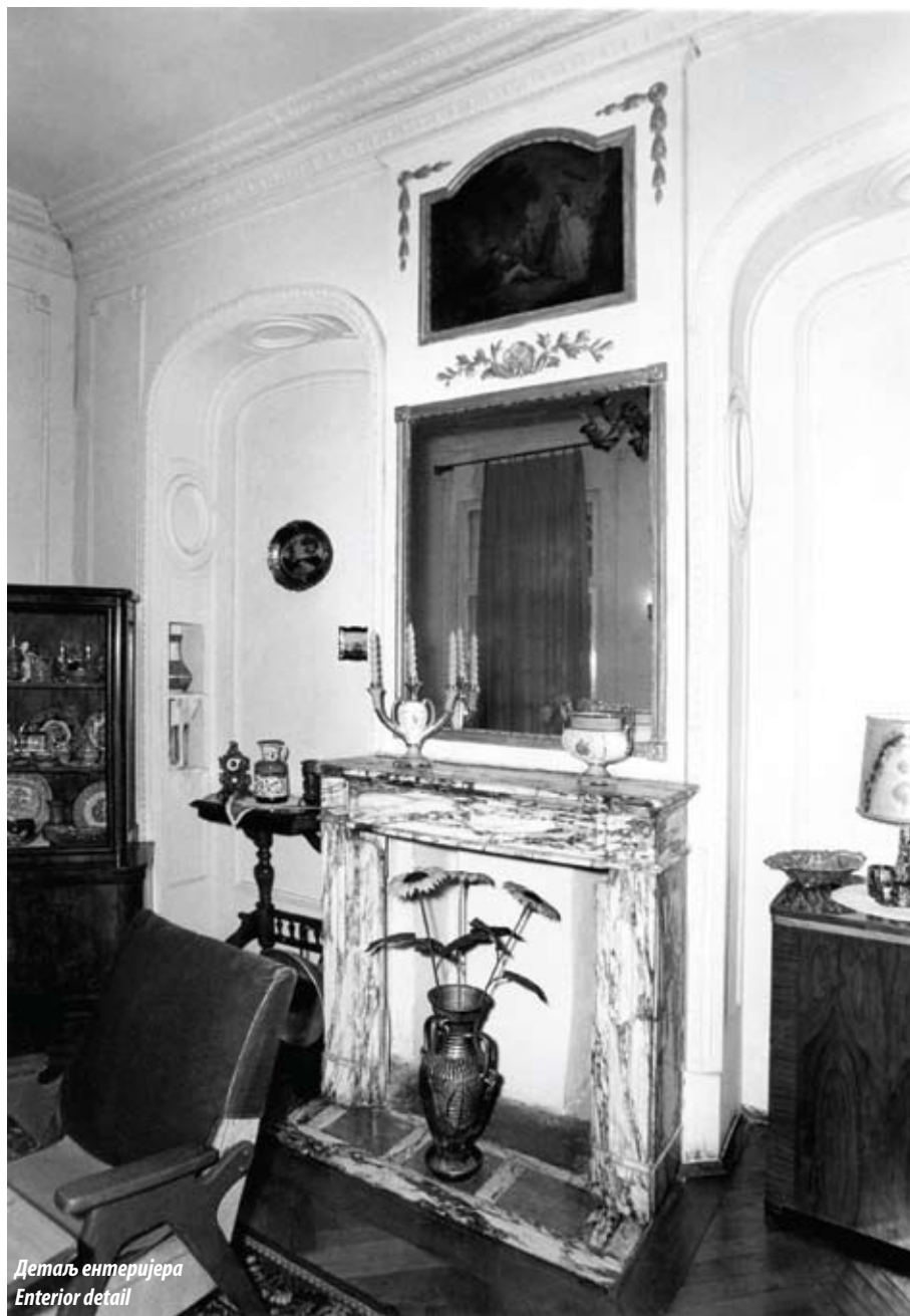
Детаљ ентеријера Interior detail

На десетогодишњицу смрти Николе Пашића, 10. децембра 1936. године, месни одбор југословенске радикалне заједнице за Београд, Земун и Панчево поставио је белу мермерну спомен-плочу у знак сећања да је у кући живео, радио и умро Никола Пашић.