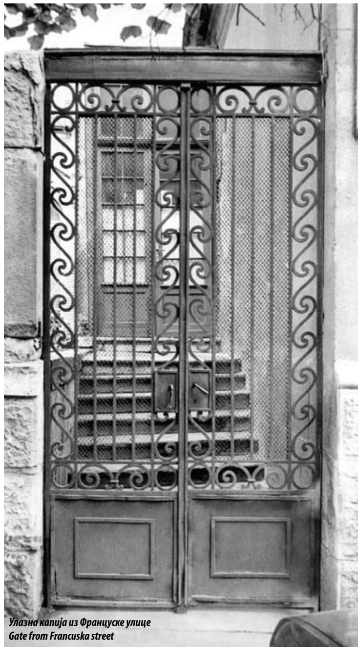
Улазна капија из Француске улице Gate from Francuska street

Као инжењер, Никола Пашић је утицао на изглед и уређење свог дома у Београду, због чега је урбана вредност куће још значајнија. Она је симбол трансформације турског Дорћола и Београда у модерну европску престоницу и место где је живео, стварао и умро један од најзначајнијих политичара новије српске историје.