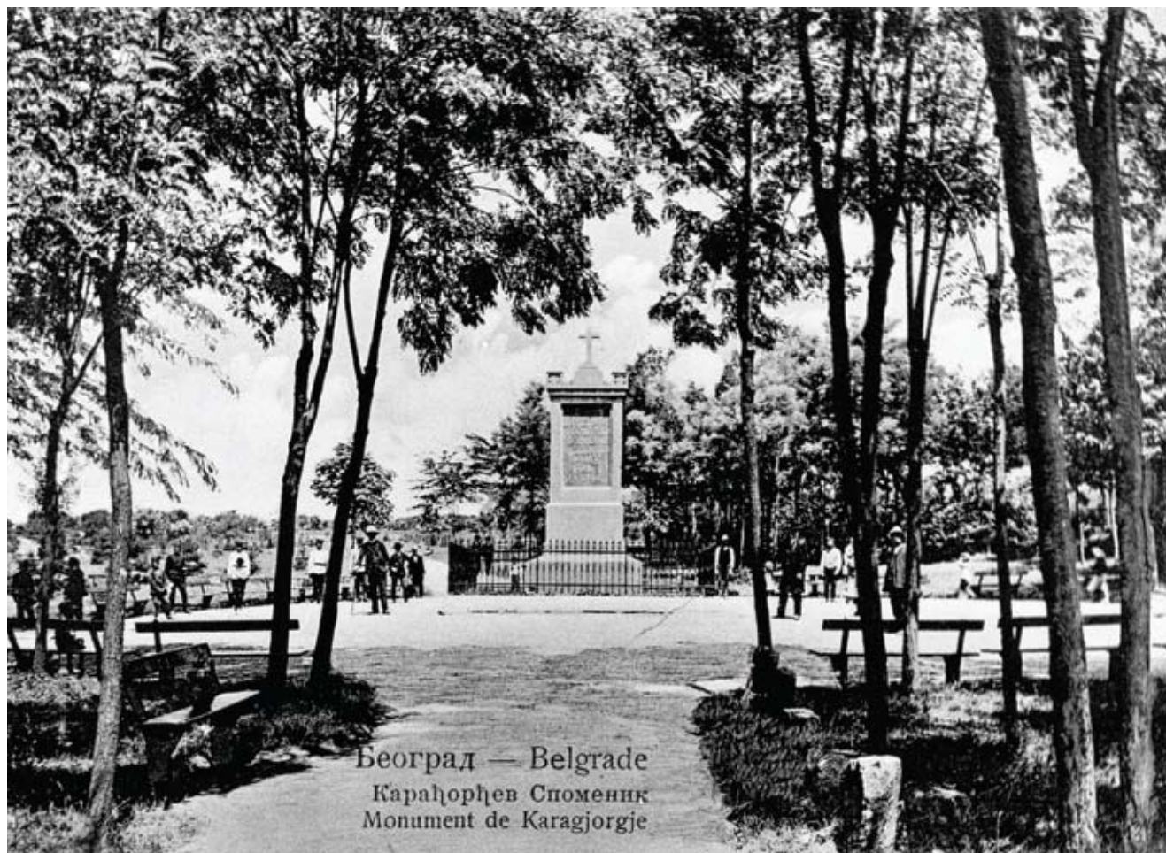
Споменик на гробљу Ослободилаца Београда 1806, Карађорђевић парк (фотографија око 1910.) The Monument to and Cemetery Of The Liberators of Belgrade in 1806, photo taken in 1910.

the last remains of the insurrectional cemetery that occupied a large part of the terrain that covers today's Karađorđe's park.