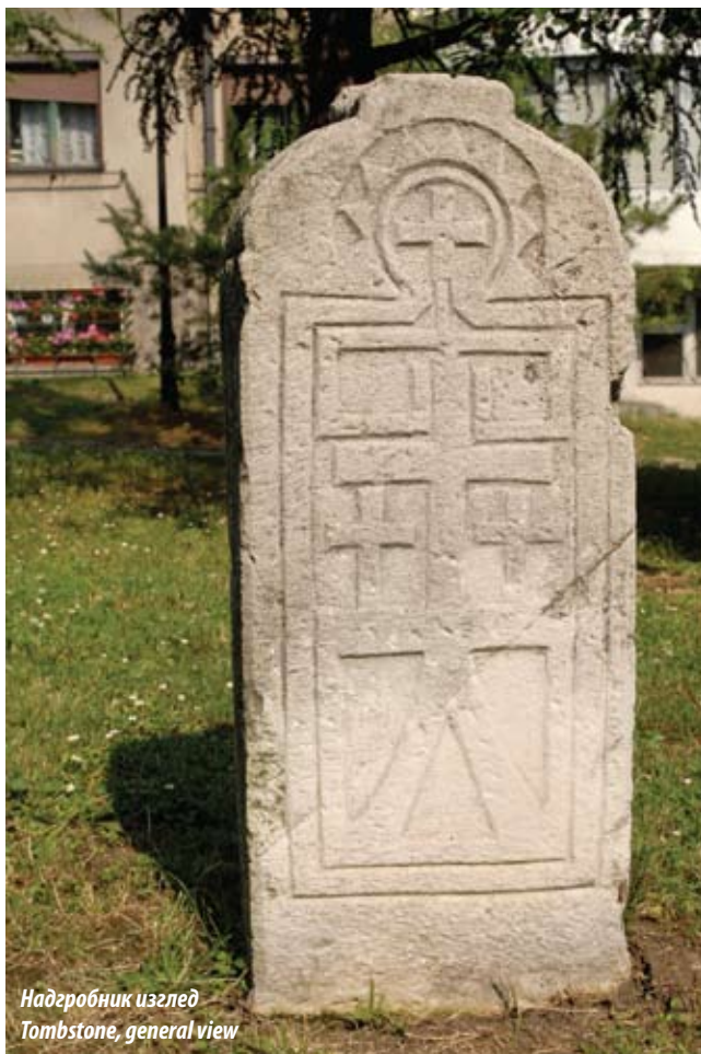
Надгробник изглед Tombstone, general view