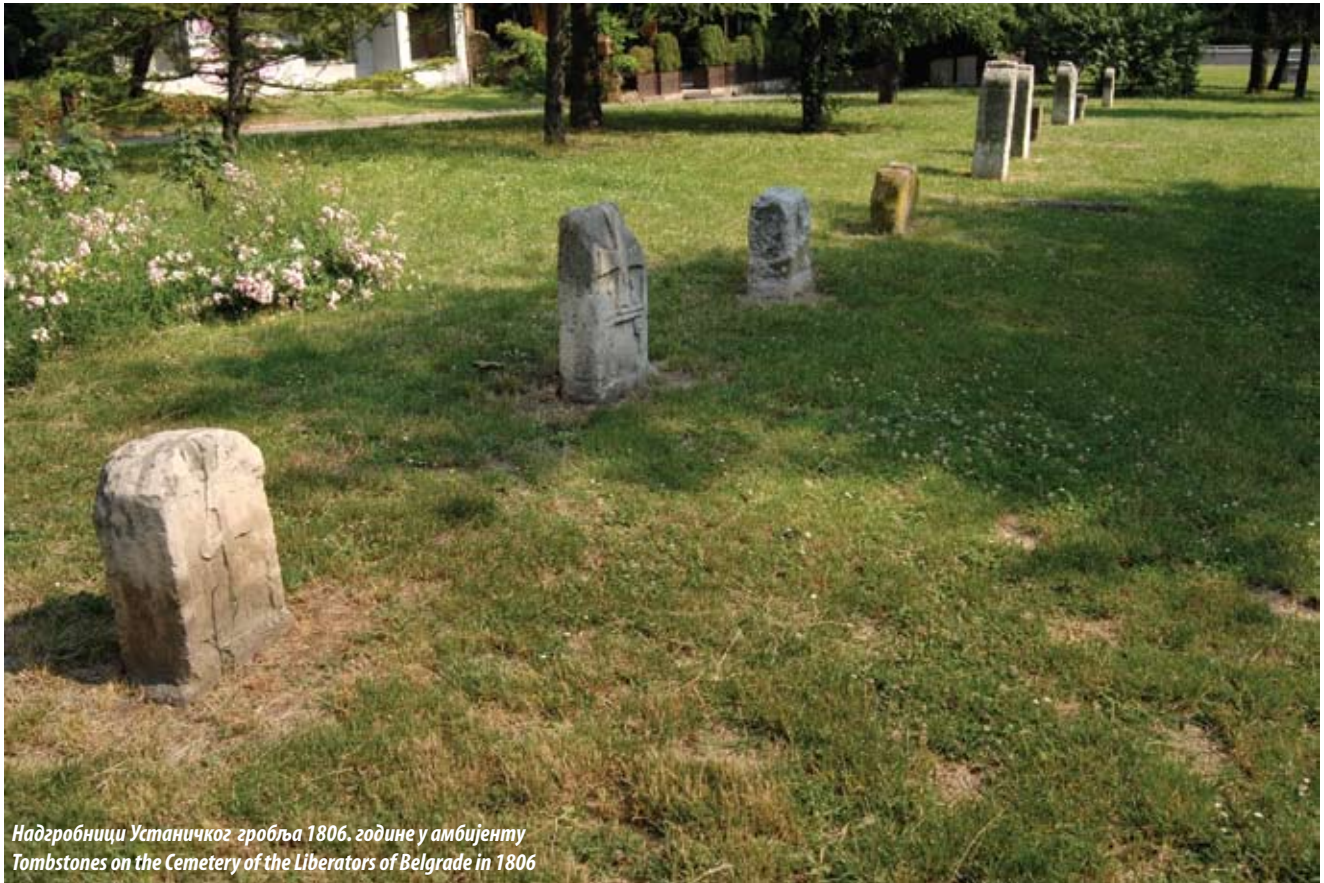
Надгробници Устаничког гробља 1806. године у амбијенту Tomstones on the Cemetery of the Liberators of Belgrade in 1806

In the central part of Karađorđe's park, there is a modestly built monument, erected by Aleksandar Karađorđević in 1848 to the glory of the revolutionaries who lost their lives in the battles for the liberation of Belgrade from the Turks in 1806.