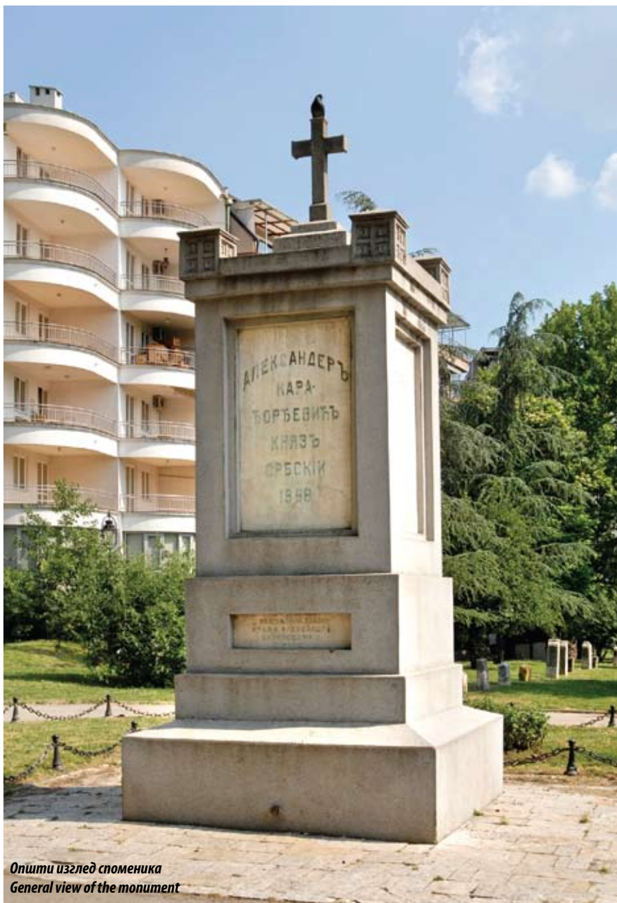
Општи изглед споменика General view of the monument

На овом гробљу сахрањени су устаници изгинули у освајању Београда 1806. године, изузев Васе Чарапића, који је, према сопственој жељи, сахрањен код манастира Раковица недалеко од Београда.