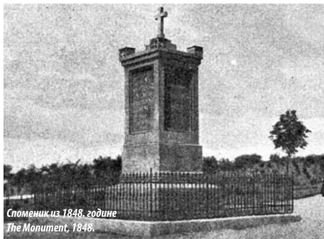
Споменик из 1848. године The Monument, 1848.

нам није познато какве су поправке на споменику вршене. Ограда око споменика коју Мишковић помиње постојала је до 1956. године, кад је с дозволом Републичког завода за заштиту споменика културе уклоњена у преуређењу парка.