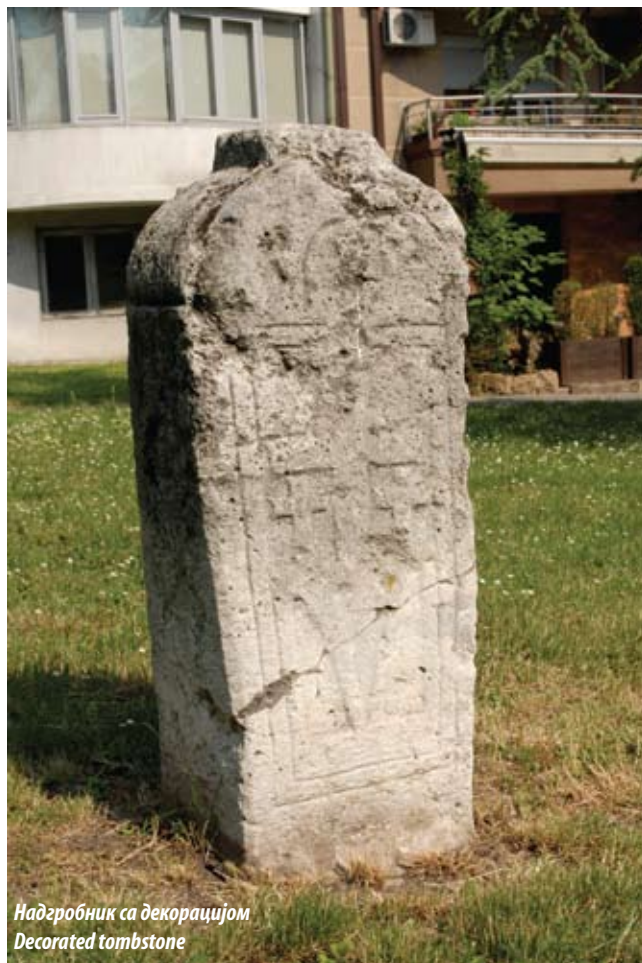
Надгробник са декорацијом Decorated tombstone

of monuments and milestones in the raising of a new type of cenotaph within which religious and national symbolism permeated each other.