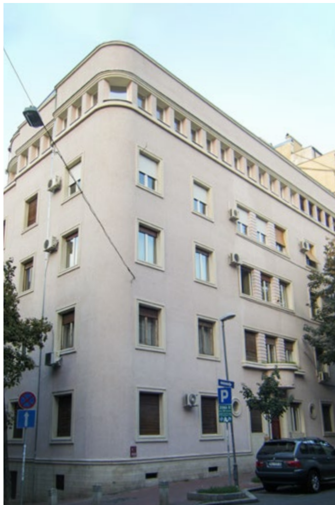
Сл. 3 / Изглед зграде на углу Господар Јевремове 57 и Доситејеве, 2016.

Значај ове зграде за историју српске архитектуре је вишеструк. Прво, она је подигнута на углу Господар Јевремове и Доситејеве, које спадају у најстарије