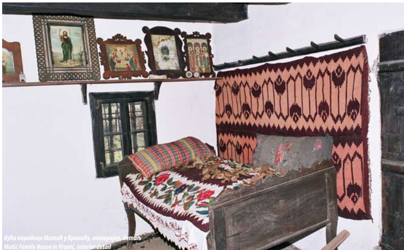
Кућа породице Матић у Вранићу, ентеријер, детаљ Matić Family House in Vranić, interior detail