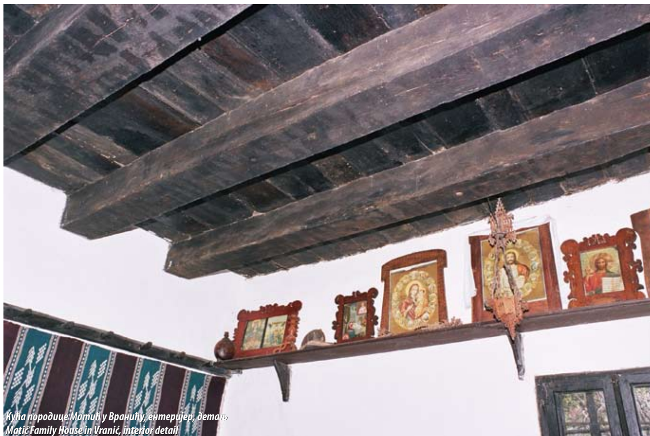
Кућа породице Матић у Вранићу, ентеријер, детаљ Matic Family House in Vranić, interior detail