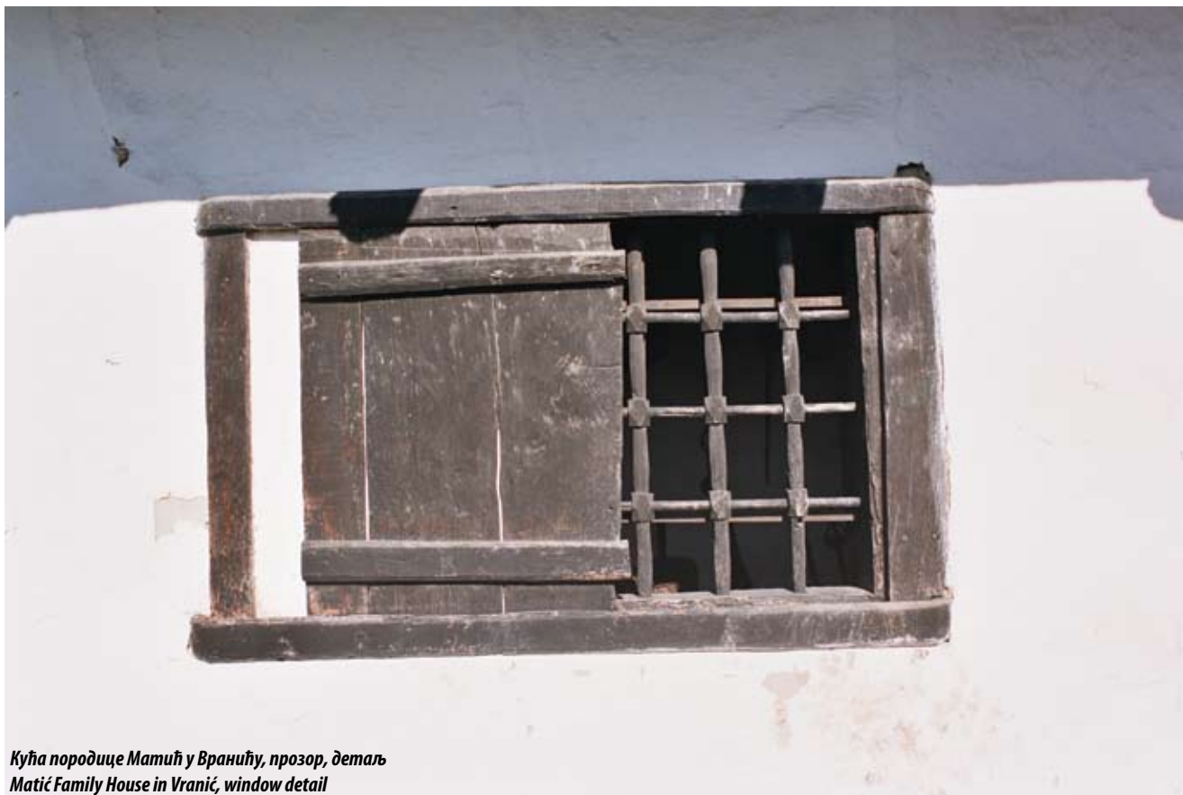
Кућа породице Матић у Вранићу, прозор, детаљ Matic Family House in Vranić, window detail

економском јачању и бржем политичком и социјалном сазревању вранићке средине. Тако је Вранић у извесном смислу постао изузетак у општем, углавном једноличном развоју села београдске околине током 19. века.