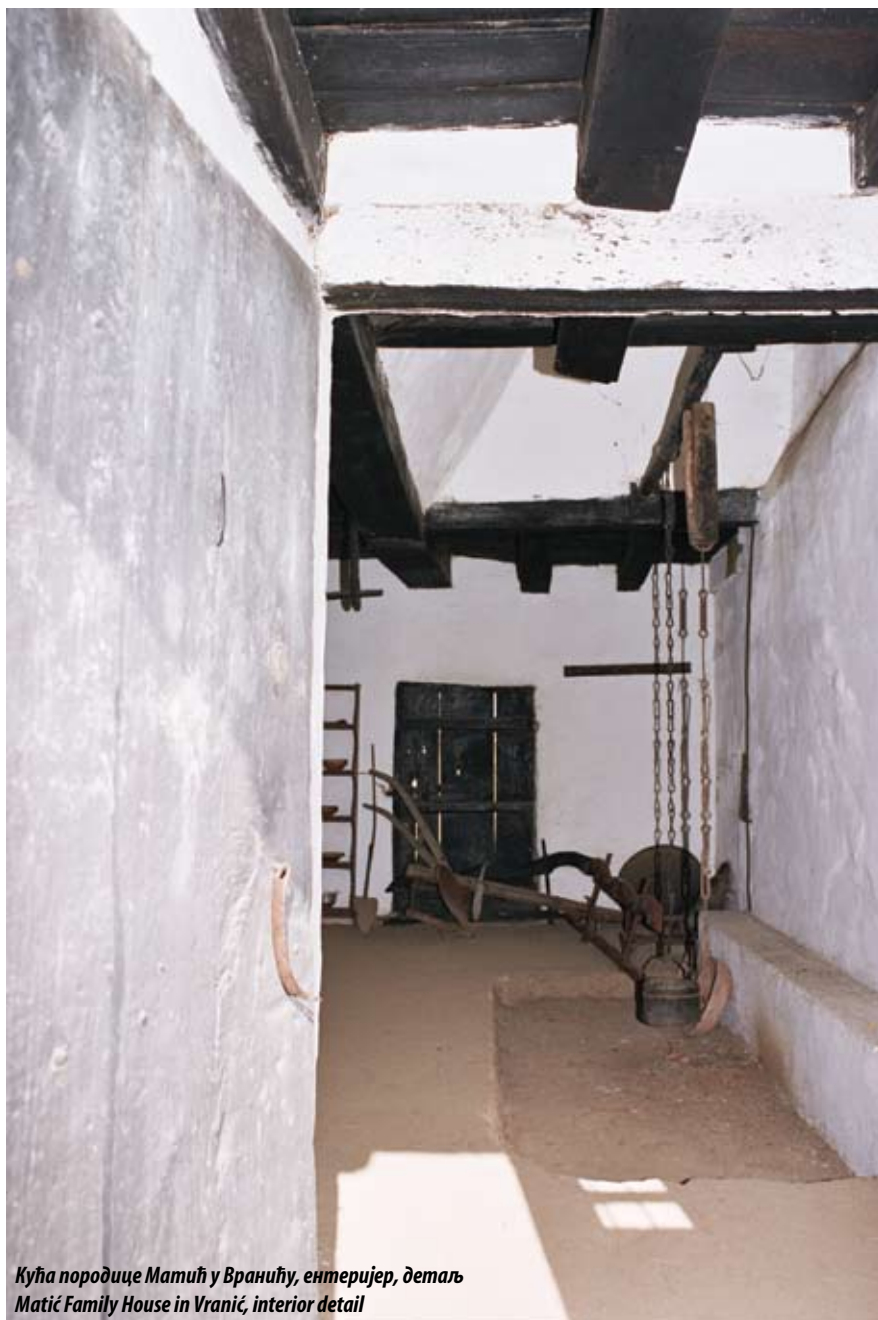
Кућа породице Матић у Вранићу, ентеријер, детаљ Matić Family House in Vranić, interior detail

The interior of the house with its hearth, earthen floors, beam and board ceilings, rustically hewn and modestly decorated doors, and whitewashed walls has been preserved through careful conservation and restoration