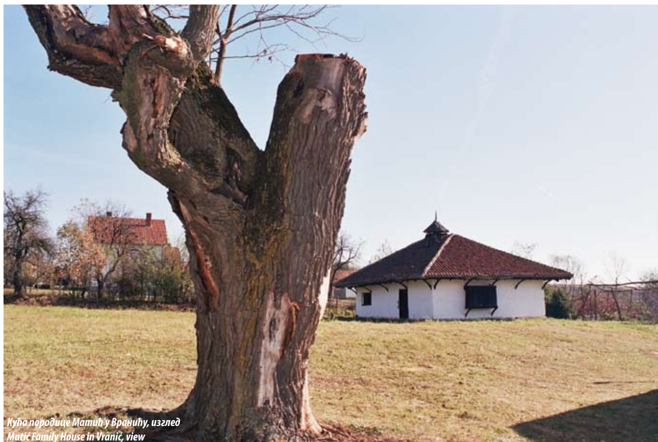
Кућа породице Матић у Вранићу, изглед Matić Family House in Vranić, view

The village of Vranić is in the Belgrade Municipality of Barajevo. The earliest reference to it can be found in the Ottoman tax register of 1528/30 for the population of vlach (eflak) status in the nahiye of Belgrade which recorded three vlach households. The number of inhabitants in later census records varies, depending on historical circumstances, but in the course of the nineteenth century relevant data become ever more numerous, diverse and exhaustive. Thus we know that in 1818 Vranić had 80 households and 193 tax heads, which made it the fourth largest village among a total of 122 villages in the nahiye of Belgrade. In 1836 Vranić with its 90 households was the