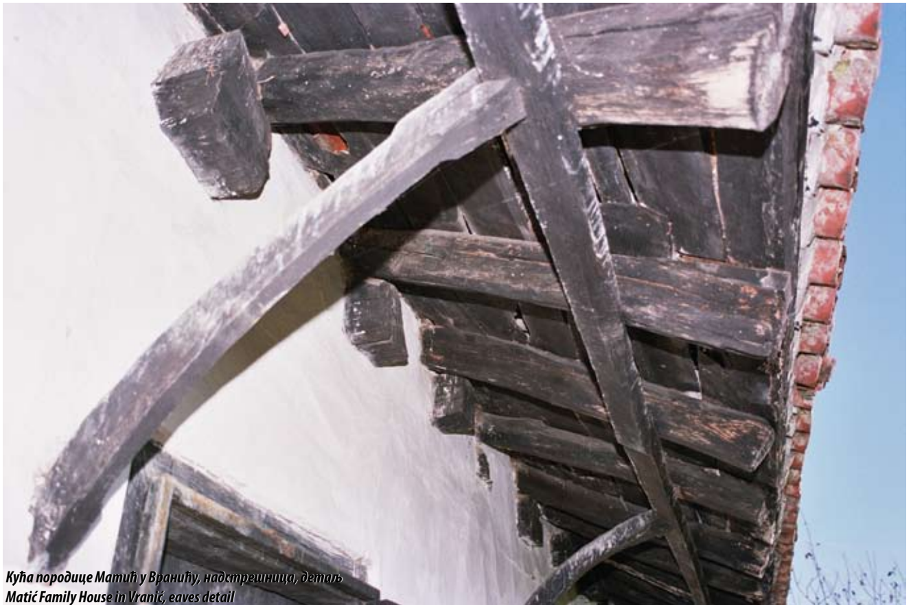
Кућа породице Матић у Вранићу, надстрешница, детаљ Matic Family House in Vranjić, eaves detail

Ентеријер куће, са отвореним оцаком, земљаним подовима, таваницама од дрвених греда са талпама између њих, рустично тесаним и скромно декорисаним вратима и бело окреченим зидовима – сачуван је брижљивим конзерваторским поступцима.