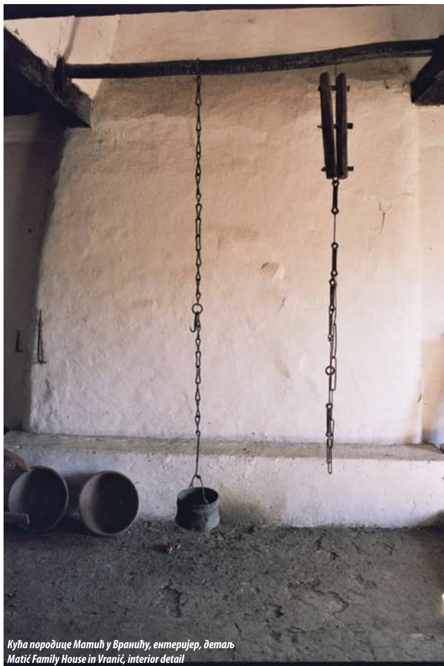
Кућа породице Матић у Вранићу, ентеријер, детаљ Matić Family House in Vranić, interior detail

treatment. Namely, the Matic family house could not be preserved on its original site on the periphery of the village and was therefore moved to the churchyard.