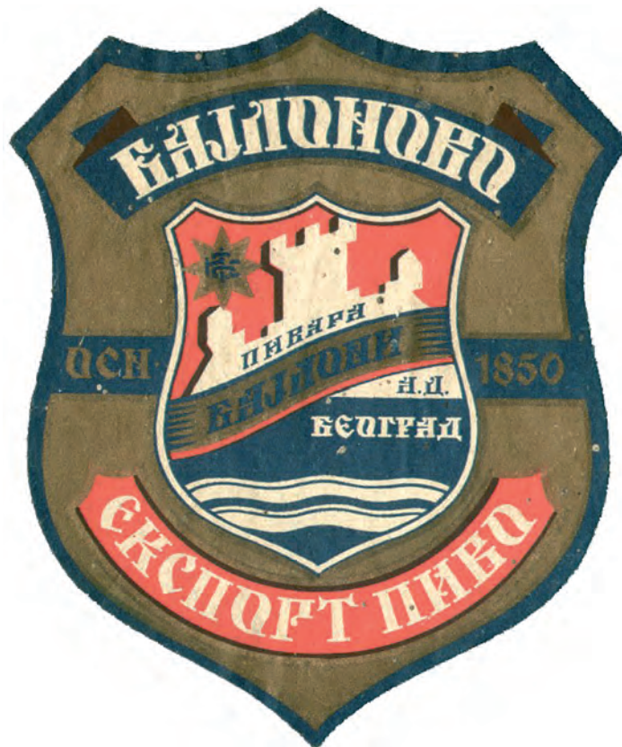
Сл. 3. Етикетна 'Експортно пиво'