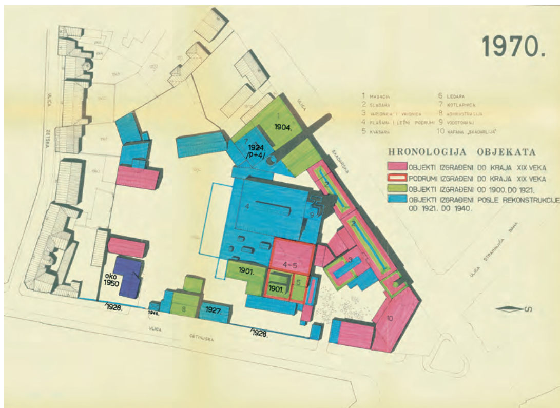
Сл. 6. Развој грађевина у крућу Пиваре

се очекивало да се Пивара урбанистичким планом исели и пребаци на обалу Дунава. 77 Наставила је самостално да послује до јануара 1963. године, када је након заједничке седнице Радничких савета Пиваре „Београд“, Пиваре „7. јули“ и фирме „Безалко“ одлучено да се изврши интеграција и формира нова јединствена фирма Београдска индустрија пива и безалкохолних пића – БИП. Заједничко предузеће основано је 28. јануара 1963. године решењем бр. 259/1, а оснивач је постао НОО Савски венац. 78 Након стварања БИП-а отпочела је и модернизација Пиваре, која се тада звала Погон II, али је ипак велика већина новчаних средстава била усмерена на БИП-ов погон I, тј. бившу Вајфертову пивару. С обзиром на то да се Пивара налазила у самом центру града, није се могло приступити детаљној модернизацији и изградњи без сагласности надлежних служби. Решењем Завода за заштиту споменика културе града Београда број 322/2 од 28. 8. 1967. године стављена је под заштиту урбана целина Скадарлија, као споменичка целина, историјских, меморијалних и амбијенталних вредности, чији је један део била и бивша Парна пивара „Игњат Бајлони и синови“. Група стручњака из Завода за заштиту споменика културе града Београда, коју су чинили Жељко Шкаламера, Гордана Гордић, Ј. Алексић и М. Дедић, израдила је 1971. године елаборат о Пивари и валоризовала њене објекте и њихов коначан закључак је био да се Пивара, као још увек производно активна, треба очувати као музеј пиварства. 79 (сл. 6)