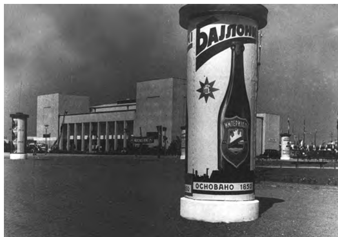
Сл. 5. Рекламни јано за 'Имјеријал пиво' на Београдском сајму

У одељењу где се вршило точење у флаше налазиле су се две комплетне линије за прање, пуњење и затварање боца. Оне су биле различитог капацитета и то прва и већа 2.500 боца на сат, док је друга, мања, имала капацитет од 1.000 боца на сат. У истом овом одељењу налазио се и пастеризатор, у којем су се већ напуњене и затворене боце додатно загревале у врућој води, чија је температура била 80 степени Целзијуса, након чега су се потом постепено хладиле. Процес пастеризације примењиван је због потребе да пиво буде дуготрајније, те да може да поднесе дужи транспорт на великим вршинама, а да се не поквари. Капацитет пастера био је 3.000 боца, а једна пастеризација је трајала шест сати.