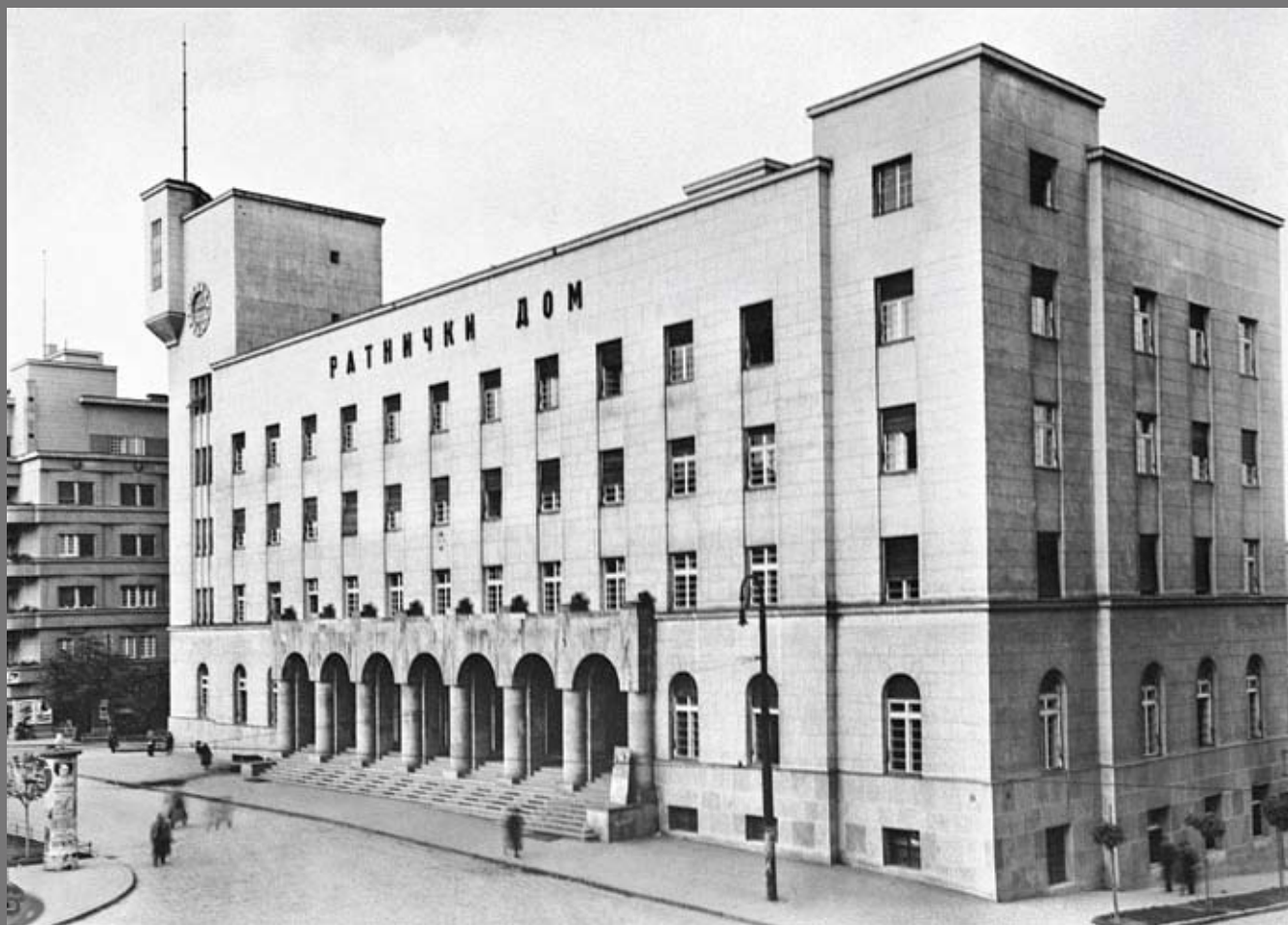
Изглед фронталне фасаде – историјска фотографија 1932-39. год. Front façade, historical photograph 1932-39