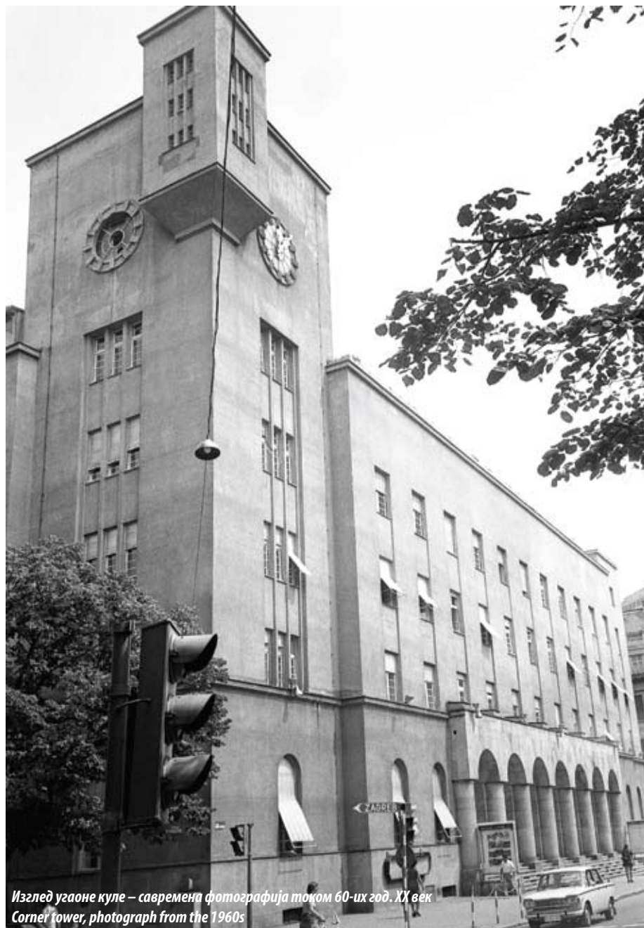
Изглед угаоне куле – савремена фотографија током 60-их год. XX век Corner tower, photograph from the 1960s

The final version of the accepted design was considerably different from both second-prize winning proposals. Instead of elaborate eclectic architectural ornament, a restrained modernist concept is applied, especially in the first to third floor zone perforated with sets of vertically aligned windows. The distinctive accent in the ground-floor zone is the central loggia with its slightly protruding arcade supported by massive columns and fronted by a wide flight of stairs. A particularly prominent feature of the building is the corner tower which somewhat relieves the monotony of the front façade, while emphasising the building's expressive monumentality and military character. The idea behind the tower, inspired by medieval and Renaissance models in form, was to emphasise the physical presence of the building and, on the symbolical level, to function as a visual statement of its military character. The symbolism of such an architectural program is best summed up in a magazine article published in 1929: "Veterans' Club needed to be framed in soldierly terms, in the form of a fortress, a medieval castle with turrets and donjons, with perhaps somewhat brutal forms, i.e. a character of masculinity, heroism etc. Architecture is a symbolic art: the exterior of a building should be expressive of its use." 5