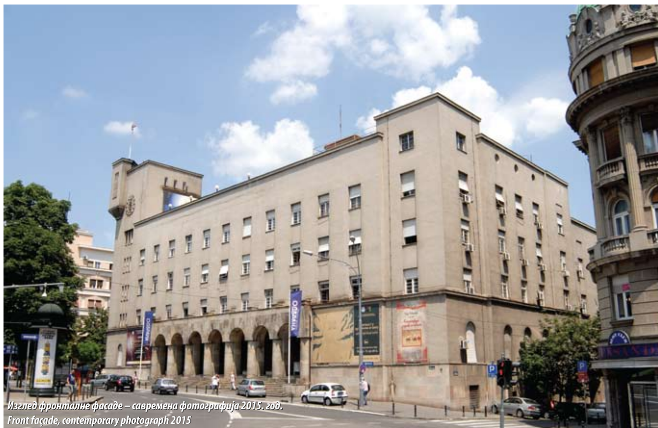
Изглед фронталне фасаде – савремена фотографија 2015. год. Front façade, contemporary photograph 2015

The building of the Veterans' Club 1 , present-day Central Military Club of Serbia, consists of two wings, one, facing Braće Jugovića Street, built in 1929–32, the other, facing Simina, Francuska and Emilijana Josimovića streets, in 1939, on a lot granted to the veterans' Cycling Club by the city. It was built to a competition design by the architects Živko Piperski and Jovan Jovanović, and is their most important single work.