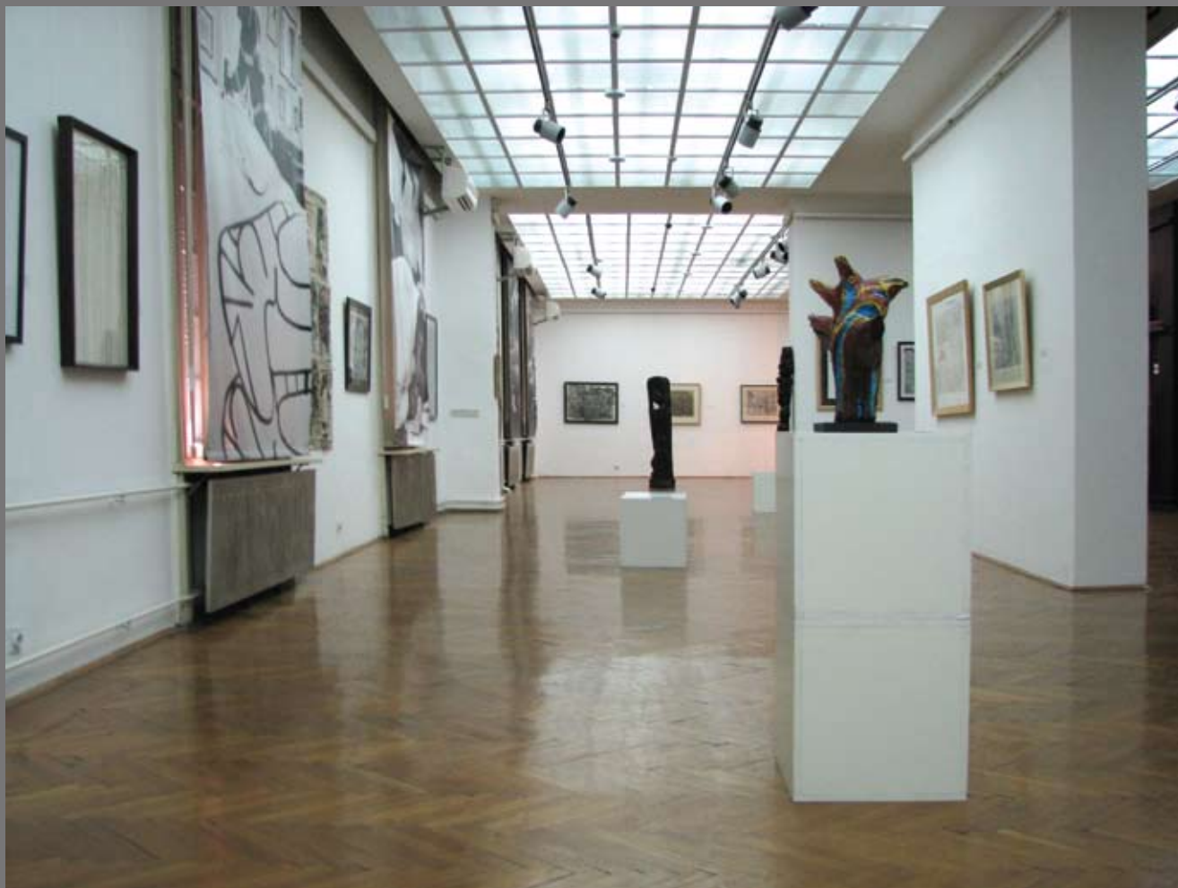
Изглед ентеријера – савремена фотографија 2015. год. Interior, contemporary photograph, 2015