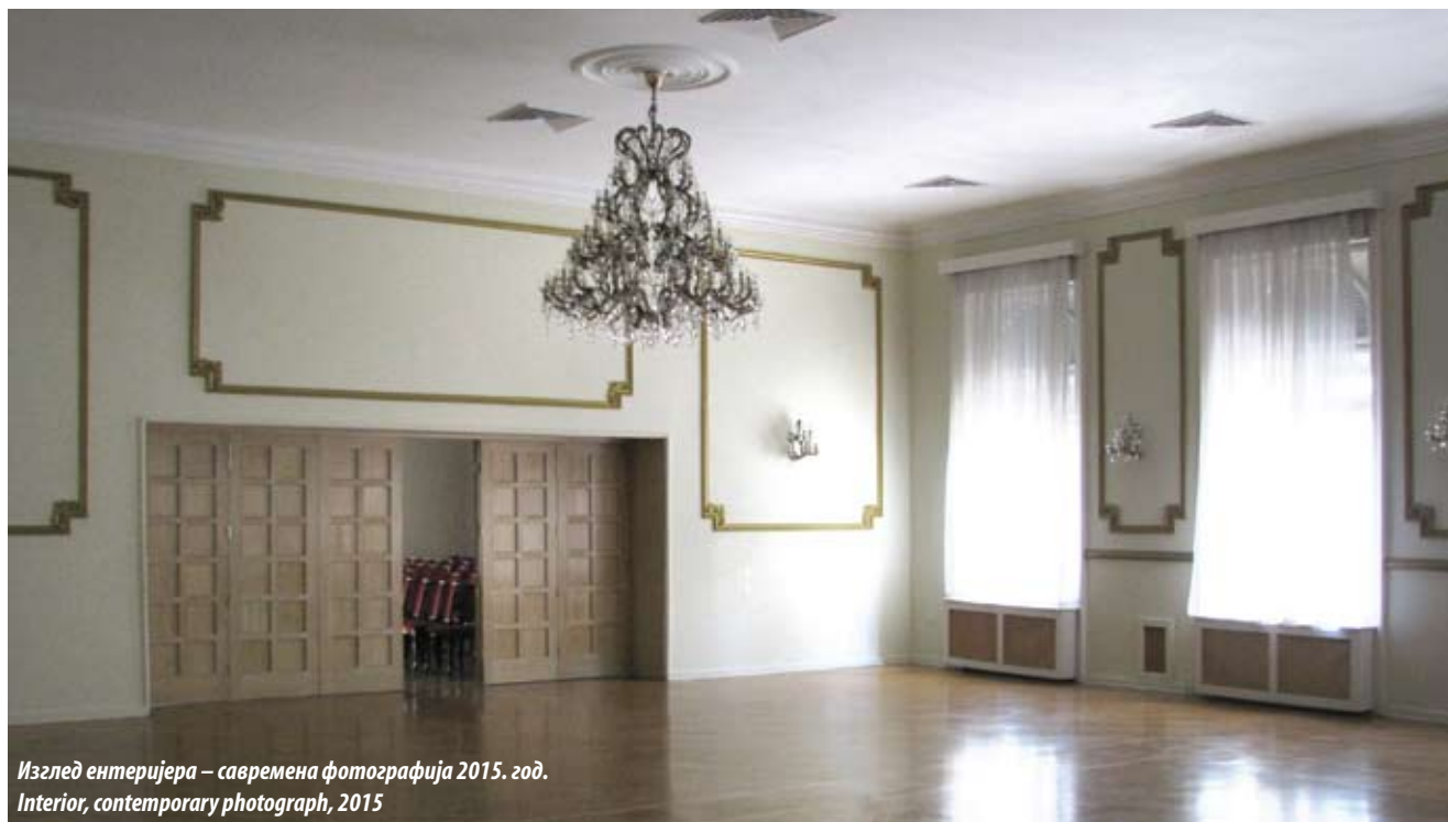
Изглед ентеријера – савремена фотографија 2015. год. Interior, contemporary photograph, 2015

This symbolism was also to be expressed by a proposed but unrealised sculptural program consisting of eight statues, one above each column of the loggia: a medieval armoured warrior of the Nemanjić age and of the age of Stefan Dušan, a Kosovo warrior, a gusle player, a member of Karadjordje's insurgent army, a soldier of the 1876 War of Independence, a First Balkan War soldier of 1912, and a Yugoslav soldier of 1918. 6 Such an iconographic concept and historical sequence was meant to highlight the continuity of the struggle for the liberation and unification of the South Slavs in keeping with the promoted ideology of Yugoslavism.