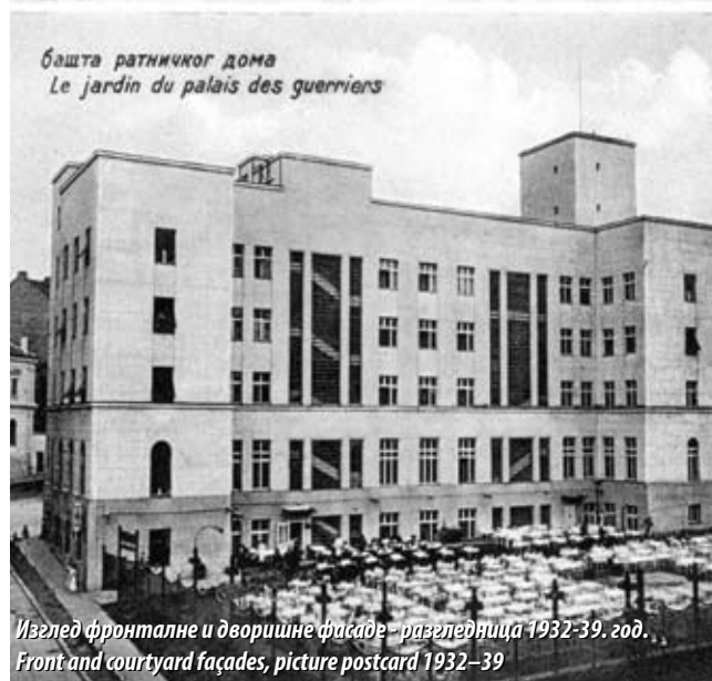
Изглед фронталне и дворичне фасаде - разгледница 1932-39. год. Front and courtyard façades, picture postcard 1932–39