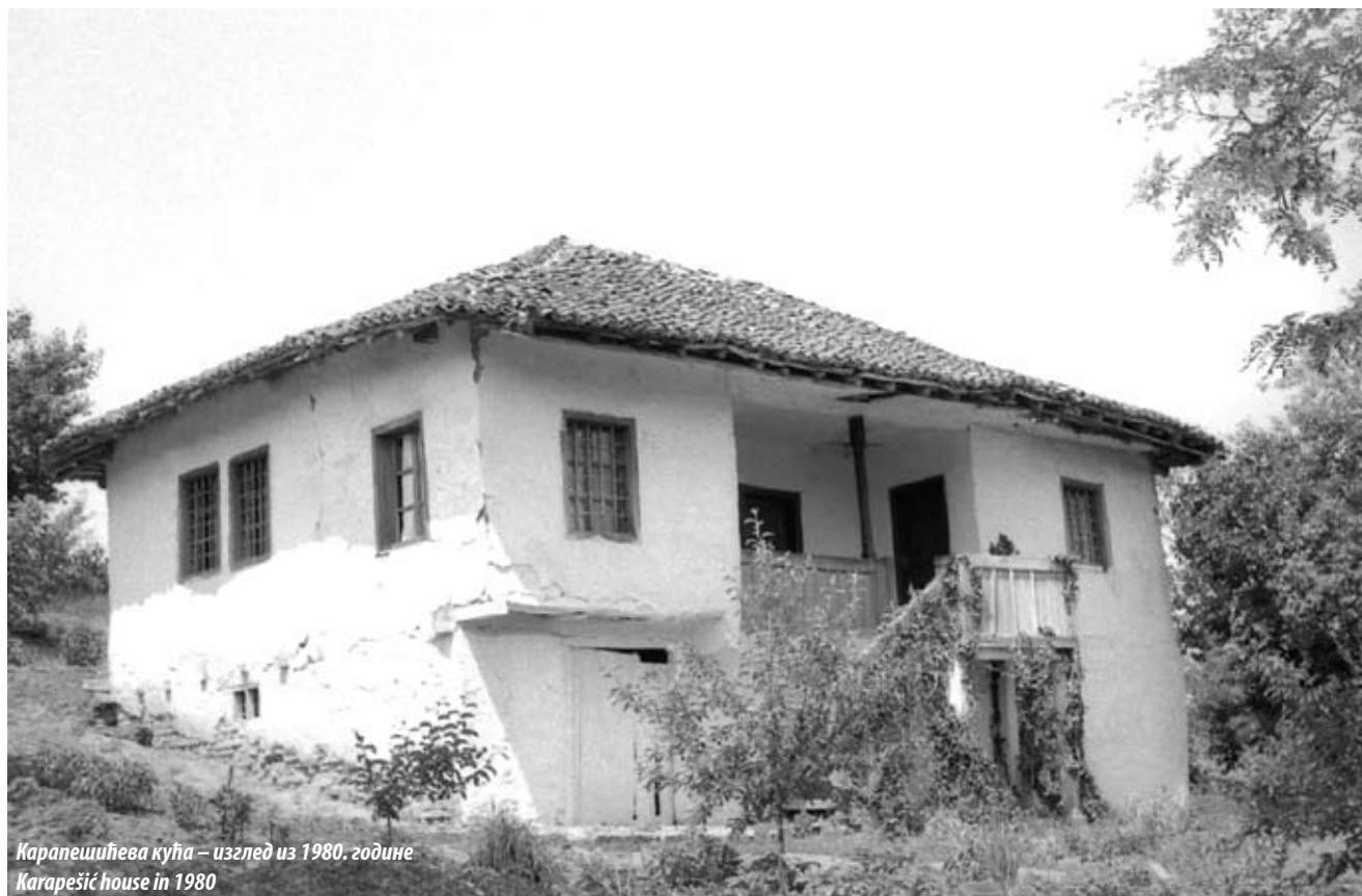
Карпешићева кућа – изглед из 1980. године Karpešić house in 1980

Гроцка доживљава интензивнији развој као трговачки и привредни центар области после 1815. године, након повратка становништва из бежаније и стабиловања политичких прилика у Србији, о чему сведочи пораст броја домова током прве половине деветнаестог века.