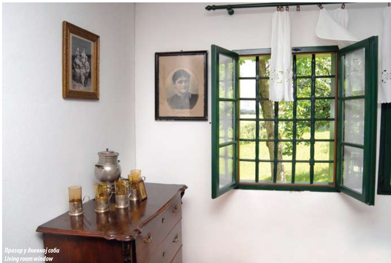
Прозор у дневној соби Living room window

(Живко Мијаиловић, Голуб Петровић, Милутин Гарашанин), који представљају носиоце привредног и политичког живота. У трговачком и занатлијском сталежу у првим деценијама 19. века присутнија су имена грчког, односно цинцарског порекла, да би након тридесетих година број српских имена био већи.