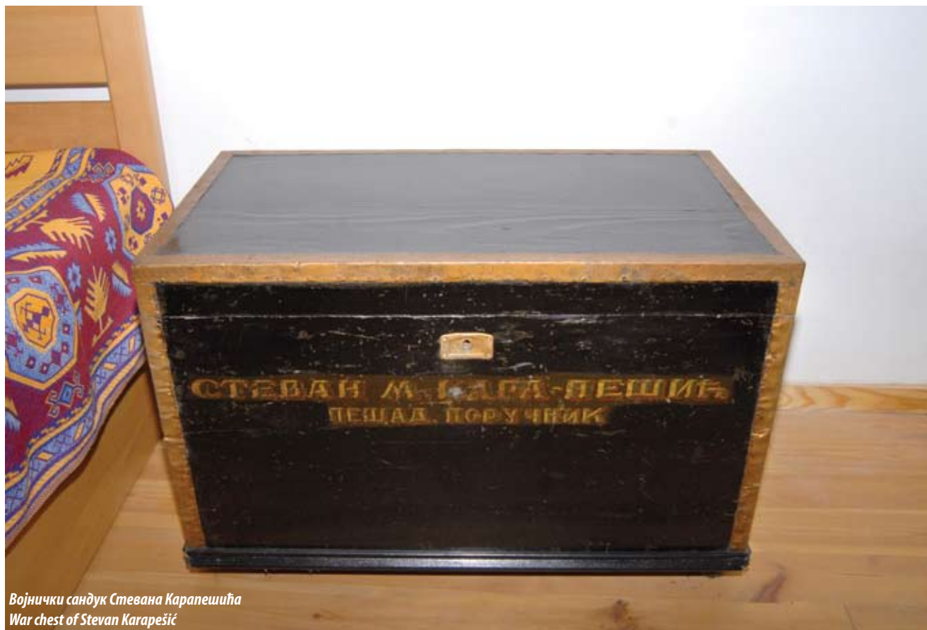
Војнички сандук Стевана Карпеша War chest of Stevan Karapešić

Grocka saw a faster pace of development as a market and economic centre of the area after 1815, when the political situation in Serbia stabilised and refugees returned to their homes, which is evidenced by an increase in the number of households in the first half of the 19th century.