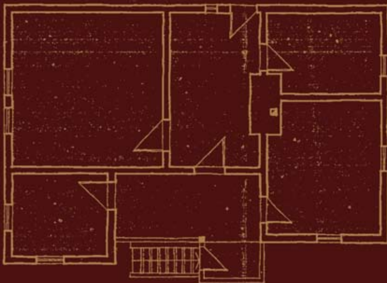
Основа приземља Floor plan