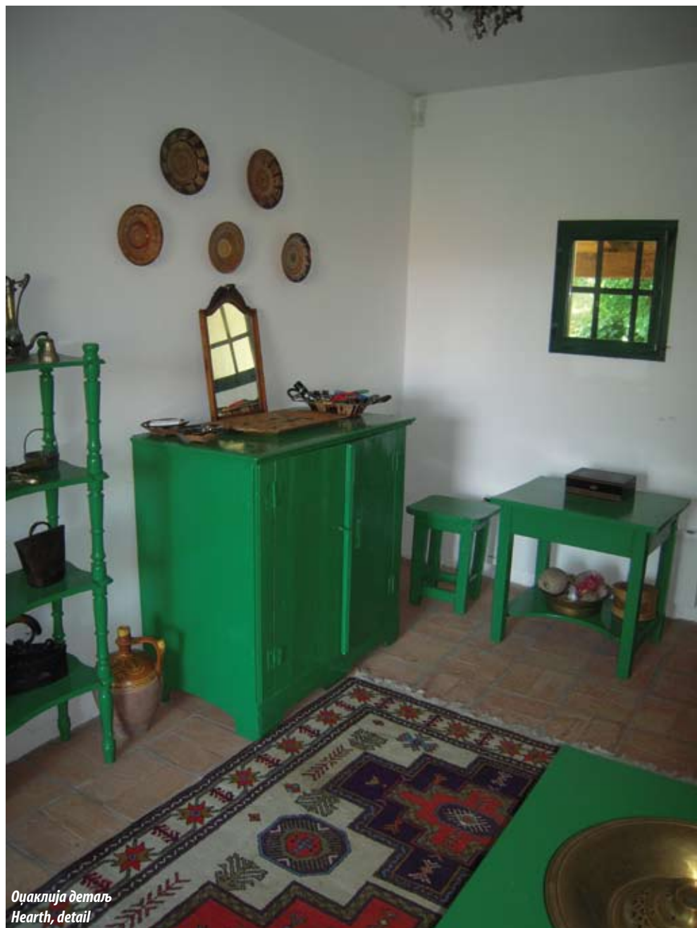
Оцаклија детаљ Hearth, detail

The house of the Karapešić family surrounded by a yard at 9 Zlatiborska Street has a recessed front porch, four rooms and the "house" (kuća) – the room with a hearth. The timber frame is filled in with wattle and adobe, and the walls are finished with earth plaster. Since the house sits on a slope, its front part rests on a brick-built cellar. The timber ceiling beams are filled in with rolls of sticks wrapped in