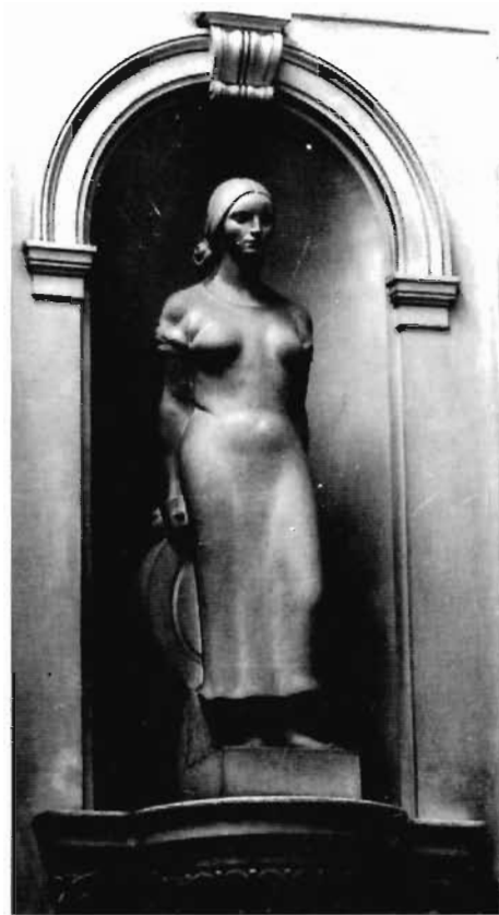
Сл. 2. „Индустирија”, рад Франца Горшеа, 1937. година