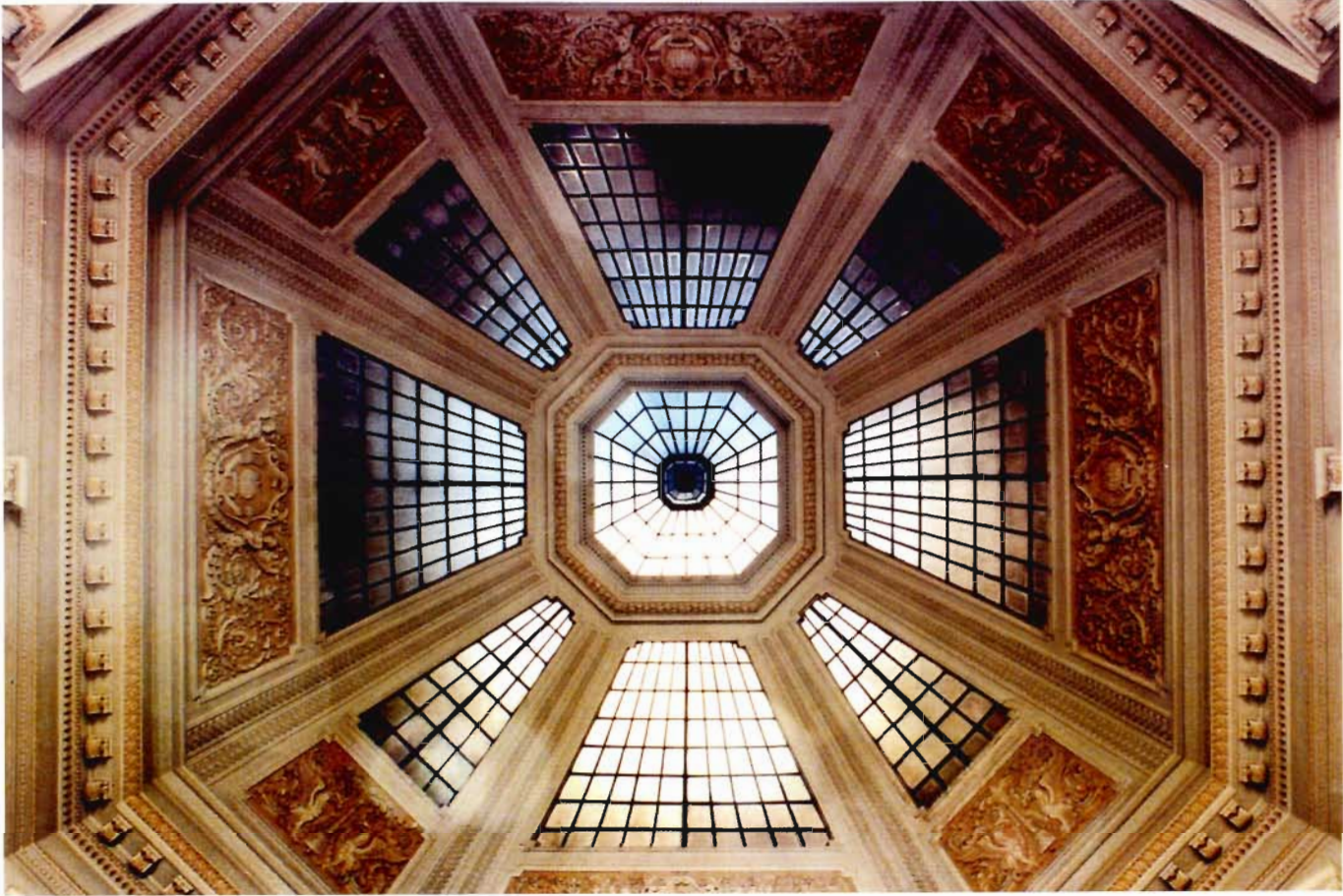
Сл. 14. Свештарник над вешћибилном