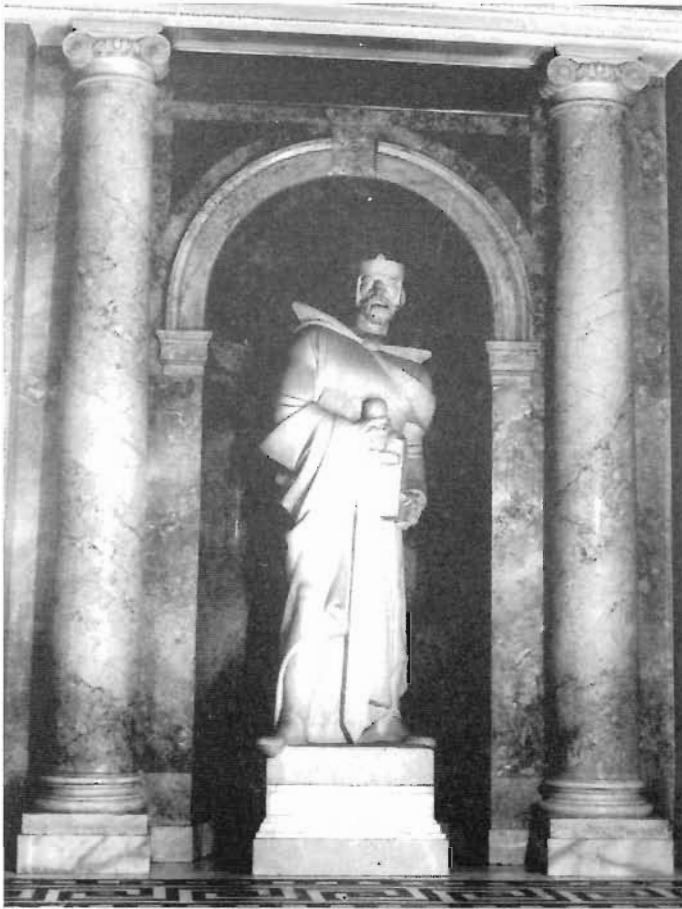
Сл. 5. Краљ Томислав, рад Вање Радауши, 1937. година