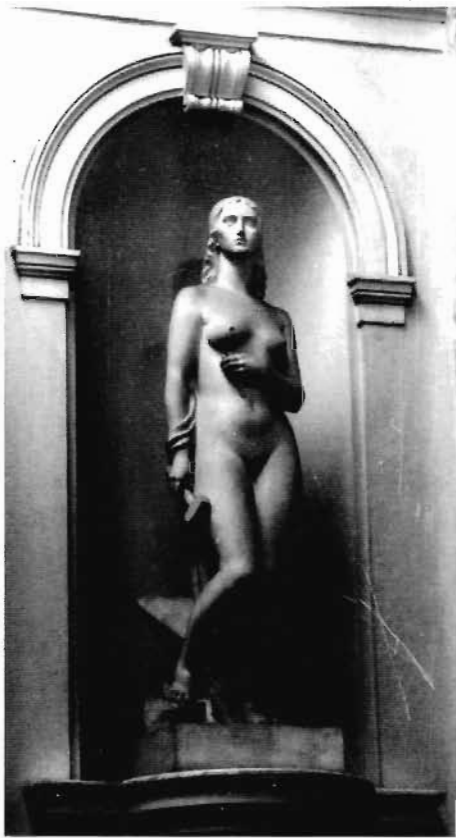
Сл. 1. „Занай”, рад Пејтра Паваличића, 1937. година