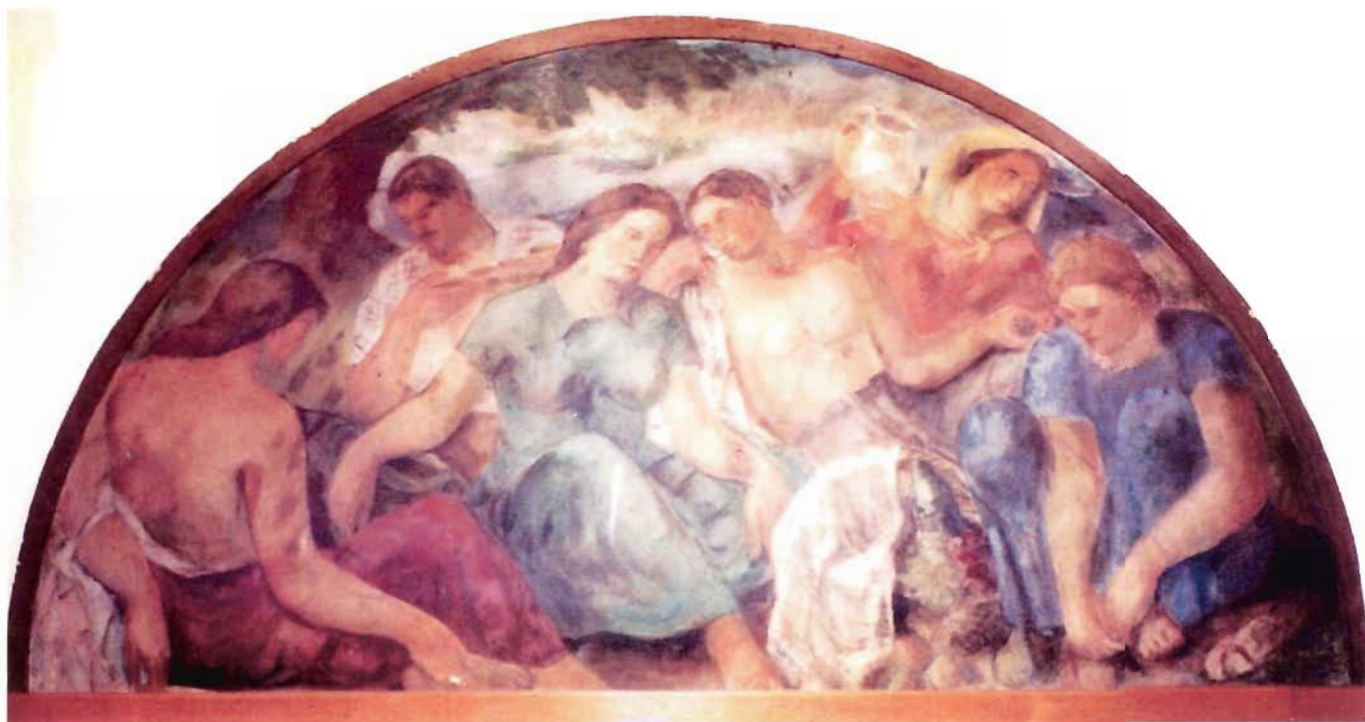
Сл. 12. „Гозба”, фреска, рад Рајки Слајнерика, 1937. године