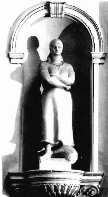
Сл. 3. „Земљорадња”, рад Борђа Јовановића, 1926. година