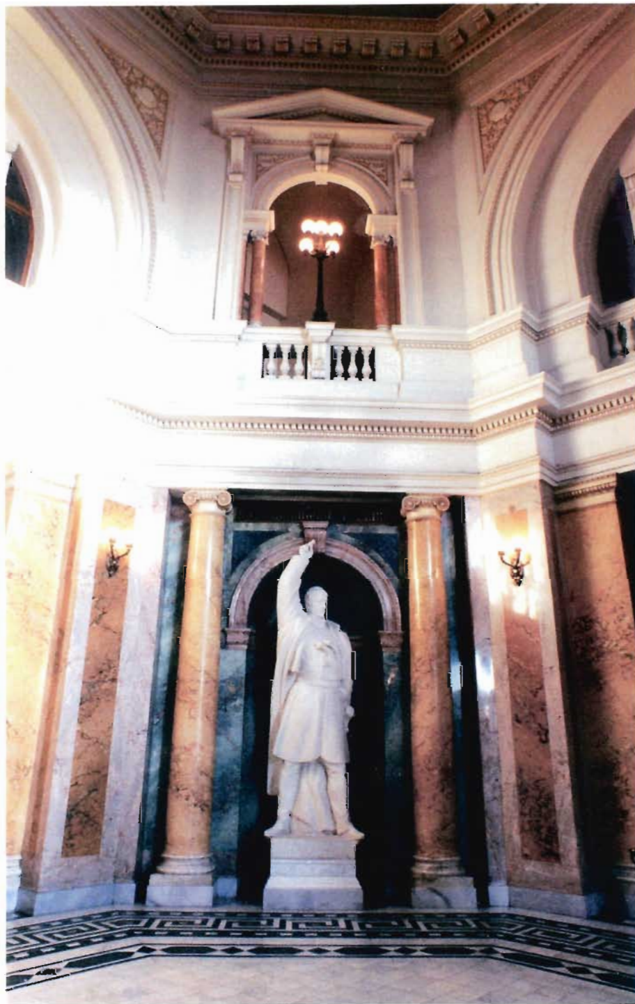
Сл. 8. „Карађорђе”, скулптура у вестибилу, рад Франи Кршишића, 1938. године

У првом плану, овде треба тражити историјску вредност заједничког остварења уметника новостворене државе Срба, Хрвата и Словенаца, уз равноправно учешће и изванредан патронат руске уметничке емиграције. Такође, овде се први пут материјализује синтеза рада различитих уметника, уметничких школа и правца, остварених кроз одређено јединствено сликарства, вајарства, примењене уметности и архитектуре. Посебна вредност садржана је у бројним манифестацијама које су најавиле и пропратиле украшавање првог заједничког парламента новостворене државе као израза жеља у дужем историјском процесу. Бројни су били предлози, сугестије, савети и понуде решења за украшавање неких просторија, улаза,