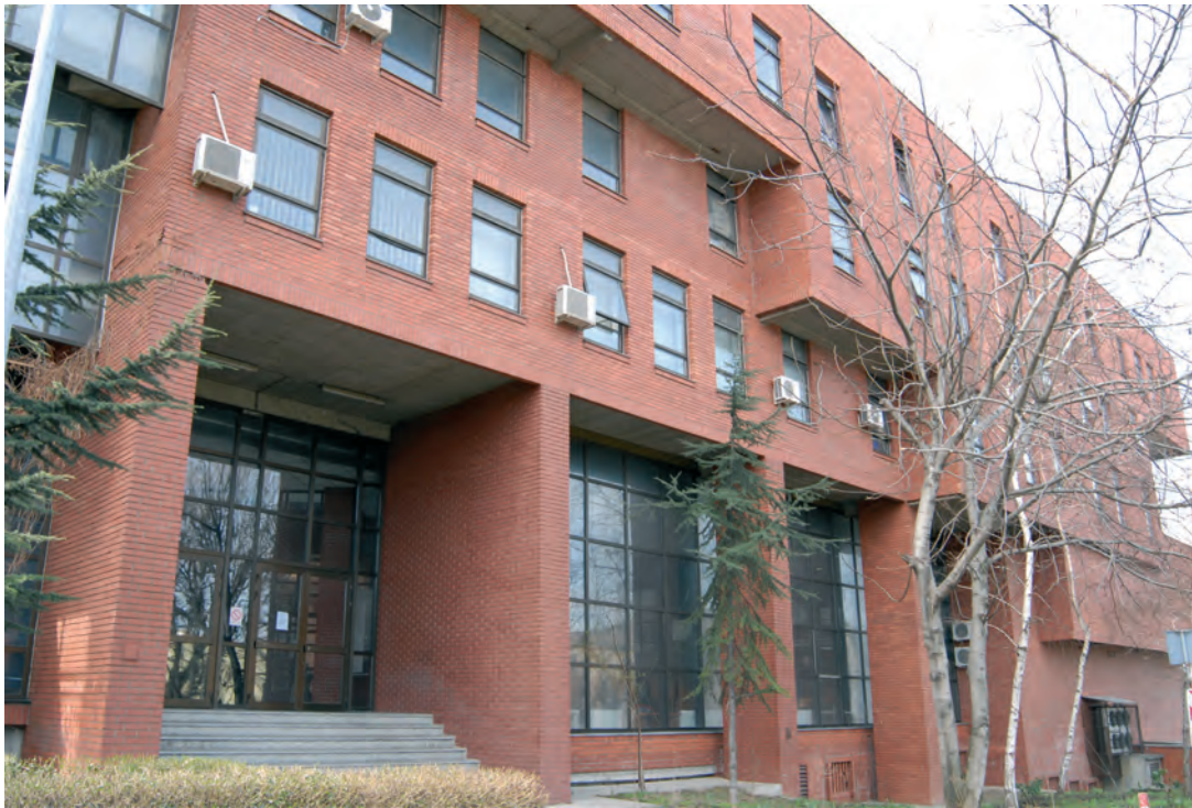
Сл. 5. Нова зграда Богословског факултета, 2013.

Александар Дероко је 1926. године као стипендиста француске владе отишао у Париз. Тамо је слушао предавања код Габријела Мијеа, великог познаваоца балканске средњовековне баштине. У Паризу је Дероко имао прилике да се упозна са снажним одјецима изложбе из 1925. године. Ар деко је одзвањао Европом и већина тзв. модерниста правила је мањи или већи заокрет у овај заводљиви стил. Дероко и други наши архитекти природно су пратили постављене трендове. 5