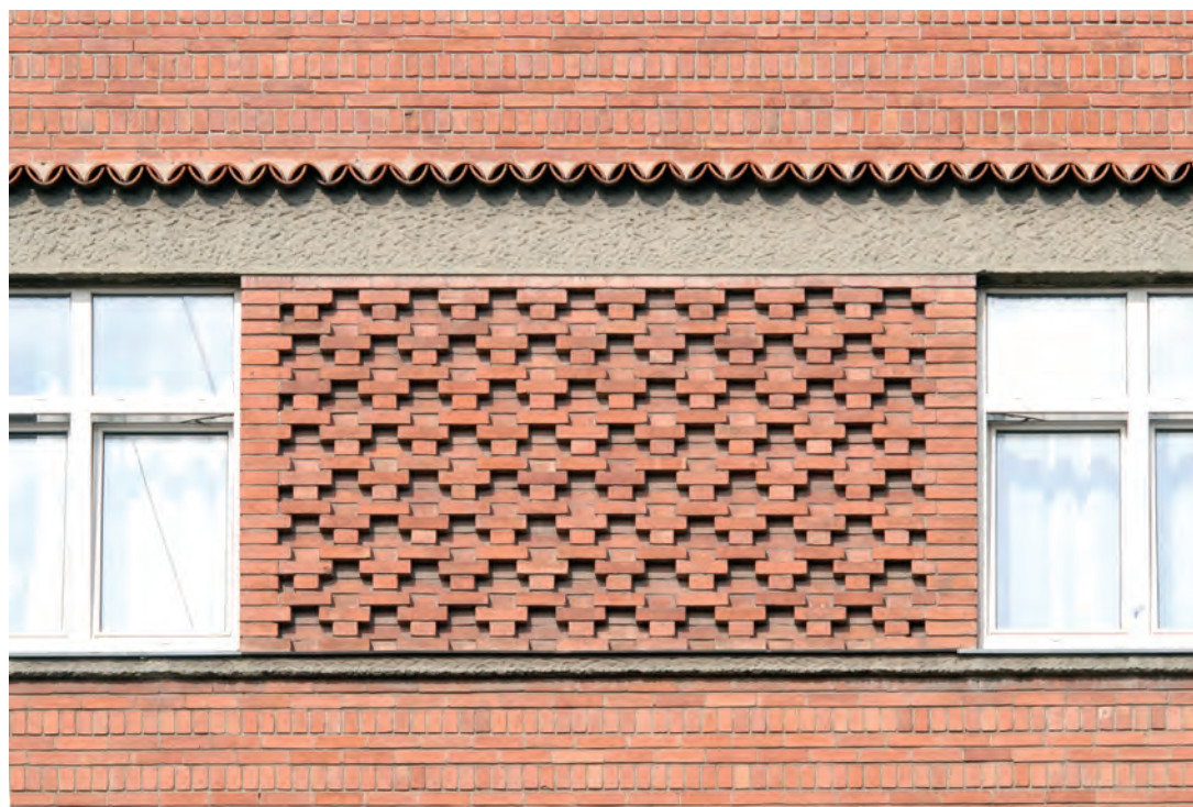
Сл. 3. Детаљ фасаде, крстићи између прозора, 2013.

достигнућа и установљене ликовне изразе. Међутим, декор, као главна одлика овог стила, био је на сасвим супротној страни од пре свега функционалистичких захтева модерних архитектонских ставова. Он се појавио као израз исконске потребе човека за лепим, и то лепим које се лако препознаје, које је пријемчиво за најшире друштвене слојеве, а не само за интелектуалну елиту времена. Ар деко се ослањао како на традицију тако и на нов дух 20. века, удобно се сместивши у постојећи, конзервативни али и авангардни архитектонски миље.