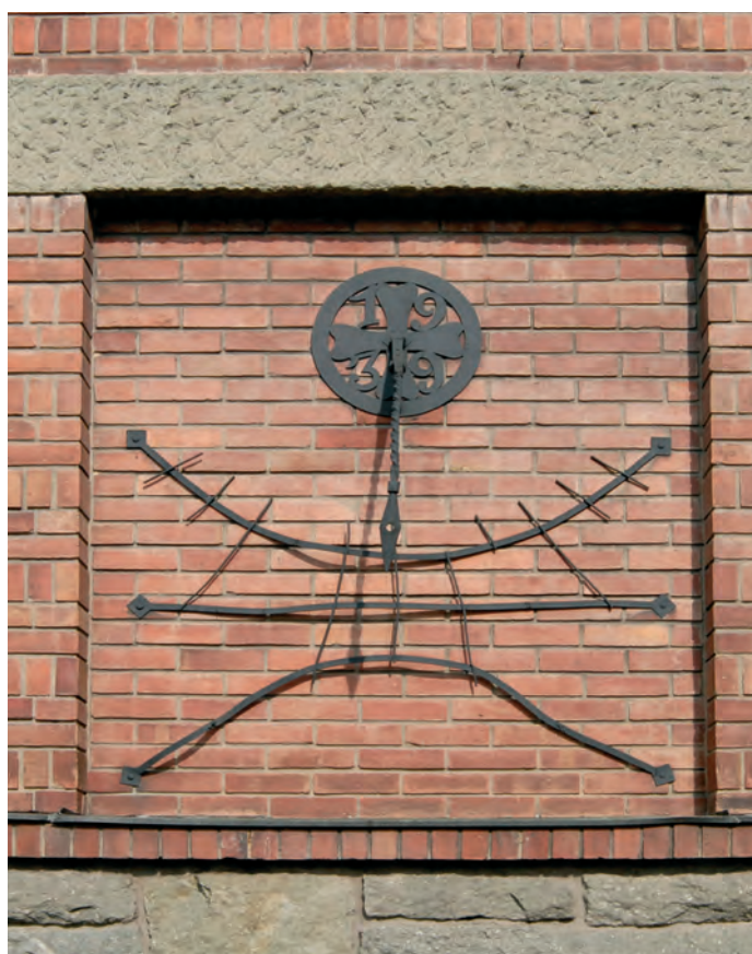
Сл. 4. Детаљ фасаде, сунчани сајл, 2013.

Европски архитекти ар декоа инспирацију за своја дела тражили су у египатској архитектури и уметности, грчко-римској митологији и традицији, архитектури средњовековља, али и модерној технологији. Они су пирамидалним мотивима, слободној скулптури, рељефима и рељефним фризовима фигуралног карактера и непогрешиво античког порекла, давали нову форму и нов просторни контекст, и тако их учинили непогрешиво модернима. Кружни, тзв. бродски прозори, полихромни третмани равних површина, лучно завршени балкони, вертикални акценти, призматични елементи, дијамант квадери, цикцак мотиви, као и снажни светло-тамни контрасти, били су углавном лишени сваког функционалног аспекта и примењени с једним циљем – да створе лепу, или можда пре, заводљиву архитектуру. Они су рефлектовали достигнућа модерног доба, његову брзину, драматичност и модерност.