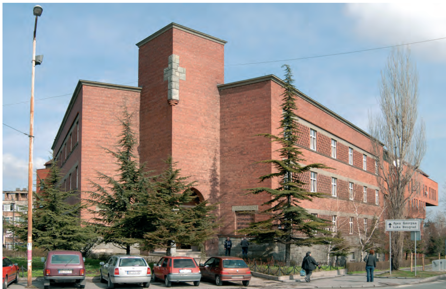
Сл. 1. Интернај студенаја Православної бојословској факултетија, ојшији изглед, 2013.