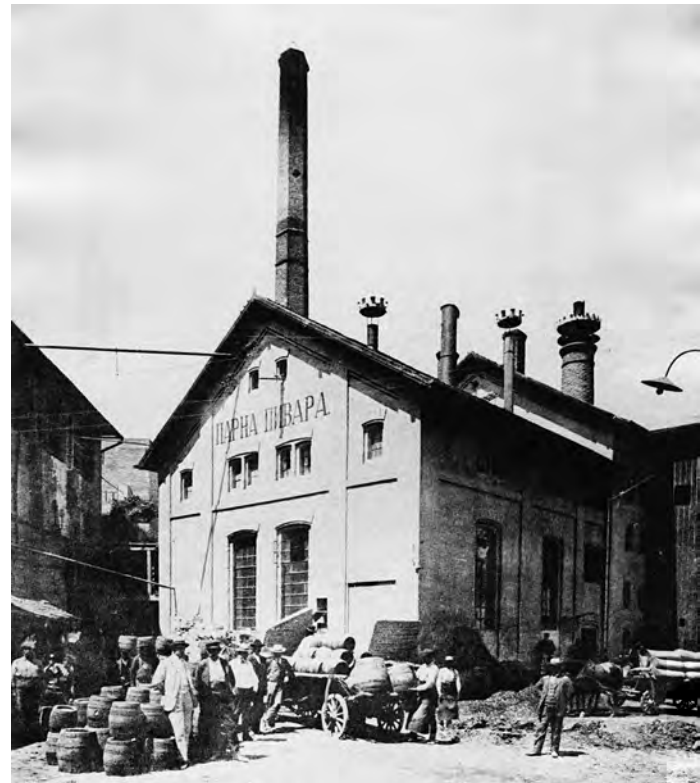
Сл. 4. Мала пивара крајем XIX века