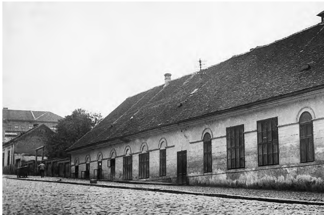
Сл. 2. Кнежева пивара почетком XX века