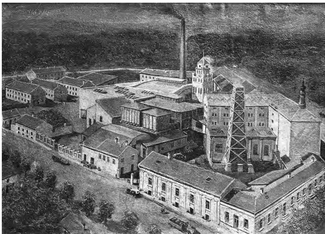
Сл. 5. Мала пивара почетком 20-их година XX века