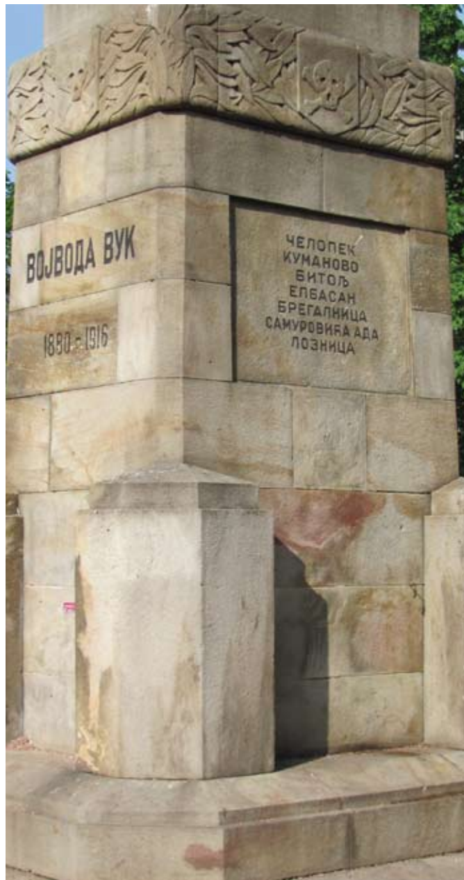
Постоље споменика војводи Вуку – изглед са истока Pedestal, view from the east

Тако је „страшни“, неустрашиви и вољени војвода Вук приказан као командант народне војске, али и саборац, који одећом и оружјем истовремено персонификује и све оне које је предводио. Овим спомеником прослављена је идеја о Ослободиоцу српских земаља, али и ратнику као врхунском