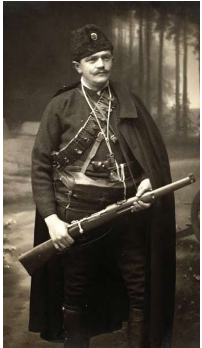
Војин Поповић – војвода Вук / Vojin Popović aka Vojvoda Vuk

После његове сахране у Београду, никле су и прве идеје о подизању споменика овом јунаку, с предлозима за локацију споменика 1930. године, према Одлуци Комисије за споменике. На предлог председника Београдске општине, Градско веће је одлучило да се за подизање споменика војводи Вуку у Београду уступи место у малом