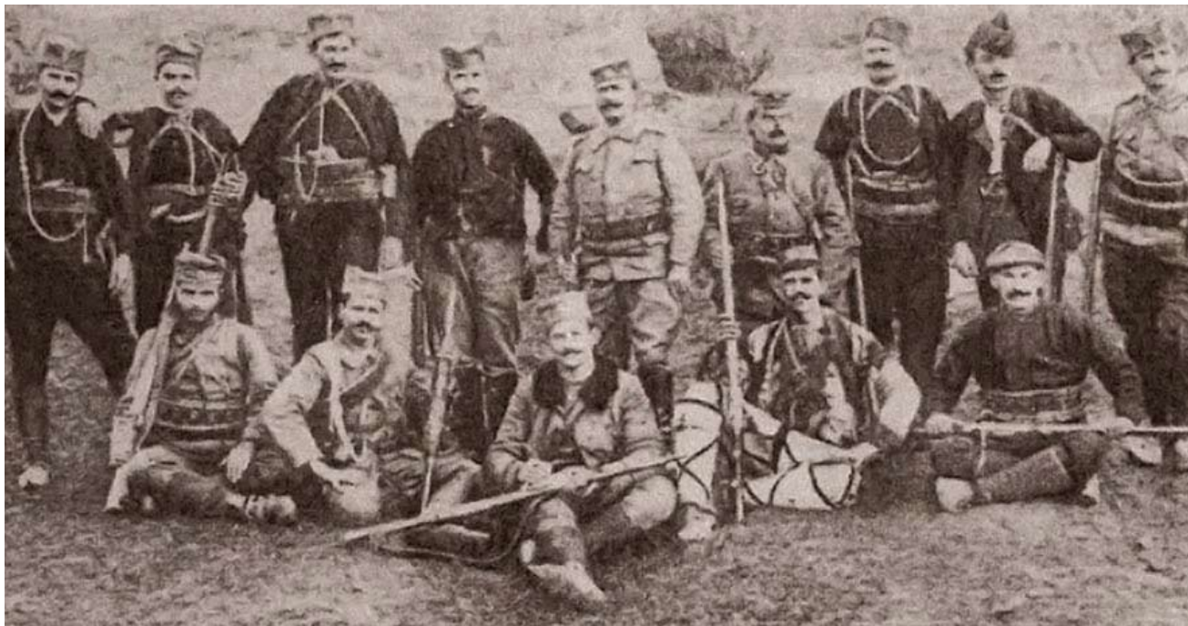
Војвода Вук са својим четницима / Vojvoda Vuk with his chetniks

узору. У визуализацији лик није идеализован, већ је моделован према аутентичном изгледу, чак је приказан као нешто старији човек, иако је ранама подлегао у 36. години. Један од меморијала ослободилачким ратовима Србије и свима који су учествовали у Првом светском рату, постављен је у центру тадашње престонице Краљевине Југославије.