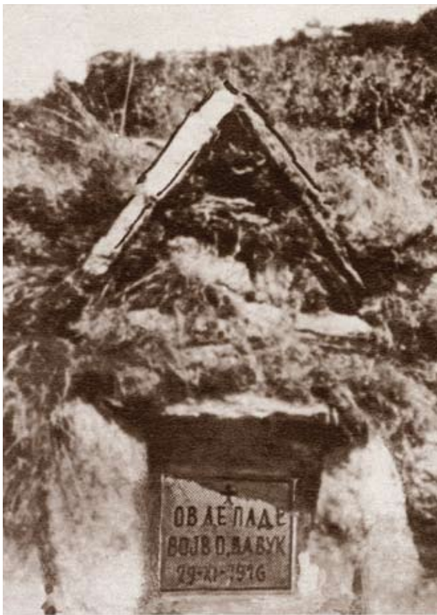
Место погибје војводе Вука на Груништу Site of Vojvoda Vuk's death at Grunište

The Memorial to Vojvoda Vuk was designated a cultural heritage property in 2014.