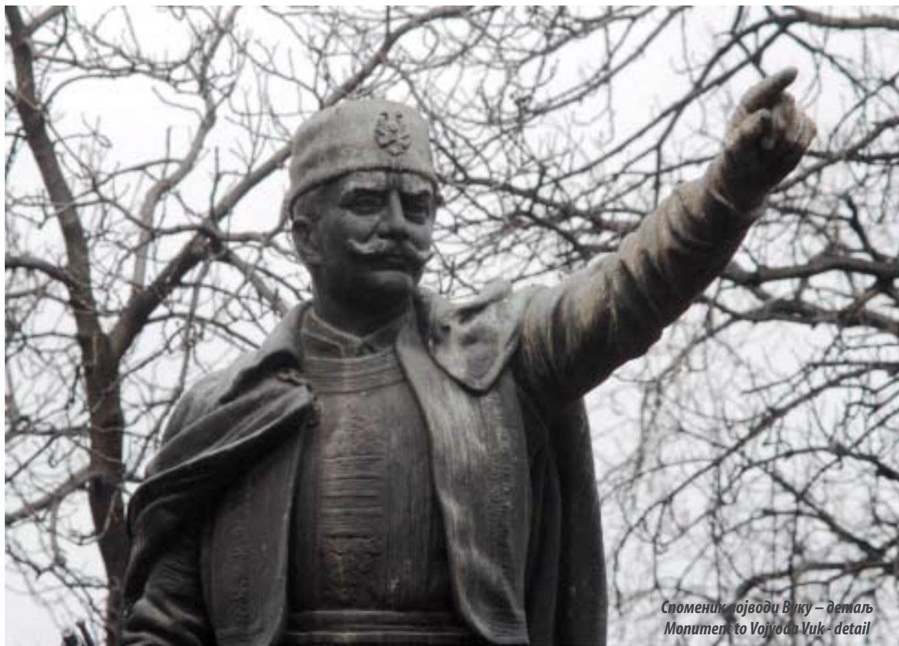
Споменик војводи Вуку – детаљ Monument to Vojvoda Vuk - detail