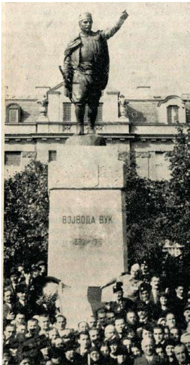
Откривање споменика војводи Вуку у парку на Топличином венцу Unveiling of the memorial to Vojvoda Vuk in the park in Topličin Venac