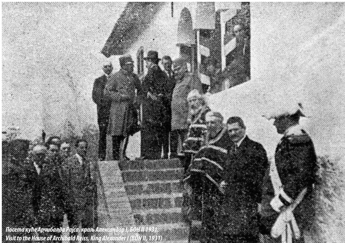
Посета куће Арчибалда Рајса, краљ Александар I, БОИ II 1931. Visit to the House of Archibald Reiss, King Alexander I (BON II, 1931)

Dr Reiss withdrew from public life deeply disappointed by some political practices in Serbia, so much so that, some contemporaries claimed, his health failed. He died on 8 August 1929. The funeral procession stopped at his house to listen to a speech and then proceeded to Topčider Cemetery. Dr Reiss gave instructions in his will for his body to be buried in Belgrade, but for his heart to be put in a jar and taken to the Memorial Chapel on Kajmakčalan to join the bones of the men he had watched die around him during the breakthrough operations on the Salonika Front. His testamentary wish was carried out, but during the Second World War the urn was damaged and the heart is believed to have been displaced by Bulgarian fascists.