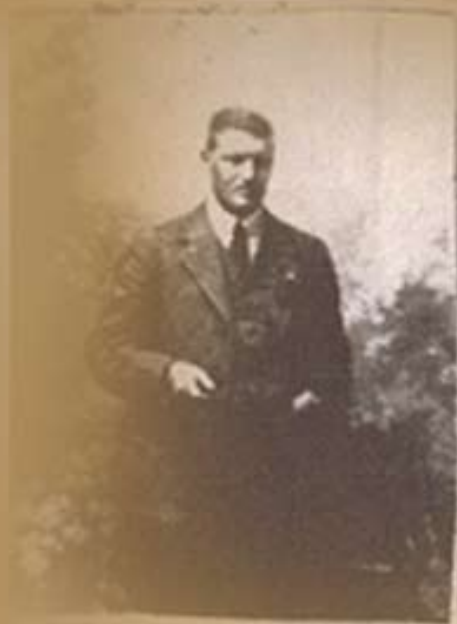
1918. g. - Vojna fotografija