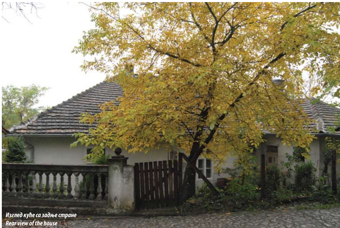
Изглед куће са задње стране Rear view of the house

Поред тога аутор је бројних стручних радова, као и ратних и политичких публикација. Пред крај живота, 1928. године, објавио је свој ратни дневник под насловом Шта сам видео и проживео у великим данима.