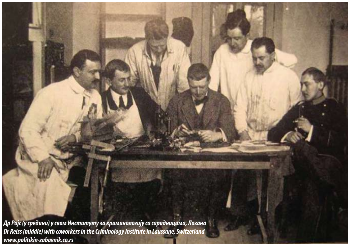
Др Рајс (у средини) у свом Институту за криминологију са сарадницима, Лозана Dr Reiss (middle) with coworkers in the Criminology Institute in Lausanne, Switzerland

На путу за Топчидер код Цареве Ђуприје у Београду налази се кућа Рудолфа Арчибалда Рајса (Лозана, 1876 – Београд, 1929), швајцарског доктора хемије, форензичара и професора криминалистике Универзитета у Лозани, истовремено аутора бројних радова и књига из области судске медицине и кривичног права. У српској историји познат је као криминолог који се бавио истраживањем злочина над српским цивилним становништвом током Првог светског рата.