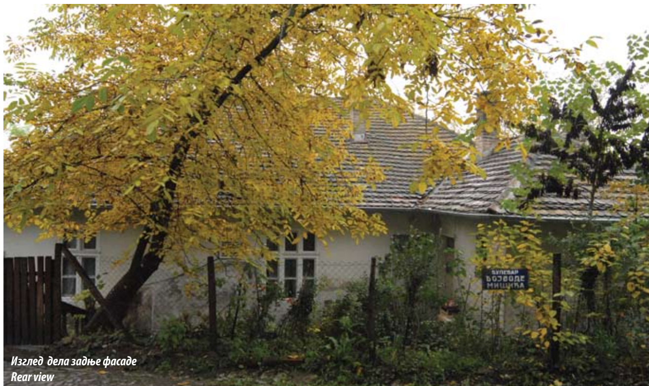
Изглед дела задње фасаде Rear view

in memory of the Battle of Dobro Pole which marked the decisive breakthrough on the Salonika Front. The area around the house is popularly known as “Reiss’s Slope”.