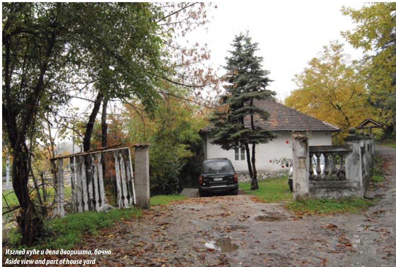
Изглед куће и дела дворишта, бочно Aside view and part of house yard

The House of Dr Archibald Reiss ((Hausach, German Empire, 1875 – Belgrade 1929), a German-born Swiss doctor in chemistry, forensic scientist and professor of criminology at the University of Lausanne, author of many books and studies on forensic photography, pathology and criminal law, is situated near Careva Ćuprija on the way from downtown Belgrade to Topčider. Dr Reiss is known in Serbian history as the criminologist who investigated the crimes committed against Serbian civilian population during the First World War.