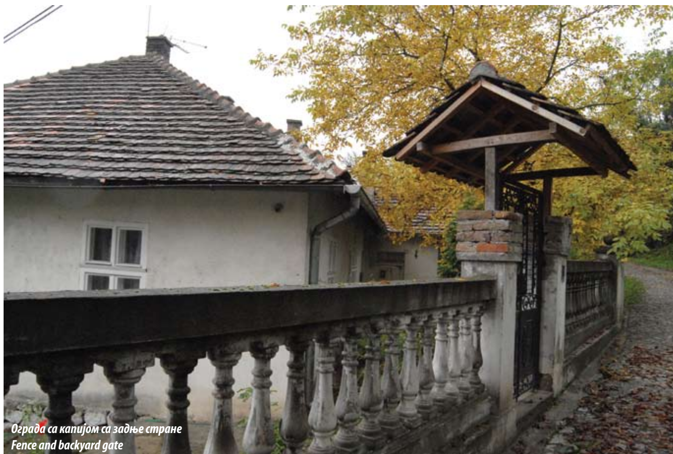
Ограда са капијом са задње стране Fence and backyard gate

време моћна Аустроугарска је уз помоћ Ватикана и бугарске штампе ширила неистине о Србима, представљајући их као дивљаке и убице. Након својих истраживања дошао је до супротног закључка, да су се Срби борили часно уз поштовање хуманитарног права и уважавање међународних конвенција о поступању с ратним заробљеницима. Објављивао је репортаже с ратишта у швајцарским, француским и холандским листовима и с временом постао одани пријатељ српског народа. У Нишу се 1915. године пријавио за добровољца и заједно са српском војском одступио преко Албаније до Крфа. За време Првог светског рата написао је око 800 чланака о Србима. После пробоја Солунског фронта вратио се у Србију, где је остао до краја живота. По примирју послат је у Париз на мировну конференцију као делегат. У послератним годинама документовано је обелоданио