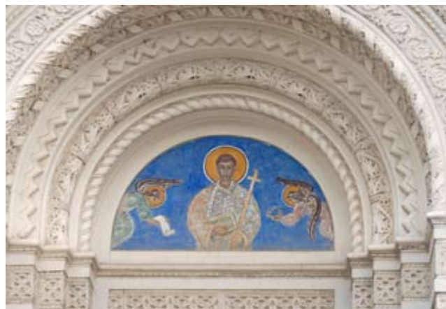
Лунета главног портала цркве / Main entrance