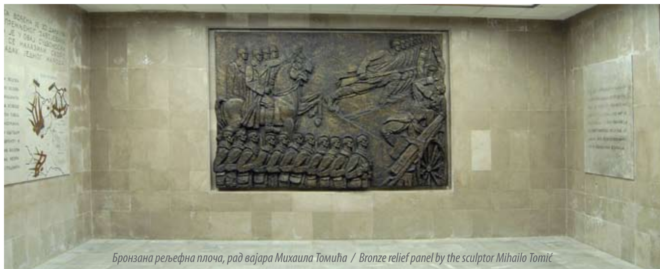
Бронзана рељефна плоча, рад вајара Михаила Томића / Bronze relief panel by the sculptor Mihailo Tomić

Mentioning and remembering with honour all those who gave their all to Serbia in the First World War is hardly enough. Expressed as a percent of the total population, Serbia suffered the greatest losses of all nations that took part in the First World War. 1 The war came suddenly, and not quite in keeping with diplomatic protocols. Austria-Hungary declared war on 28 July 1914 in the form of an ordinary telegram sent to Belgrade, although it was known that the Serbian government was in Niš. They say the telegram was delivered to Prime Minister Nikola Pašić while he was having lunch in a Niš restaurant. Having read it, he rose from the table and said: Austria-Hungary has declared war on us. Our cause is a just one. God will help us. 2