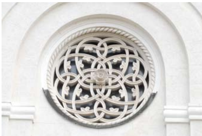
Розета - детаљ на фасади / Rose window