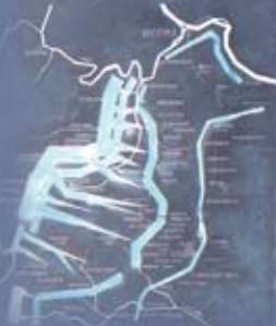
УВОДНА И ОДБРАМБЕНА ФАЗА

ОДРАЖАЈУЋИ УПАДУ СИЛОВИТОГ ЗАВОЈЕВАЧА ПОСЛЕ НАПУШТАЊА ПОГРАНИЧНИХ ОБЛАСТИ И ПРЕСТОНОГ БЕОГРАДА, СРПСКА ВОЈСКА ЈЕ ЧВРСТО ЗАПОСЕЛА ЛИНИЈУ: ВАРОВНИЦА - КОСМАЈ - СЖЕНИЦА - БЕЖАНЕ - МЕДВЕДЈАК - ВАГАН - БЕЛАНОВИЦА - НАКУЧАНИ - ДРЕНОВА - СРЕЗОЈЕВЦИ - КИТА - КАБААР - ОБЧАР - МАРКОВИЦА.