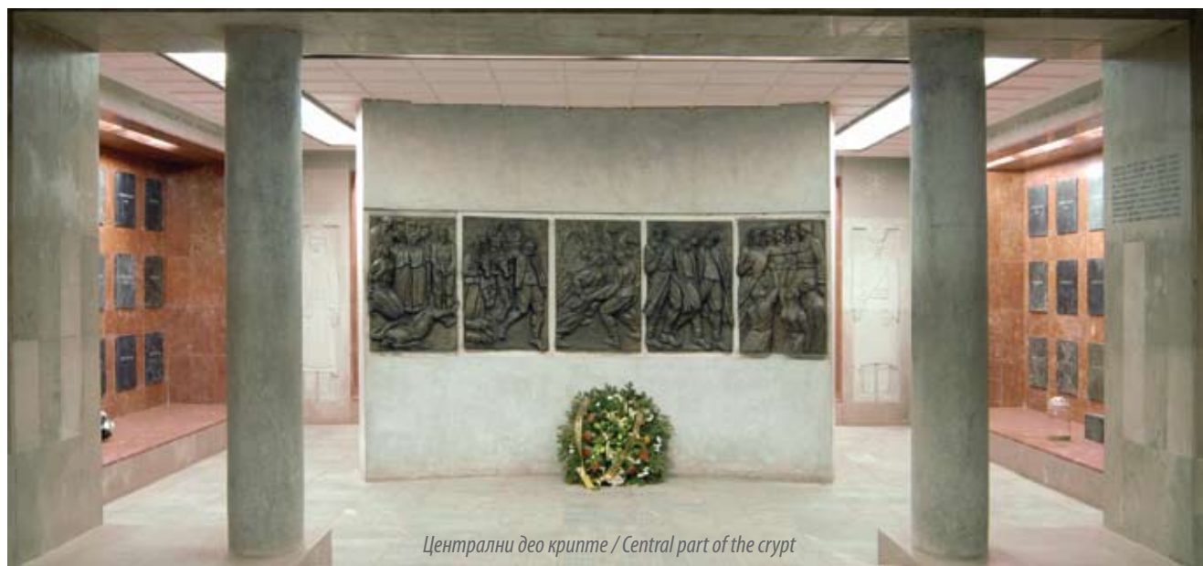
Централни део крипте / Central part of the crypt

Досије споменика културе Спомен-црква у Лазаревцу , Документација ЗЗСКГБ