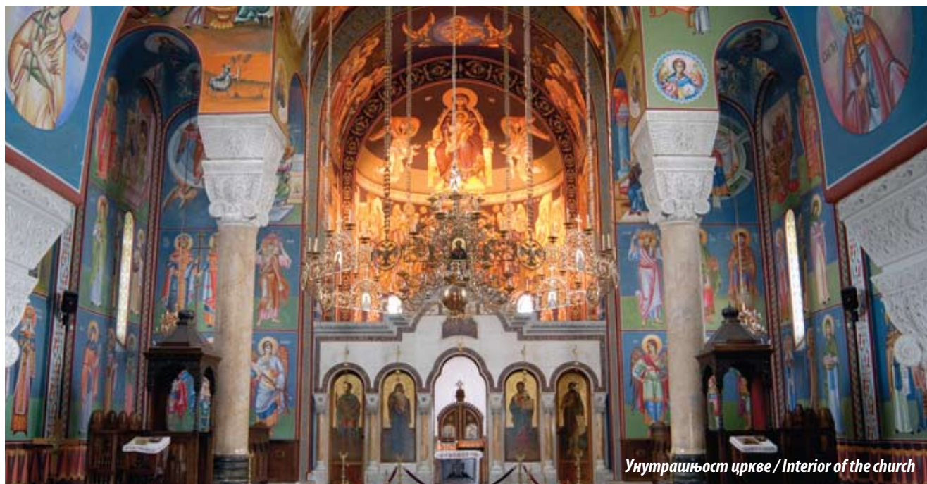
Унутрашњост цркве / Interior of the church

Мало је поменути и с поштовањем се сетити страдалника које је Србија имала у Првом светском рату. У односу на укупан број популације, по проценту страдалих, Србија је поднела највеће жртве од свих земаља учесника у Првом светском рату. 1 Рат је у Србију дошао изненада, чак и како не приличи дипломатској пракси. Аустроугарска власт је 28. јула 1914. године објаву рата послала обичним, отвореним телеграмом у Београд, иако се знало да се српска влада налази у Нишу. Кажу да је телеграм уручен председнику српске владе Николи Пашићу, док је ручао у једној нишкој кафани. Прочитавши га, устао је од стола и рекао: Аустроја нам је објавила рат. Наша ствар је праведна. Бог ће нам помоћи. 2