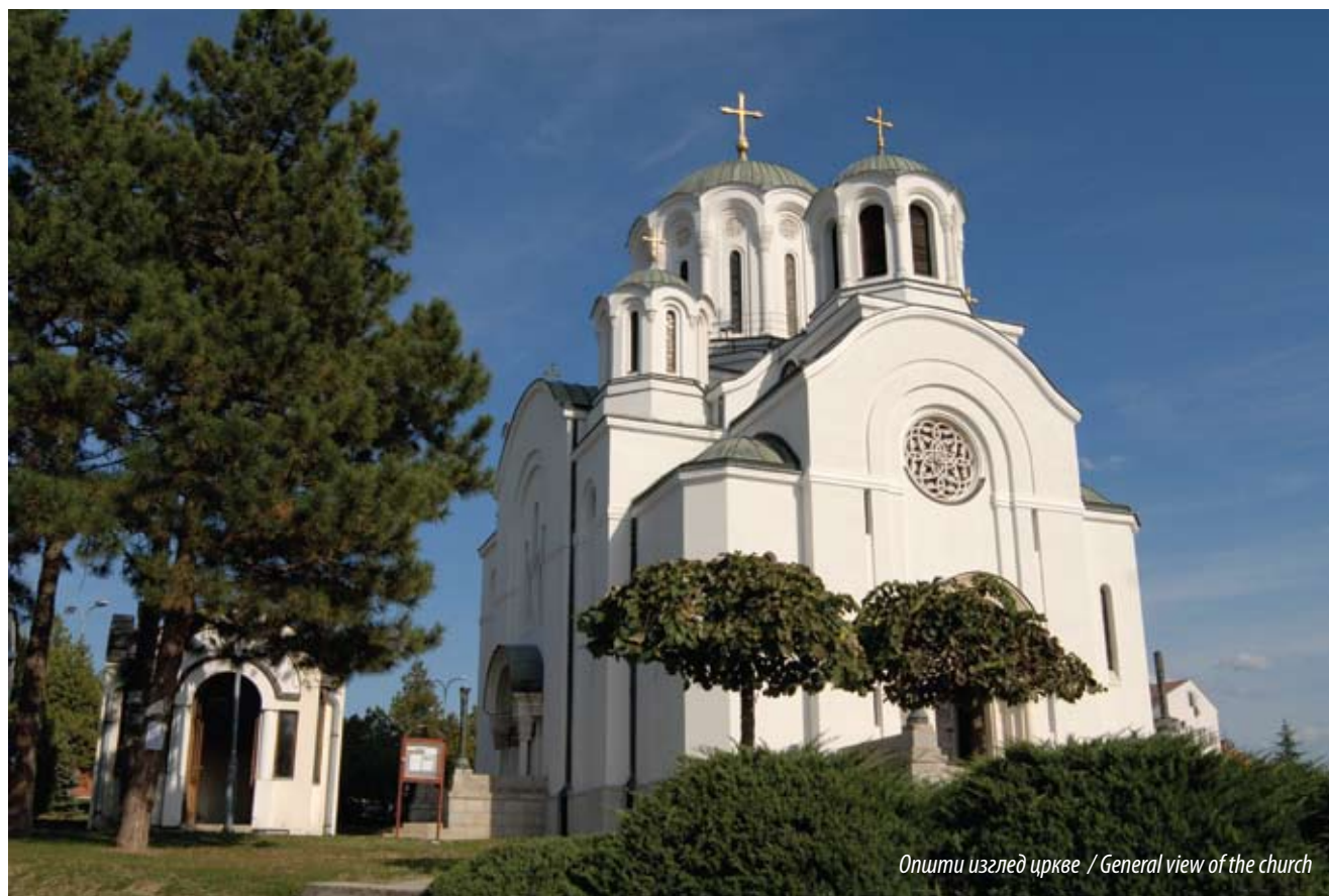
Opшти izgled crkve / General view of the church

4 Aleksandar Kadijević, "Rad arhitekta Ivana Afanasjeviča Rika u Jugoslaviji između dva svetska rata", Saopštenja RZZZSK XXX–XXXI (Belgrade 1998–99), 237.