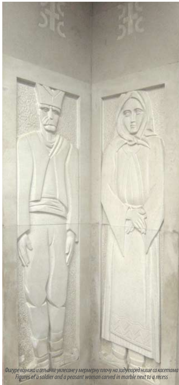
Фигуре војника и сељанке уклесане у мермерну плочу на зиду поред нише са касетама Figures of a soldier and a peasant woman carved in marble next to a recess