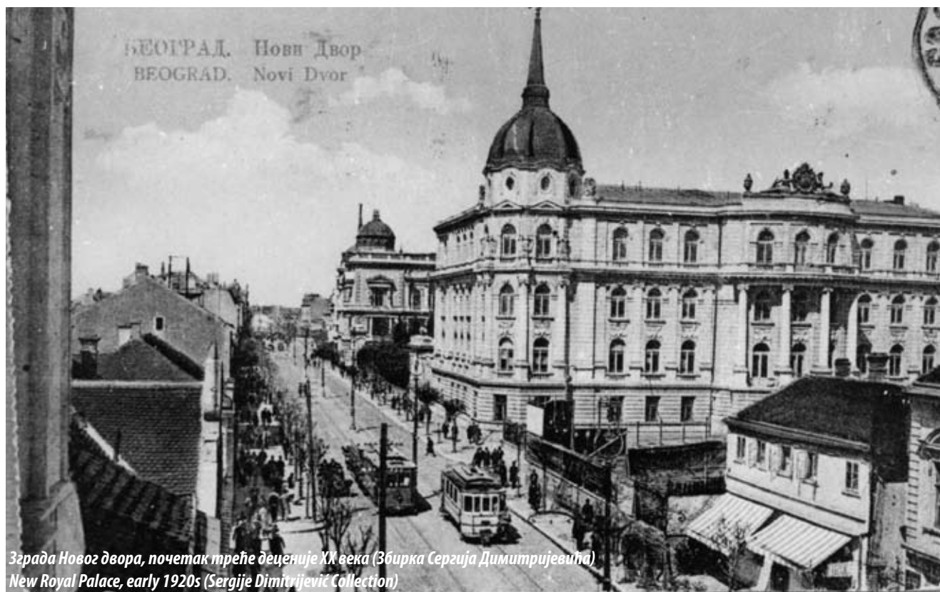
Зграда Новог двора, почетак треће деценије ХХ века New Royal Palace, early 1920s

assigned the new building to the Ministries of Foreign Affairs and the Interior.