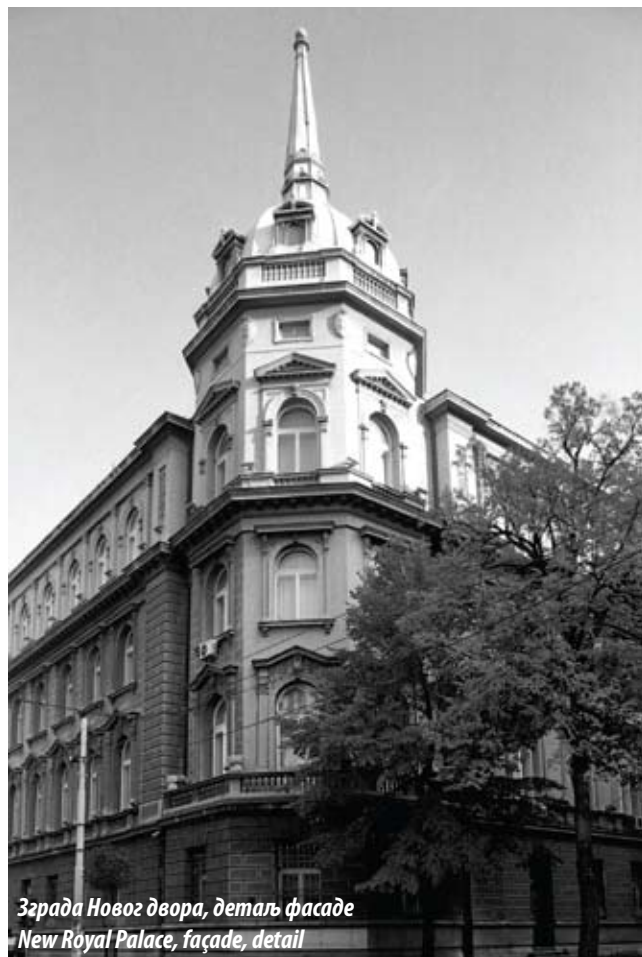
Зграда Новог двора, детаљ фасаде New Royal Palace, façade, detail

Архитектура Новог двора подражавала је идеју историјског заокруживања дворског комплекса, тако што је сама грађевина обликована као својеврсни пандан Старом двору. На тај начин истакнута је потреба да се просторно и симболички заокружи целина која конотира саму идеју државе. Двоспратно здање обликовано је у стилу академизма, са стилским елементима преузетим углавном из ренесансне и барокне архитектуре. Најрепрезентативнија фасада окренута је према врту, а угаони ризалит обликован је у виду куле с куполом, слично решењу примењеном на згради Старог двора. На тај начин остварена је складност дворског комплекса и симетрија у силуети целине. У систему рашчлањавања фасада централну композицију представљају приземље и први спрат решени као јединствена целина, сутерен је обликован рустично, док је други спрат