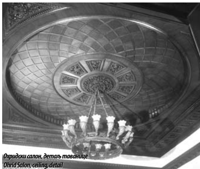
Ohридски салон, детаљ таванице Ohrid Salon, ceiling, detail

way two components of the complex were tied into a well-balanced whole exhibiting a symmetrical outline. The horizontal façade division showed a rusticated semi-basement, the ground floor and the first floor integrated into one central composition, and an independently and more unassumingly treated second floor. The articulation of the main façade was achieved by a central and two end projections, and a curved, centrally positioned entrance porch. In accordance with the purpose of the building, special attention in ornamenting the façades was paid to heraldic symbols. The semicircular pediment above the cornice of the central projecting bay contained the full armorial achievement of the royal house of Karadjordjević. The tallest and, consequently, dominant element of the New Palace – the tower capped with a dome tapering into a spire topped by a bronze eagle rising – provided the architectural link between the façades facing Kralja Milana and Andrićev venac streets. Another important heraldic composition was placed just beneath the dome of the corner tower: two identical, symmetrically placed shields with a cross between four fire-steels, i.e. an element of the coat-of-arms of the Kingdom of Serbia, which subsequently was incorporated into the coat-of-arms of the Kingdom of Yugoslavia. The central motif of the façade facing Andrićev venac was the curved projecting bay whose attic was surmounted by a monumental ornamental composition featuring the coat-of-arms in the centre.