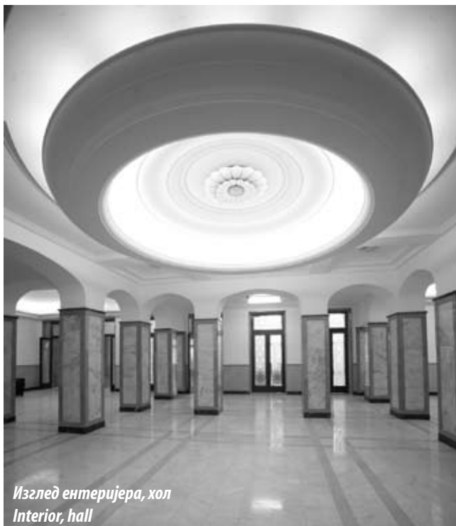
Изглед ентеријера, хол Interior, hall