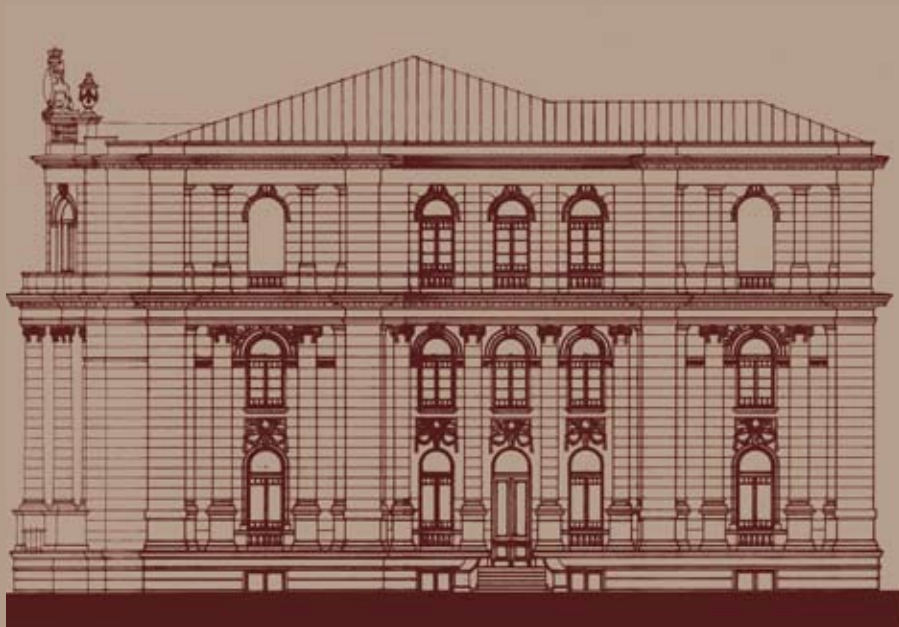
Пројекат рестаурације фасада, јужни и северни изглед Facade restoration project, south and north view