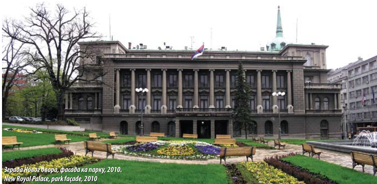
Зграда Новог двора, фасада ка парку, 2010. New Royal Palace, park façade, 2010

architect Milan Minić to accommodate the Presidency of the Government of the People's Republic of Serbia (PRS). It received an assembly hall with a vestibule, the façade opposite the Old Palace was given a completely different front dominated by a two-storey colonnade of Ionic columns, while the original frontage lines along Kralja Milana and Andrićev venac streets remained unchanged. Consistent with the alterations, a new access to the east, park-facing side of the building was provided; and the heraldic symbols were replaced with emblems symbolising the new form of government. In decorating the interior, special attention was paid to the addition, which was adorned with works of distinguished Yugoslav painters and sculptors, such as Toma Rosandić, Petar Lubarda, Milo Milunović, Milica Zorić etc.