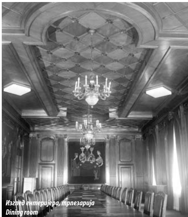
Изглед ентеријера, трпезарија Dining room