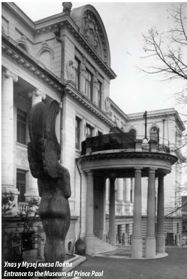
Улаз у Музеј кнеза Павла Entrance to the Museum of Prince Paul

главни архитектонски елемент који спаја фасаде према улицама Краља Милана и Андрићев венац. Поред хералдичких знамења, посебно је значајна композиција која је била постављена на сам завршетак угаоног ризалита, испод куполе, две истоветне, симетрично постављене представе штитова с крстом и четири оцила, то јест део грба Краљевине Србије и касније интегрални сегмент грба Краљевине Југославије. Централни мотив фасадне композиције према Улици Андрићев венац представља лучни ризалит над чијом се атиком налазила монументална декоративна композиција с грбом у средишту.