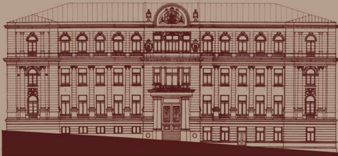
Пројекат рестаурације фасада, источни и западни изглед Facade restoration project, east and west view