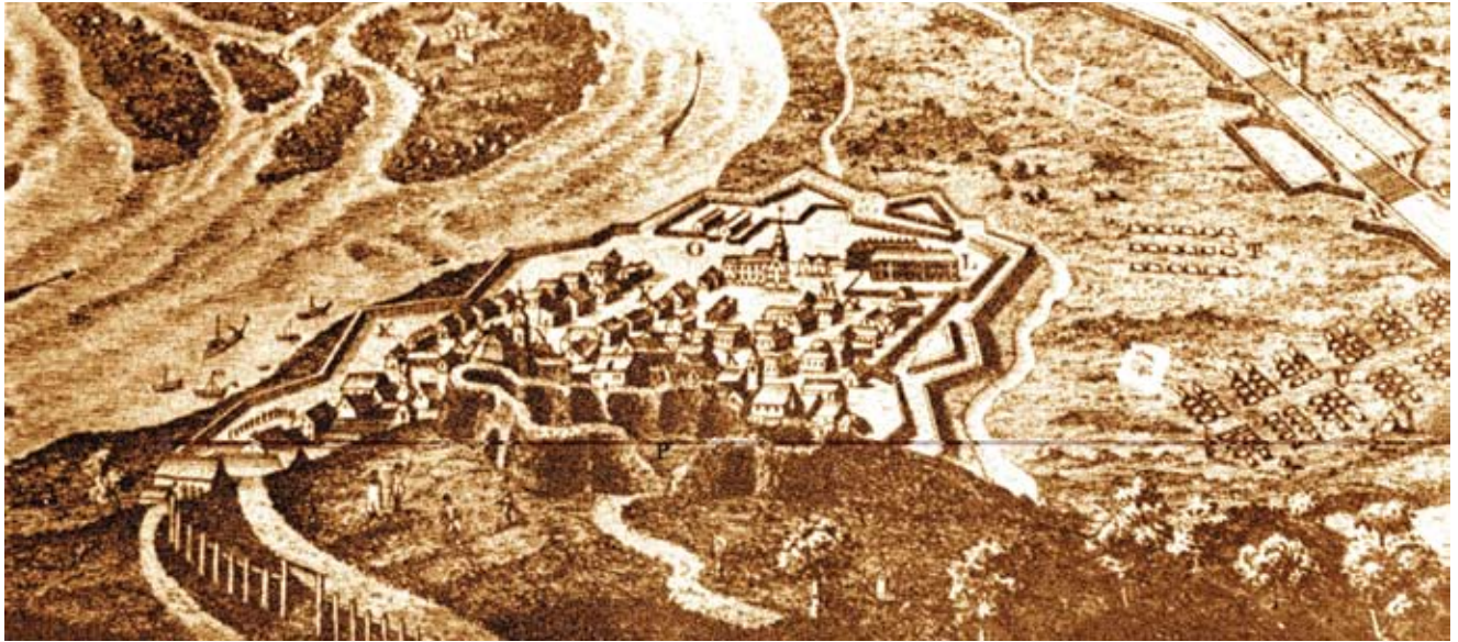
Земун 1788. Фотоснимак гравуре J. Maillart-a "Vue en perspective de Belgrade et de Semlin" Zemun in 1788, J. Maillart's engraving 'Vue en Vue en perspective de Belgrade et de Semlin', detail

град и Велико ратно острво. Исте године, на почетку Првог светског рата Миленијумски споменик је оштећен, а средином тридесетих година прошлог века обновљен.