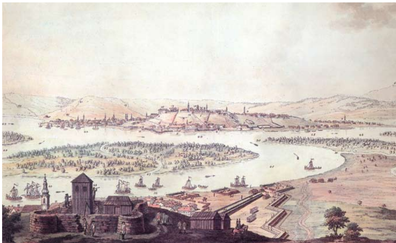
Поглед на Земун и Београд са Гардоша 1789. Фотоснимак хромолитографије инж.кпт.С.Мачини-а "Prospect der Stadt und Festung Belgrad von Semlin aus anzusehen" View of Zemun and Belgrade from Gardoš in 1789, Capt. Engr. S. Mancini's chromolithograph 'Prospect der Stadt und Festung Belgrad von Semlin aus anzusehen'

On the commanding loess plateau above the present-day Lower Town and the Danube, on the elevation called Gardoš (fortress), sit the remains of a fortification that testify to the past of the settlement and the strategic role of the site. A wide view of the surroundings, fertile soil and safety from floods were factors that encouraged human communities to settle on this site.