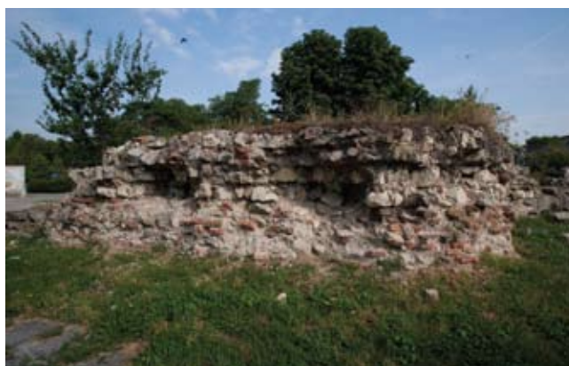
Остатци Земунске тврђаве, новембар 2013. Remains of the Zemun Fortress, November 2013th