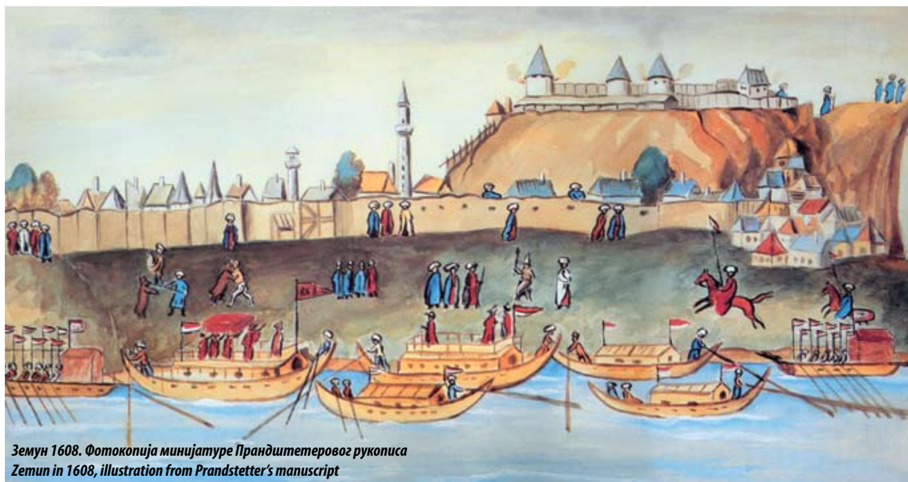
Земун 1608. Фотокопија минијатуре Прандштетеровог рукописа Zemun in 1608, illustration from Prandstetter's manuscript

На доминантној лесној заравни изнад данашњег Доњег града и Дунава, на брегу Гардошу (Град) налазе се остаци утврђења који сведоче о прошлости насеља и стратешкој позицији места. Прегледност терена с узвишења, плодност земљишта и безбедност од поплава омогућили су људским заједницама да се настане на овом месту.