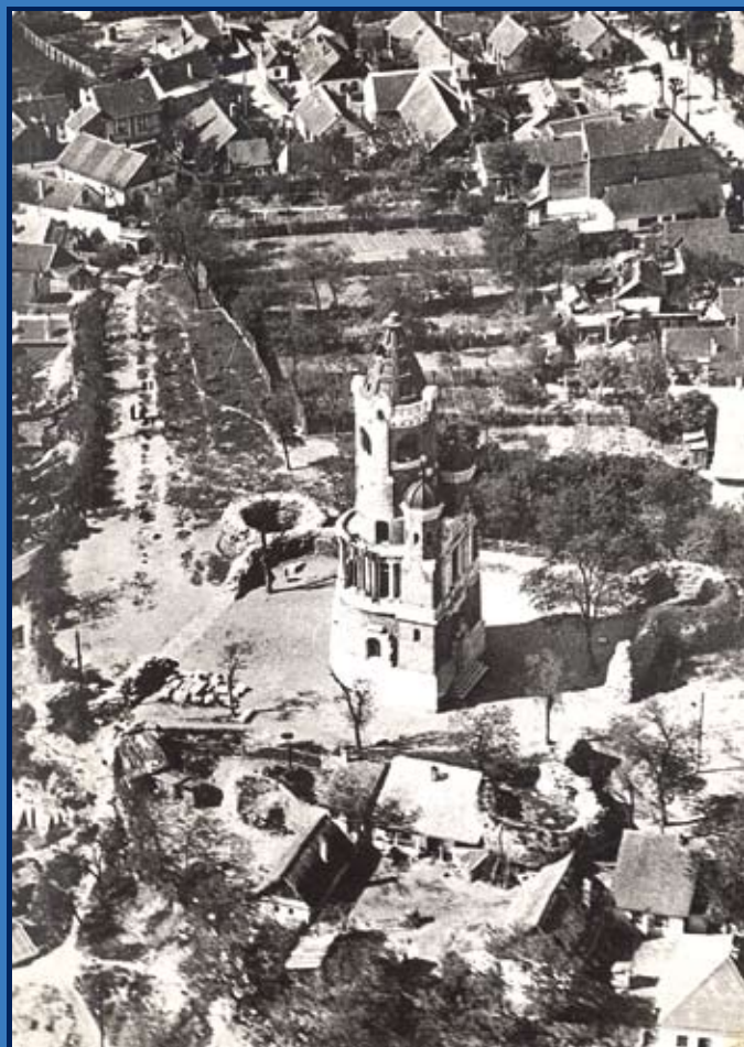
Земунска тврђава, 1936 Zemun Fortress, 1936