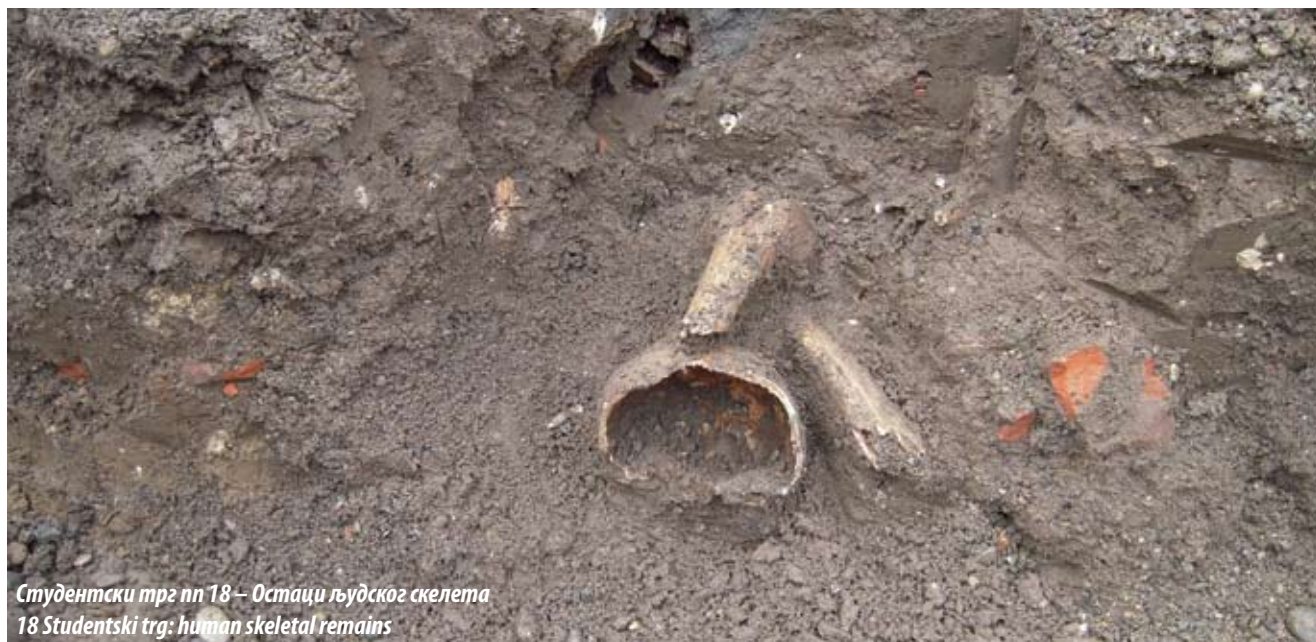
Студентски трг пп 18 – Остаци људског скелета 18 Studentski trg: human skeletal remains