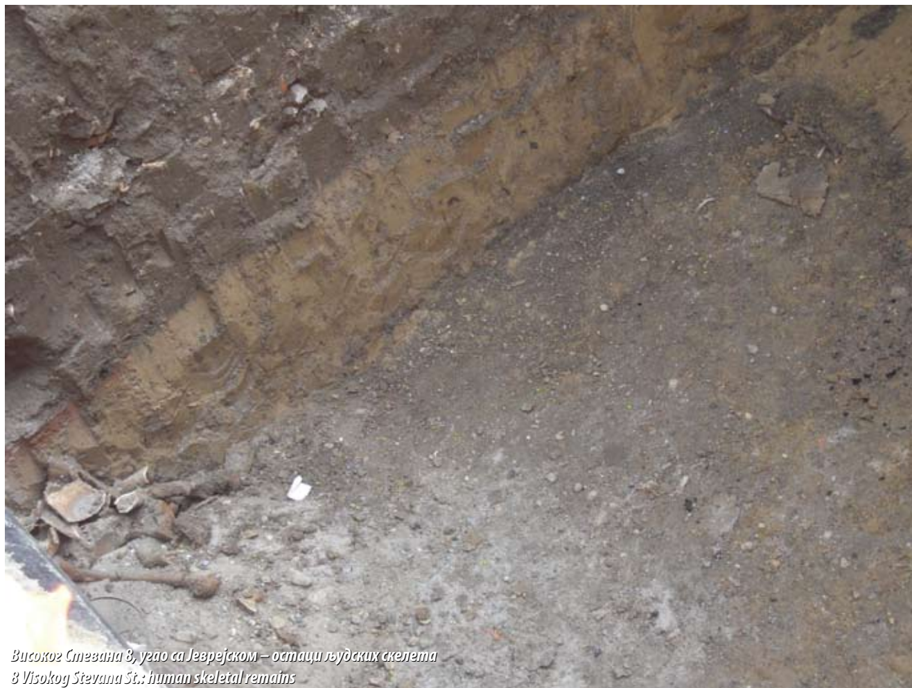
Високог Стевана 8, уздо са Језрејском – остаци људских скелета 8 Visokog Stevana St.: human skeletal remains

The period of Ottoman dominance (sites dated to the 15th – 16th c.)