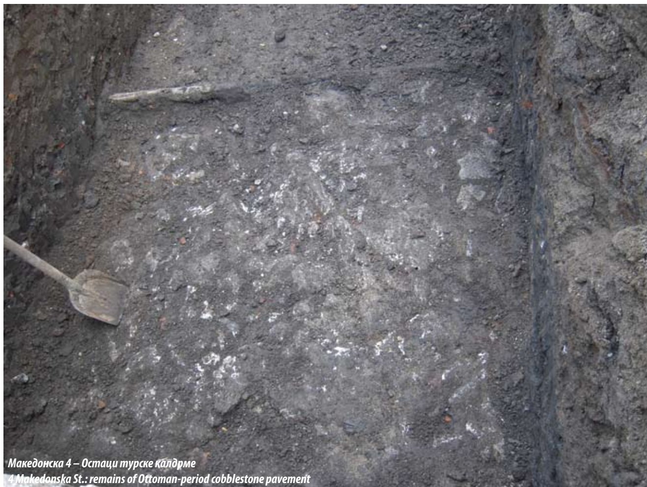
Македонска 4 – Остаци турске калдрме 4 Makedonska St.: remains of Ottoman-period cobblestone pavement

femurs) were buried on it. The grave may be roughly dated to a period between 1521, when the cemetery was established, and 1688, when Belgrade was conquered by the Austrians and the cemetery probably fell out of use.