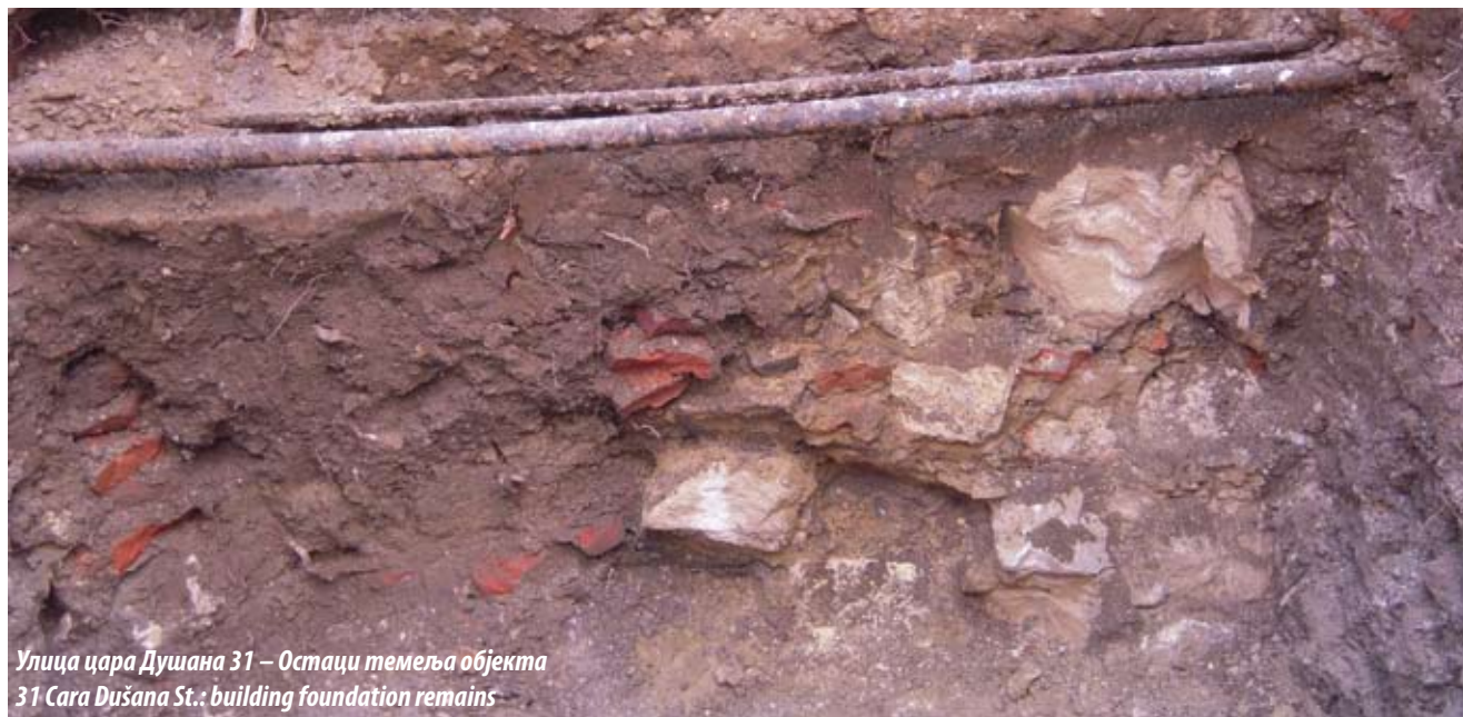
Улица цара Душана 31 – Остаци темеља објекта 31 Cara Dušana St.: building foundation remains