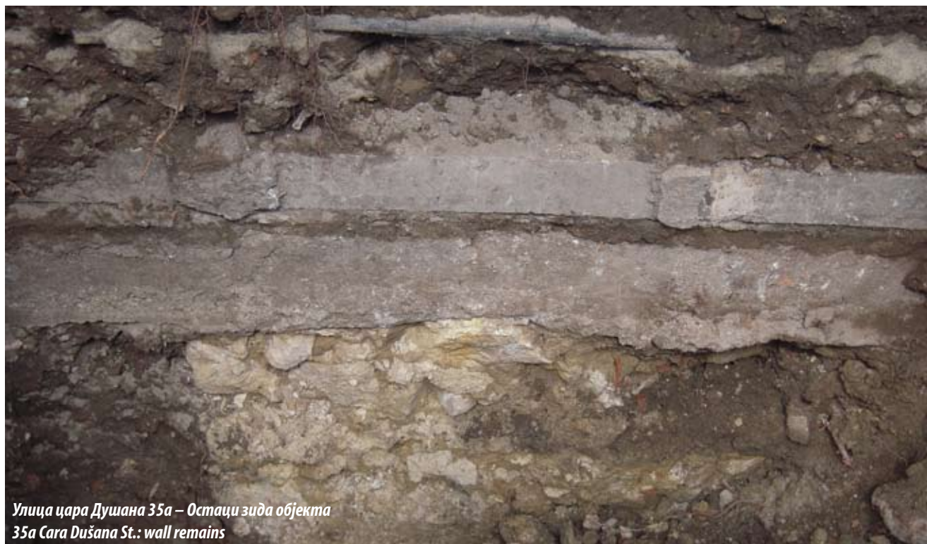
Улица цара Душана 35а – Остаци зида објекта 35а Cara Dušana St.: wall remains