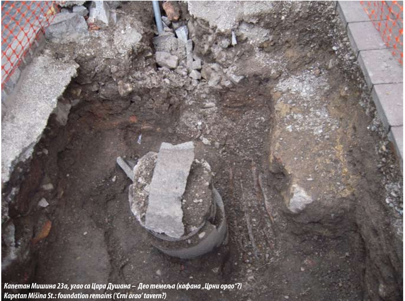
Капетан Мишина 23а, угао са Цара Душана – Део темеља (кафана „Црни орао“?) Kapetan Mišina St.: foundation remains ('Crni orao' tavern?)

tram rails at 4 Makedonska St., of a private Ottoman house with a porch at 46 Strahinjića bana St., of the tavern “Crni orao” (Black Eagle) at 23a Kapetan Mišina St., of the foundations of merchants’ houses from the first half of the 20th century in the area around Knez Mihailova St., and plentiful fragments of the so-called “urban” pottery, will nonetheless add to the picture of the origins and development of Belgrade.