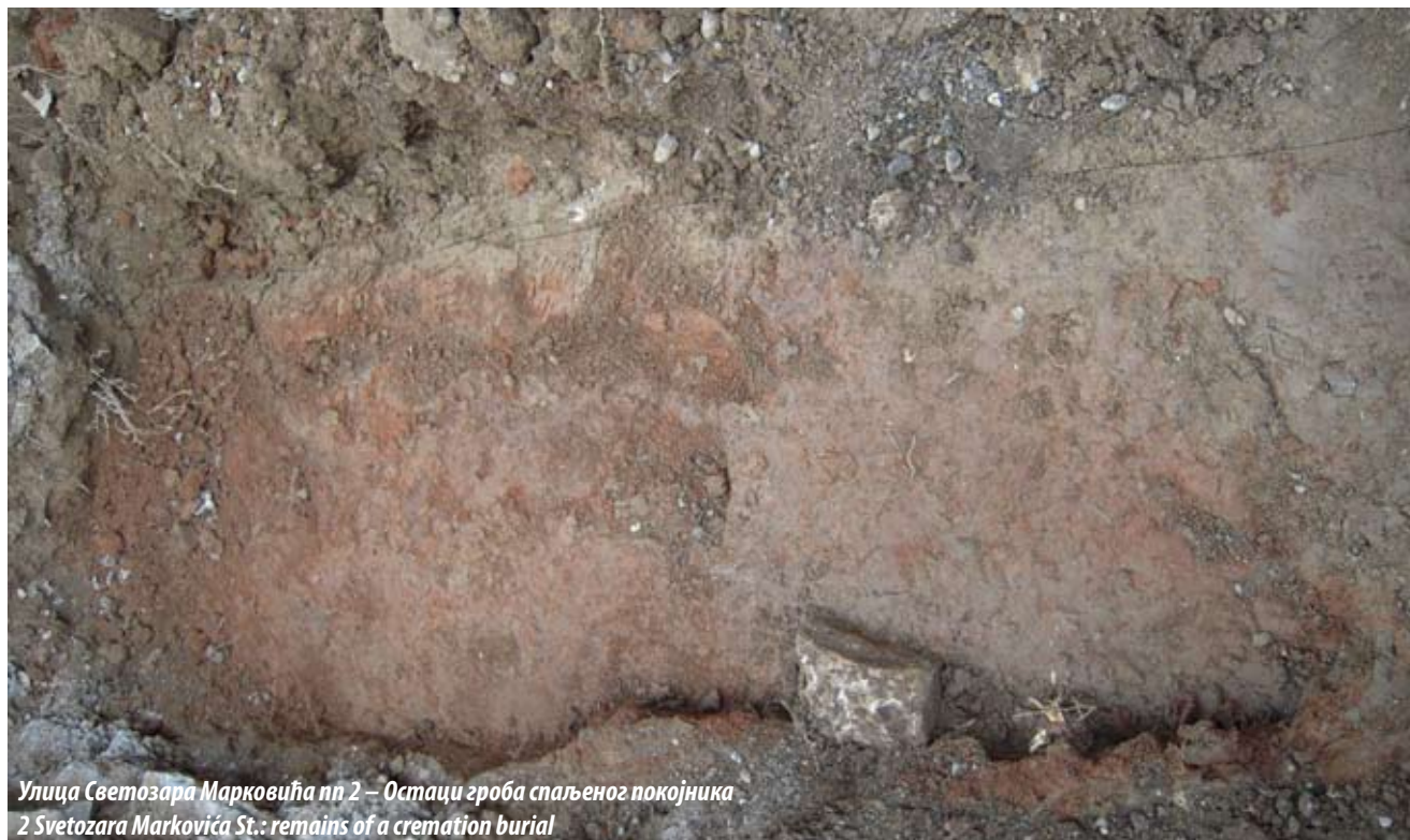
Улица Светозара Марковића пп 2 – Остаци гроба спаљеног покојника 2 Svetozara Markovića St.: remains of a cremation burial