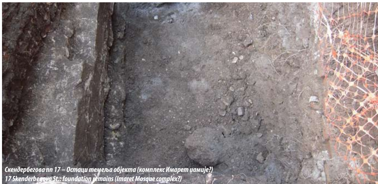
Скендербегова пп 17 – Остаци темеља објекта (комплекс Имарет џамије?) 17 Skenderbegova St.: foundation remains (Imaret Mosque complex?)