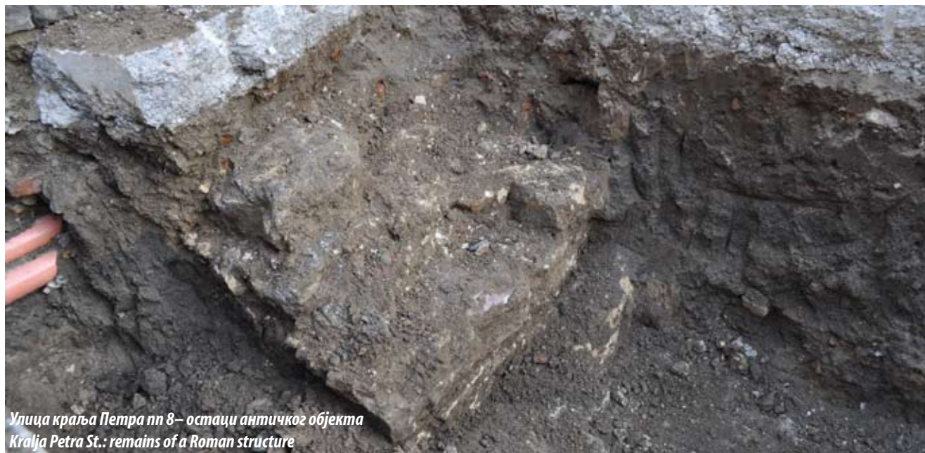
Улица краља Петра пп 8 – остаци античког објекта Kralja Petra St.: remains of a Roman structure