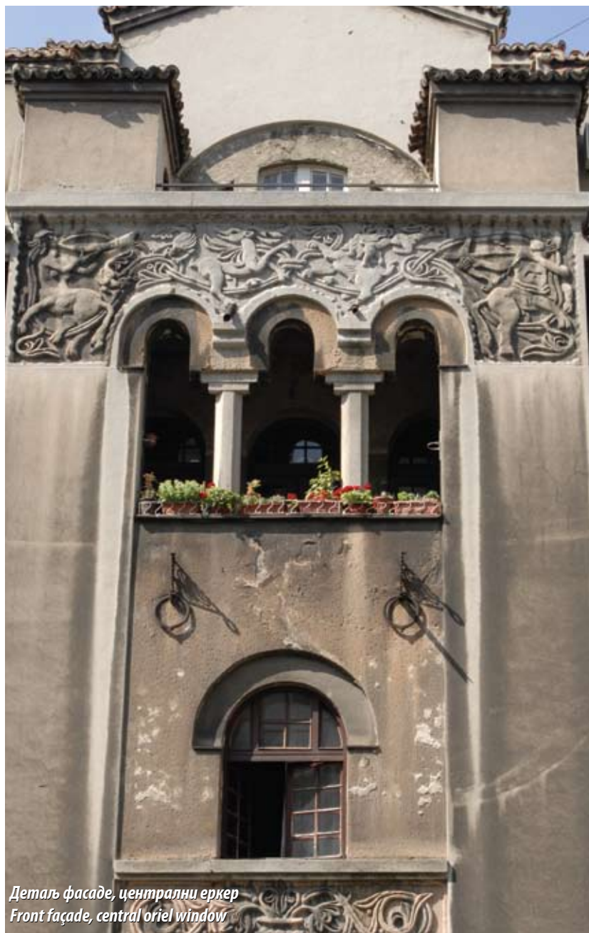
Детаљ фасаде, централни еркер Front façade, central oriel window

Z. M. Jovanović, Aleksandar Deroko (Belgrade 1991)