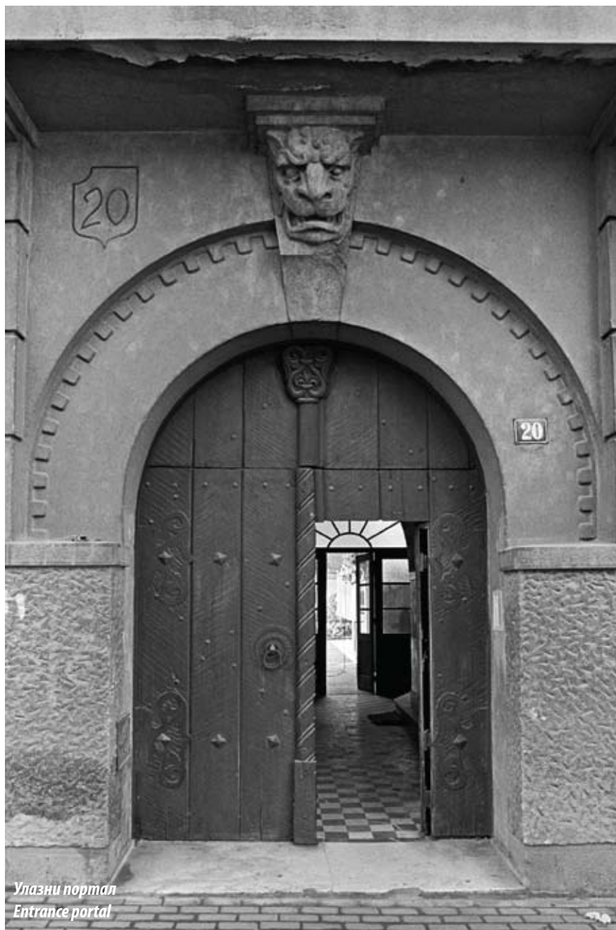
Улазни портал Entrance portal

The house of Colonel Elezović was built in 1927, soon after the young architect's return from Paris, and is among his earliest executed designs. Its front elevation shows the ground floor, two upper floors and an attic. Small rental flats occupy the ground floor and the first floor, studio flats the attic, while the owner's flat occupies the entire second floor and is the most lavishly treated portion of the street façade.