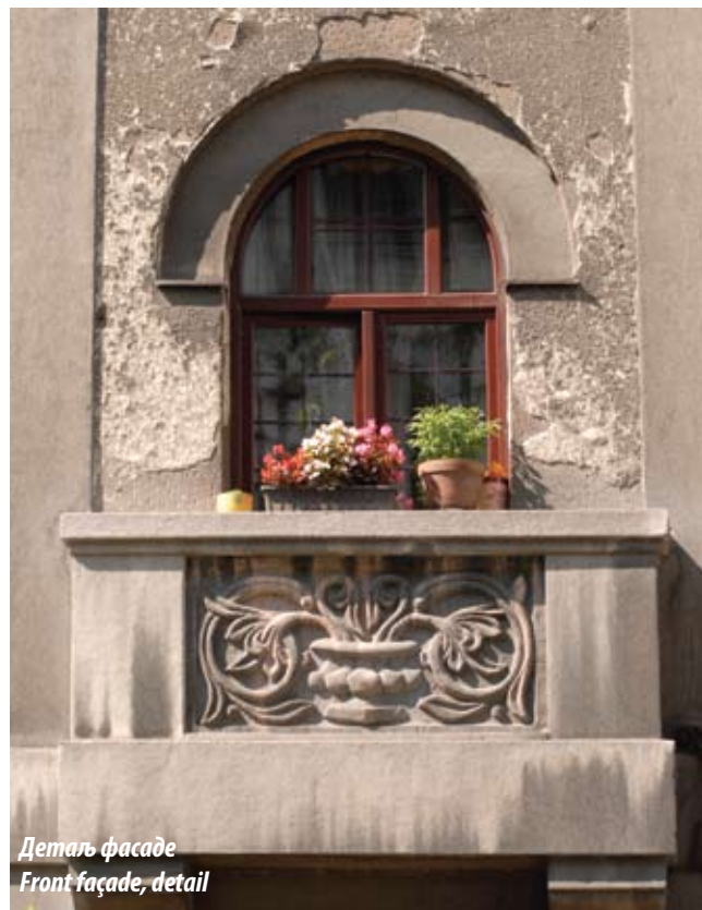
Деталъ фасаде Front façade, detail

According to the architect's own words, the owner's wish was for the building to evoke romantic olden times. Without drawing directly on the Serbo-Byzantine style, Deroko met this wish in a quite unusual way, combining old and modern, decorative and planar, sacred and profane, historical and martial. The façade attained the required romantic note, but the question of its deeper source remains open. Now it reminds us of a castle, now of a fortress, but eventually we realise that the setting is a very urban one and that it is where the house of Colonel Elezović belongs.