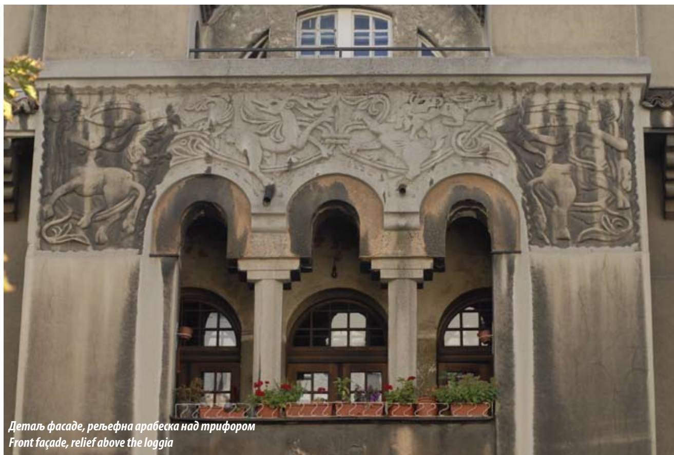
Деталј фасаде, рељефна арабеска над трифором Front façade, relief above the loggia