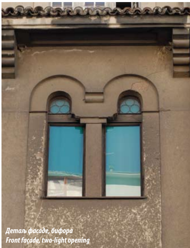
Деталъ фасаде, бифора Front façade, two-light opening