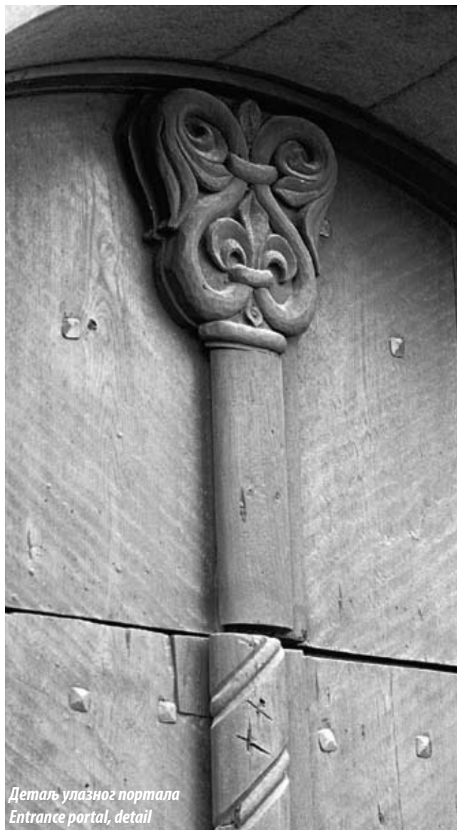
Детаљ улазног портала Entrance portal, detail

Због својих посебних архитектонских и културно-историјских вредности кућа пуковника Елезовића проглашена је за споменик културе (Одлука, „Сл. гласник РС“ бр. 73/07).