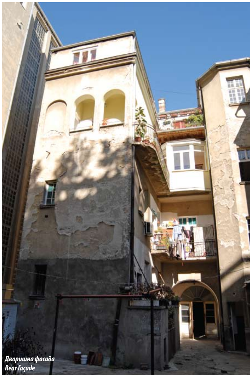
Дворишна фасада Rear façade

младог архитекте из Париза и спада међу његове прве изведене пројекте. С улице сагледава се приземље, два спрата и зона мансарде. Мали станови за издавање налазе се у приземљу и на првом спрату, гарсоњере за самце на мансарди, док стан сопственика куће заузима читав други спрат. У обради уличне фасаде ова зона је свакако и најраскошније третирана.