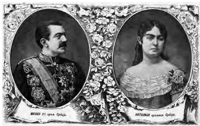
Сл. 1. Портрети краља Милана и краљице Наталије из 1882, Орао, илустрирани календар из 1882

После кратких тајних договора у Србији је уследила дипломатска припрема код великих сила. У складу са одредбама Тајне конвенције Аустро-Угарска је подржала одлуку српске владе, у чему су је следиле остале европске