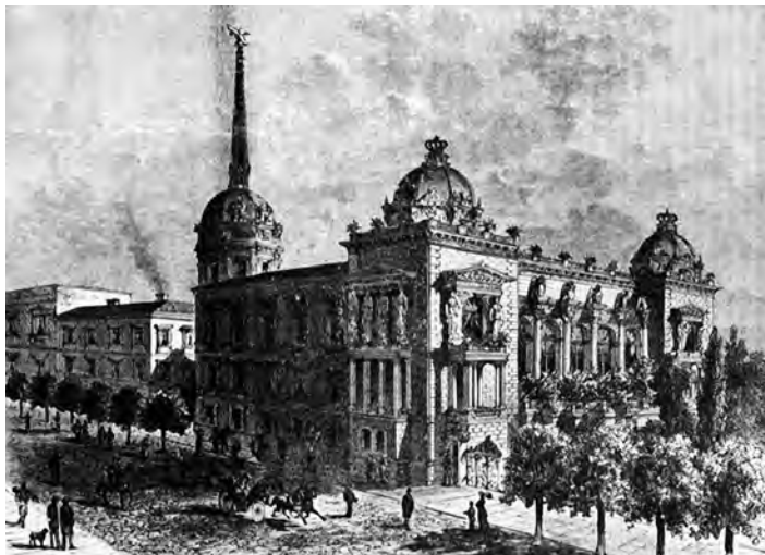
Сл. 7. Изглед Двора краља Милана из 1882, цртеж Сјојана Тијелбаха

поред политичке ситуације и традиција, коју су карактерисали, с једне стране, још увек присутно турско наслеђе, а с друге – црквена православна традиција и европски културни модел. 139 Постојање три различита културолошка модела давало је специфичан печат ефемерном спектаклу као политичко-културној активности. Одјек турске традиције видљив је у начину украшавања и осветљавања радњи и приватних кућа. Српско-православни елемент дошао је до изражаја у црквеном обреду у Саборној цркви, док је европска традиција била уткана у општи концепт свечаности инсистирањем на главним топографским тачкама града, али и у формама и украсима ефемерних конструкција и архитектонских кулиса, које су директно преузимане из раније европске праксе. 140