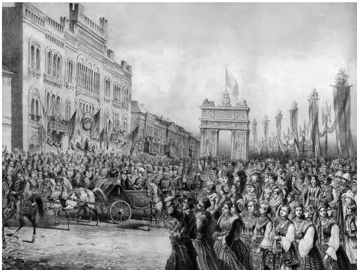
Сл. 3. Исћоријска сцена на Великој йијаци у Београду 10/22. авјусћа 1872, лијојграфија Карола Пој Саймарја

Према утврђеној традицији српских владара, поводом свечаног чина одликовани су заслужни појединци новоустановљеним орденом Белој орла. 78 Својим изгле-