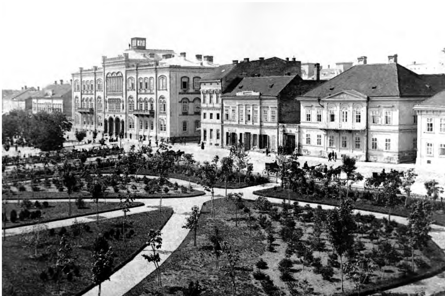
Сл. 5. Краљев шир крајем 19. века

За краља Милана и тадашњу напредњачку владу првенствени циљ проглашења Краљевине Србије био је спасавање режима. Иако њихова намера није била да догађај искористе за националну пропаганду, целу Србију захватио је талас патриотског одушевљења. Краљу и влади непрестано су стизали телеграми, поздравне адресе и позиви из свих градова Србије, међу којима се посебно издвојила честитка Карановчана, који су, повезујући славу старе српске средњовековне династије са новим краљем независне Србије, пожелели да се »под