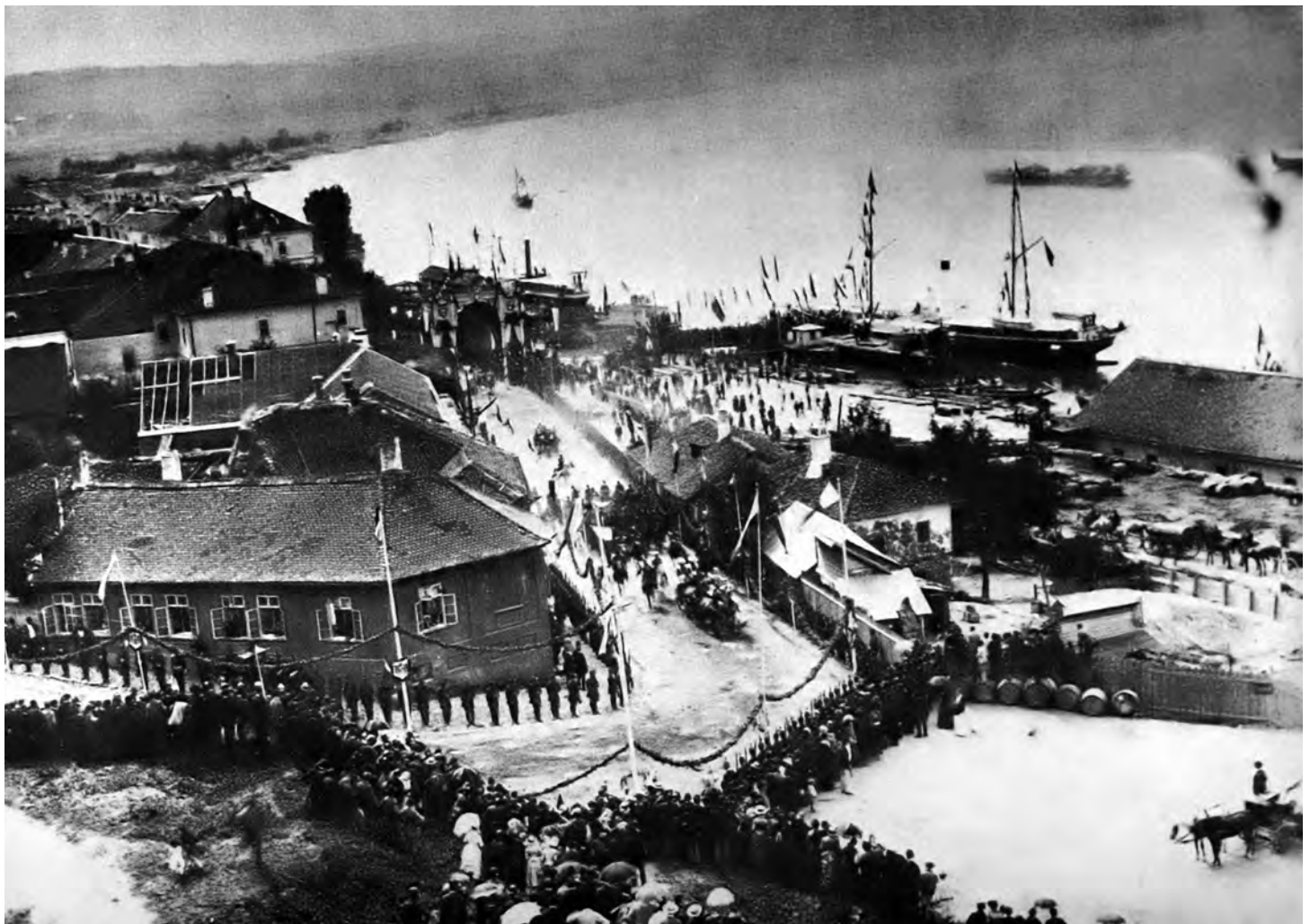
Сл. 6. Изглед београдској кристалицији из 1884

Две мање пирамиде у Нишу биле су израђене од пушака и другог оружја, што је мењало њихово примарно симболичко значење. Милитантни трофеји су првен-