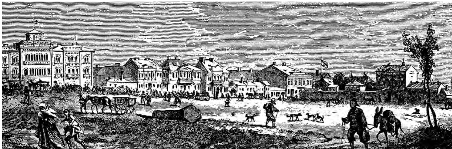
Сл. 4. Велика њијаца око 1859

дом, орден је представљао директну алузију на краљевску круну, чиме је постао још једна формална потврда легитимности новог државног устројства и династије, која се темељила на баштини средњовековне српске државе. Централни мотив ордена – немањићи дуглави орао – постаће, потом, и средишњи елемент грба Краљевине Србије. 79 Осим ордена Белој орла , који је додељиван за »све заслуге према Краљу, Краљевском дому или према држави по свим гранама државне управе«, краљ Милан је установио и орден Свештој Саве у циљу »награђивања заслуга стечених за просвету, књижевност и лепе вештине«. 80 Поводом обнове краљевине изливена је медаља по угледу на праксу европских владара, која води порекло из ренесансне традиције обележавања важних историјских догађаја. 81 Сребрна медаља кружног облика понавља централни мотив ордена. На предњој страни налази се државни грб Краљевине Србије, док је на полеђини натпис Обновиоцима Српске Краљевине благодарна Оштаџбина .