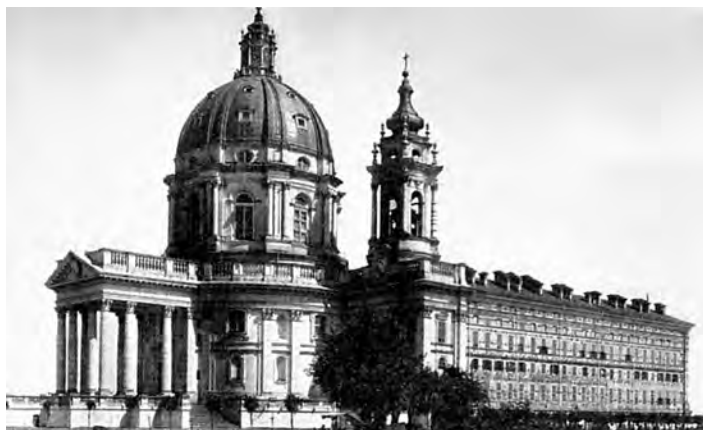
Сл. 5. Ф. Јувара, Суйерија у Торину