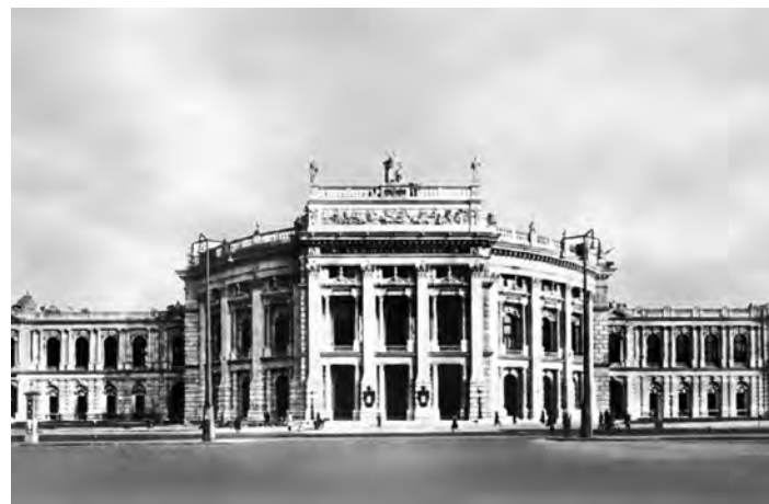
Сл. 10. Г. Земјер – К. Хазенауер, Бургтеатар у Бечу

атикама бочних фасада. Централни улаз у Скупштину Илкић је разрадио знатно некомпактније од Јовановића, евоцирајући еклектицизам и претерану сложеност маниристичког градитељства. То је несумњиво најмање успели сегмент читавог ансамбла.