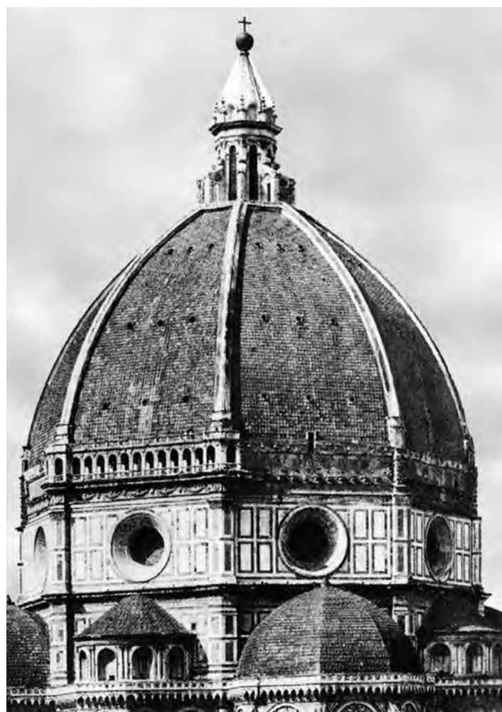
Сл. 7. Ф. Брунелески, купола катедрале у Фиренци