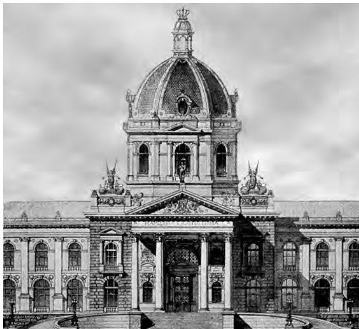
Сл. 1. К. А. Јовановић, идејни пројекат Дома Народној пресјавништва