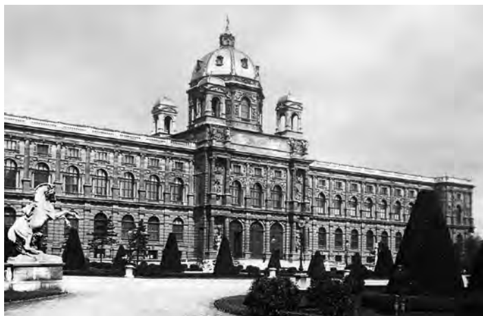
Сл. 9. Г. Земјер – К. Хазенауер, Уметничко-историјски музеј у Бечу