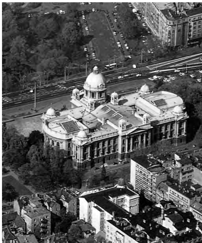
Сл. 3. Поглед на Скупштинску зграду из ваздуха

од средине прве до истека четврте деценије двадесетог века. На основу проучавања расположиве грађе може се закључити да значајна, али не и дефинитивна улога у конциповању здања припада архитекти Константину А. Јовановићу (1849–1923), 7 који је серијом идејних пројеката из 1892. године одредио функционални концепт и главне елементе спољне композиције скупштинског здања. Због недостатка средстава и измењених политичких прилика Јовановићев пројекти нису реализовани. Следећи умногоме свог претходника, један од најсвестранијих и најплоднијих домаћих архитеката на размеђу векова – Јован Илкић (1857–1917), 8 победник на конкурсном пројекту из 1901. године, започео је реализацију скупштинског здања 1907. упркос незадовољству