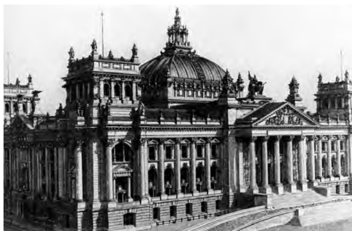
Сл. 12. П. Вало, Рајхсшај у Берлину