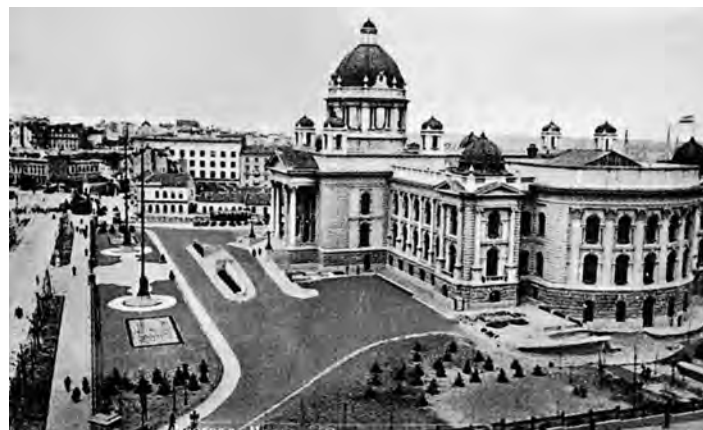
Сл. 6. Поглед на Дом Народној њредсџавнишџива из Таковске улице

Илкићева једносратна скупштинска зграда, са високим приземљем, обухвата велику површину основе планирану за дводомни парламент, иако је почетком