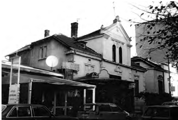
Сл. 3. Вила Боторић – садашње стање

амбијенталној целини, коју су украшавале те две стилске фасаде, између којих су биле две друге тадашње приземнице, још је један од многобројних одраза небриге и непоштовања наше прошлости. Садашњи власници зграде – наследници породице Боторић – много пута су ургирали да се такав амбијент сачува обраћајући се и општинској власти и Заводу за заштиту споменика културе. Али, неефикасна и незаинтересована власт и немоћан Завод нису ништа учинили да заштите тај део »Енглезовца«. Ових дана се увелико дискутује о планираном руше-