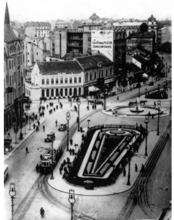
Сл. 2. Изглед Теразија после завршетка велике реконструкције, 1928/1929. године

Значај и улога, које су Теразије задобиле у животу и нарастању Београда, као и сам назив овог потеза, били су недвосмислено условљени феноменом константног присуства воде. 4 Поред тога што почива на великом броју подземних извора, Теразијски плато заузима изванредну позицију и одличну висинску коту на Београдској греди, чиме се природно наметнуо као идеална траса за две главне водоводне линије које су напајале савски део града. 5 С тим у вези, сасвим је логично што је баш на овом потезу (на месту где се данас налази подземни пролаз испред хотела »Москва«) била постављена највећа и главна црпна станица помоћу које је пијаћа вода сакупљана и спровођена у остале делове града. Те специјалне уређаје за воду Турци су називали »теразијама«, па одатле потиче и само име овог централног дела Београда. 6 Почетком деветнаестог века, када су се стекли услови за развој новог српског Београда, а захваљујући стратешком положају и важној друштвено-економској улози коју су већ тада задобиле, Теразије су биле препознате као његово ново средиште. Не задуго, Теразије постају највиталнија и најдинамичнија позоришта живота и развоја Београда.