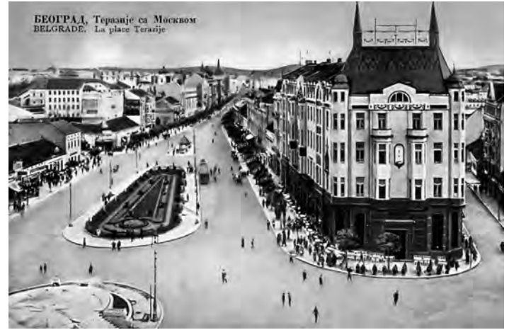
Сл. 7. Снимак Теразија око 1925. године

декорације Теразија. 31 Архитекта Брашован је на месту водоскока пројектовао велику степенасту кружну платформу, са декоративном каменом оградом, украсним вазама и радијално постављеним фигурама осам лежећих лавова (сл. 6). Претпоставља се да су фигуре лавова биле израђене од папјемашеа, јер их већ у 1925. години нема ни на једном сачуваном снимку (сл. 7). Брашованова конструкција, без лавова, стајала је на Теразијама све до 1927. године. Тада је, коначно, подигнута Теразијска фонтана, која је употпунила и заокружила смисао великог преуређења Теразија, подаривши им упечатљиву живописну ноту неодољивог магнетизма.