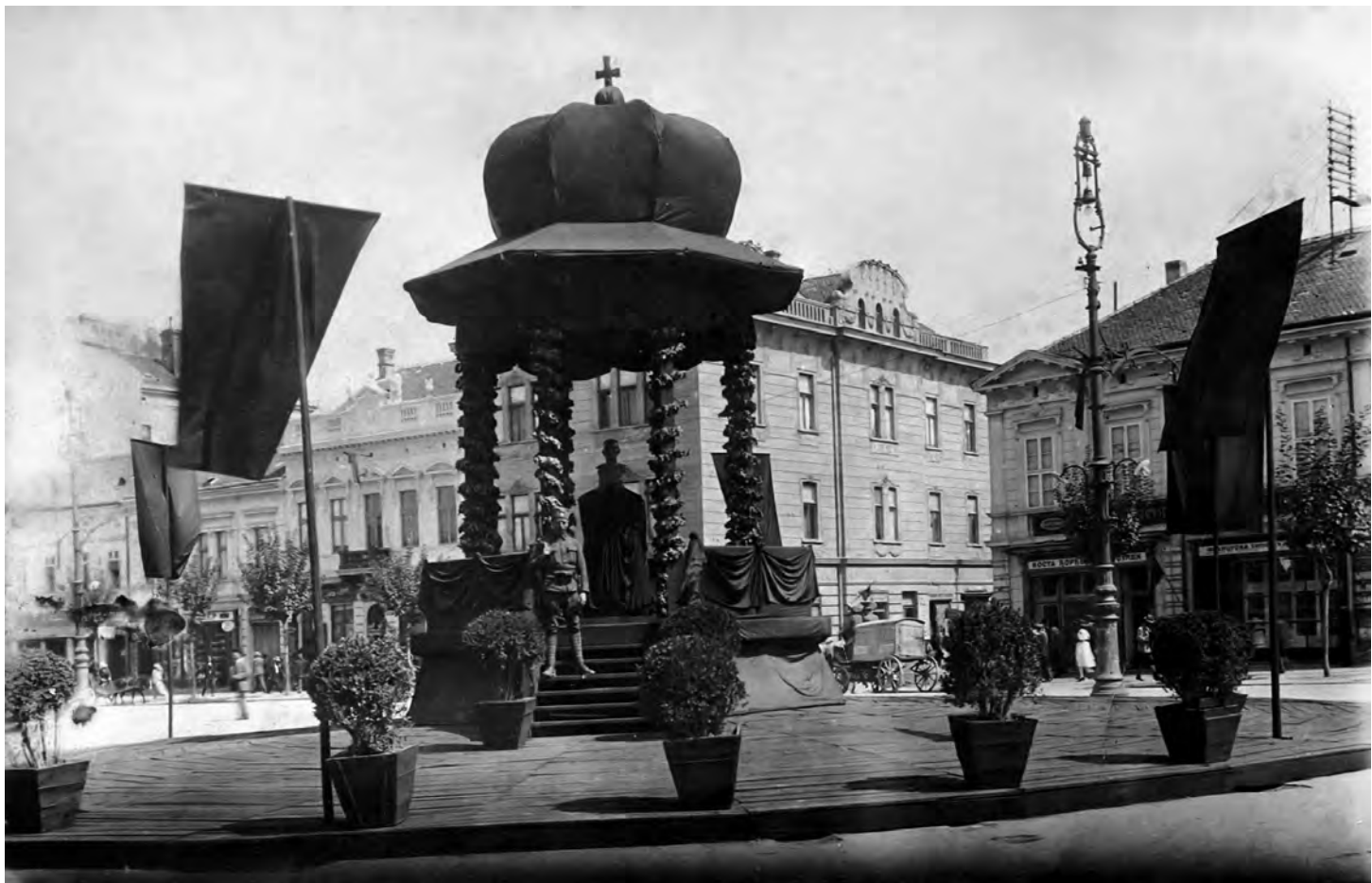
Сл. 5. Комеморативни јавиљон на Теразијама постављен поводом смрти краља Петра I Карађорђевића, август 1921. године

У време распламсавања поменуте полемике, на Теразијама је, након две деценије од замисли, фонтана најзад и саграђена. Из горенаведених чињеница је јасно да првобитно планирана Теразијска фонтана никад није изведена. Да би се правилно разумела остварена концепција фонтане на Теразијама, морамо се вратити у време почетака великог уређења овог потеза. Теразије су, дакле, између 1911. и 1913. године добиле естетски уобличену партерну површину, своју »трећу« фасаду, која је овом потезу подарила допадљив просторни тон. Само средиште, које је било намењено подизању фонтане, неретко је, сходно потребама, мењало форму и функцију. Недостатак техничке документације и неприступачност