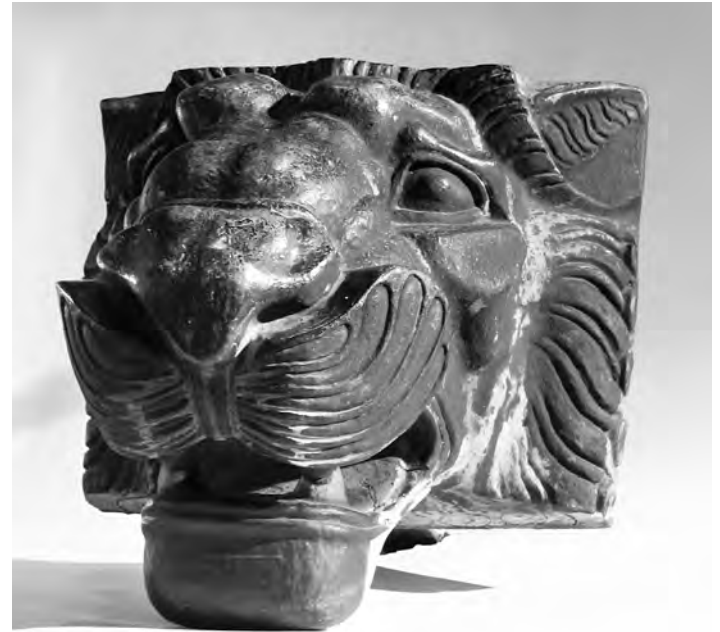
Сл. 4. Лавља глава

свечаности церемонијалног тријумфалног уласка војске у град, изведен је лаки дрвени декоративни славолук, украшен венцима и цвећем, а на месту предвиђеном за фонтану оспособљен је водоскок са једноставним плитким кружним базеном и снажним млазницама које су воду бацале изузетно високо и распршивале је у широком паду. 20