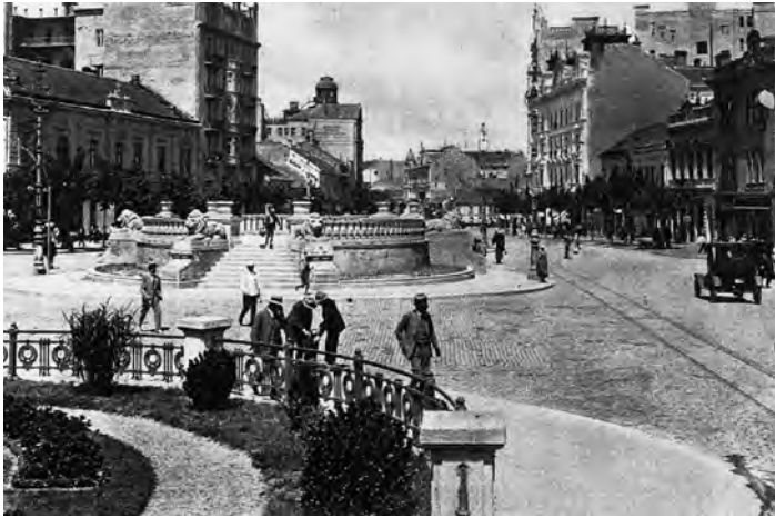
Сл. 6. Спйенасија кружна илайформа са лавовима, део йројектйа уређења Теразија арх. Драише Брашована йоводом церемоније краљевској венчања, 1922