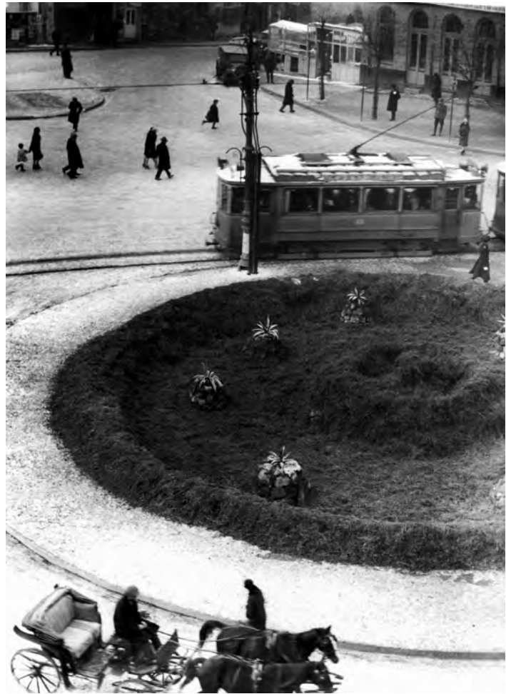
Сл. 9. Теразијска фонтана прекривена шљунком за време зимских месеци, снимак Аце Симића око 1930. године

Најављиван резултат предузете трансформације претворио се у сопствену негацију. Неоправдани nihilizam истргао је из срца града мали хумани ансамбл, а уместо њега постављен је јединствени коловоз са широким асфалтним тротоарима. Тешко стечен живописни