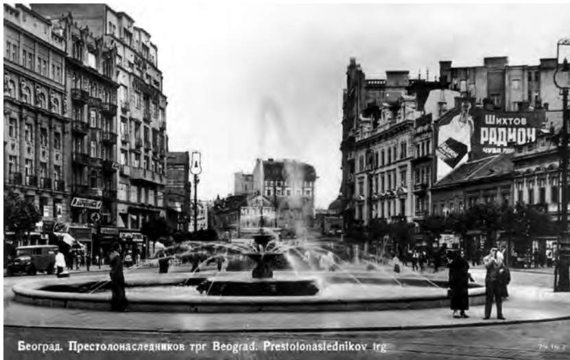
Сл. 1. Теразијска фонџана, снимак из периода 1932–1936. године