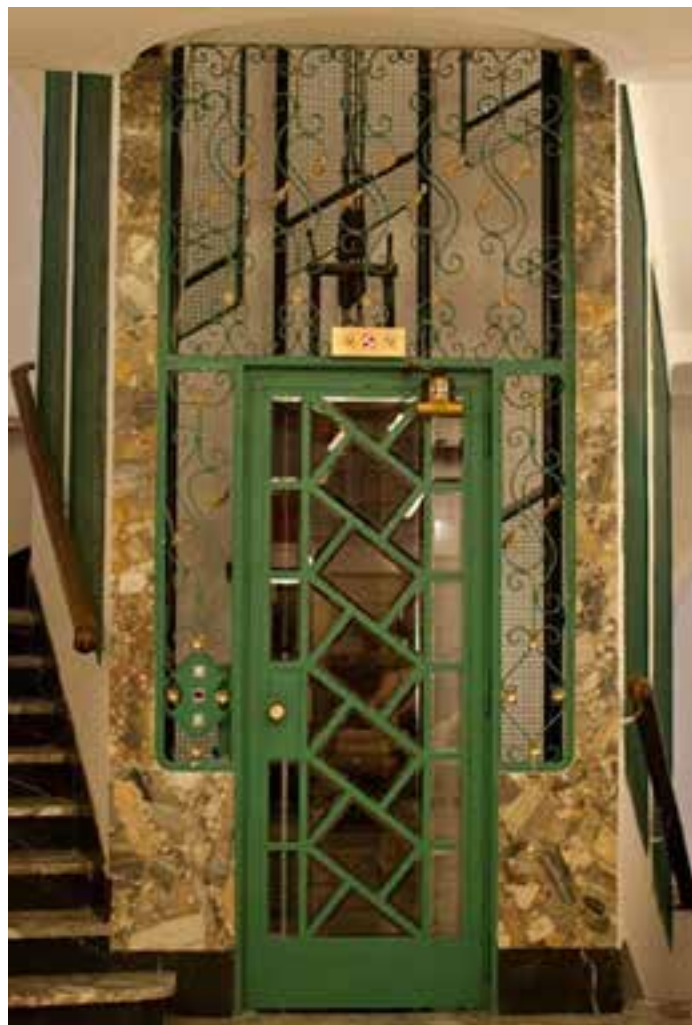
Сл. 3. Првобитни лифт је сачуван до данас, снимљено 2011. године