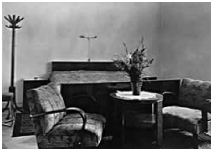
Сл. 2. Изглед једне хотелске собе, снимљено 1938. године