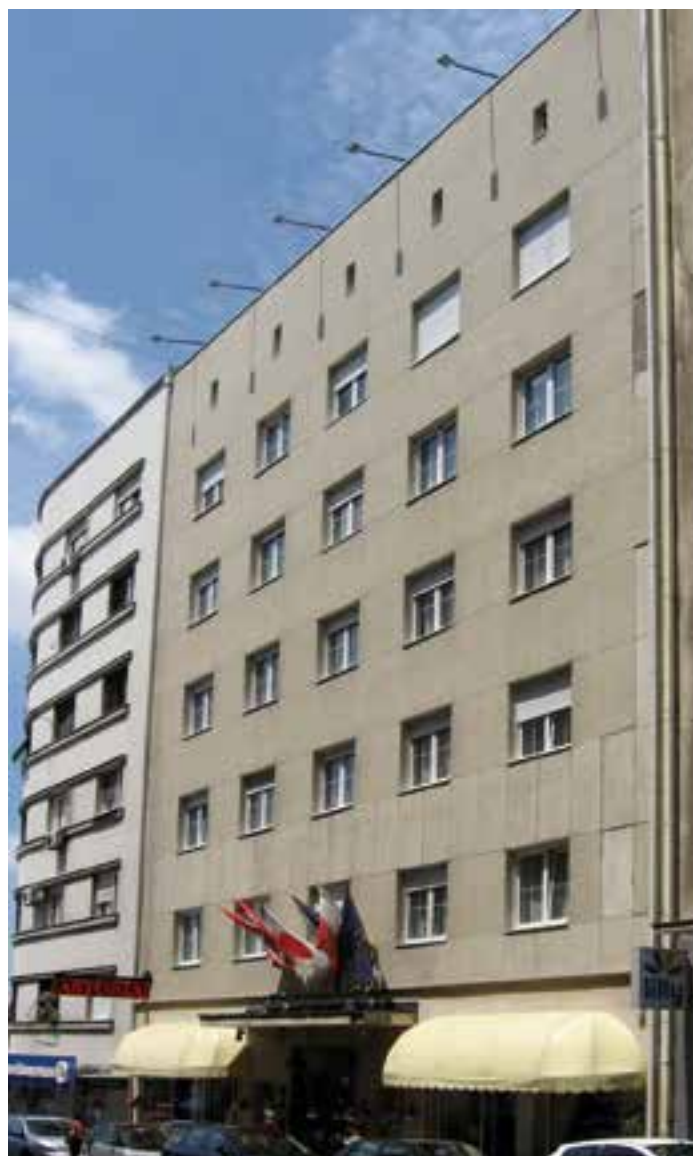
Сл. 1. Хотел „Astoria“, данашњи изглед

Иако је првобитна замисао била другачија, према положају који заузима, односно према облику парцеле на којој је грађена, „Astoria“ спада међу хотеле