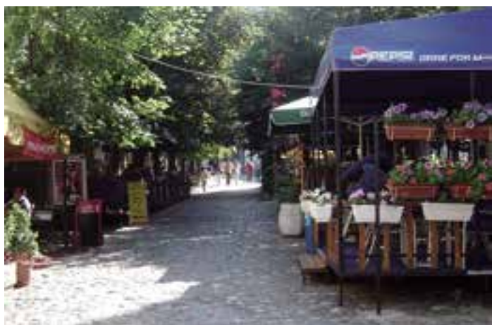
Сл. 1. Скадарлија