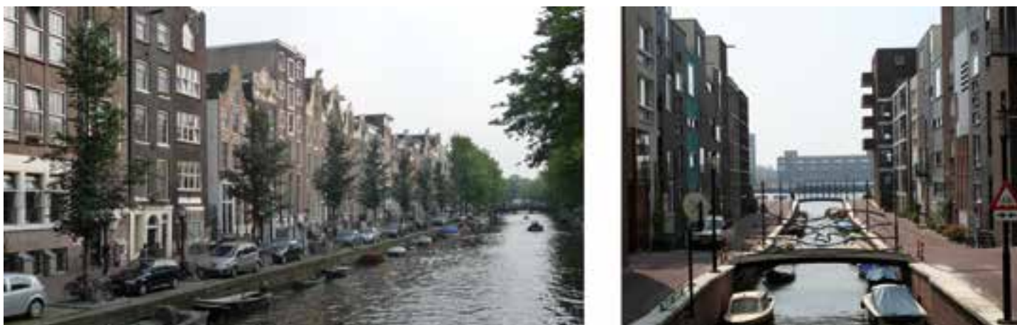
Сл. 5. Амстердам, јединство различитости

усклађених решења. Најбољи начин да се дође до таквог решења јесте да се усвоји стратегија учешћа јавности, која обухвата све локалне интересне групе и појединце.