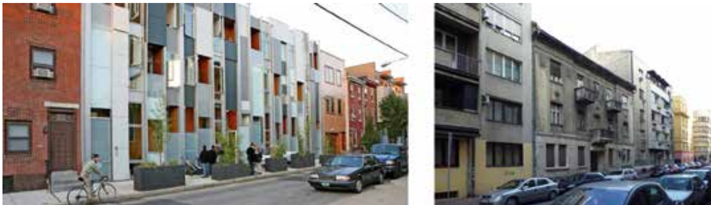
Сл. 6. Исти или слични параметри, а простори различитој квалитети

Опис поступка управљања пројектом, који на детаљан и илустративан начин објашњава све фазе неопходне за имплементацију једног плана, изложен је и у Приручнику за урбани дизајн . 21 У Приручнику је цео поступак приказан и разложен у пет фаза. Полазна фаза