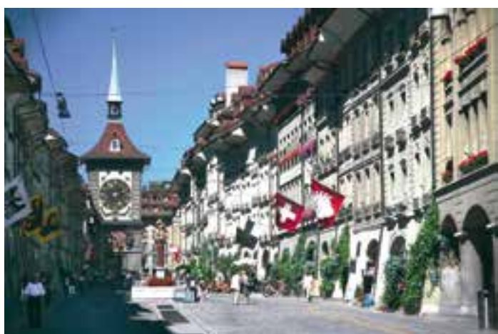
Сл. 2. Kramgasse, Bern – динамичан и грамаћичан амбијентални простор

отвореног плана, који неретко доводи до ексцеса приликом реализације и нарушавања вредних амбијената и објеката, успостављање ове дисциплине код нас све више добија на значају. 3