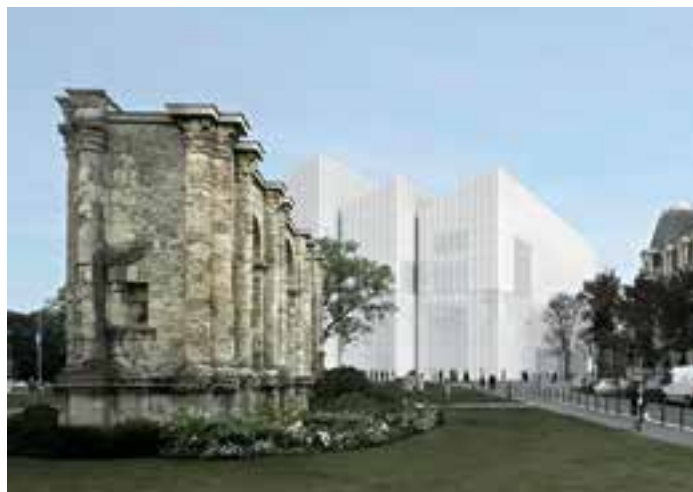
Сл. 4. Musée des Beaux-arts, Reims, France

Анализом карактеристика простора који су у свести људи детерминисани као препознатљиви и пријатни амбијенти, дошло се до принципа и циљева доброг урбаног дизајна. Њихова сврха је у подсећању на обележја простора о којима је потребно водити рачуна да би се осмислило успешно и пријатно место. Циљеви се међусобно надопуњују и преклапају.