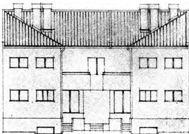
Сл. 3. Изглед из дворишта (према пројекту); остварен је леви део