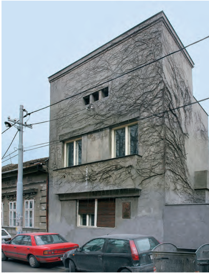
Сл. 4. Њејошева бр. 18: кућа Јована Карамате