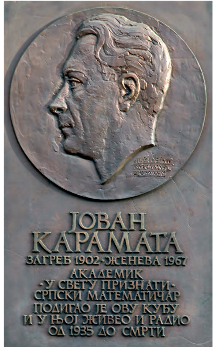
Сл. 5. Спомен-плоча на фасади куће Јована Карамате